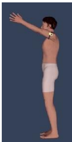
Slika 5. Gyko senzor kod izvedbe predručenja