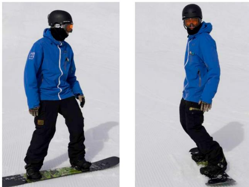
Slika 7. Prikaz osnovnog položaja daskaša

Osnovni položaj na dasci opisujemo pogledom u smjeru kretanja, uspravnim trupom, rukama opuštenim uz tijelo u blagom odručenju s donjim dijelom tijela u blagom čučnju i težištem u centru daske.