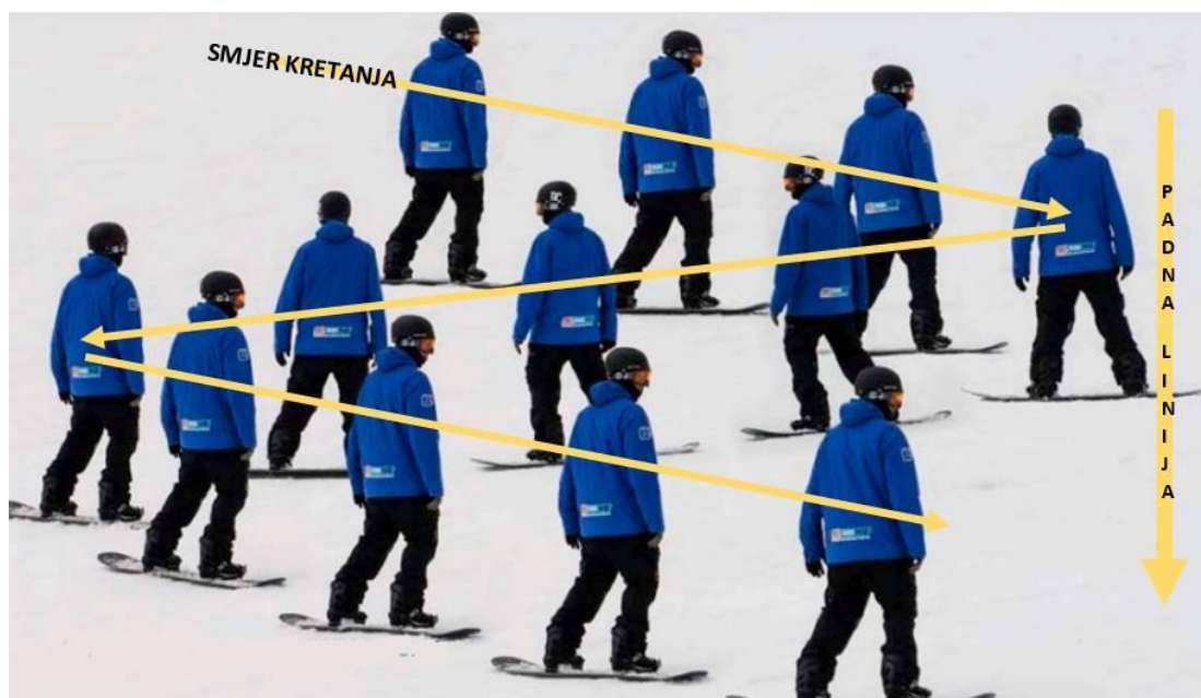
Slika 9. Prikaz vježbe „lebdeći list“