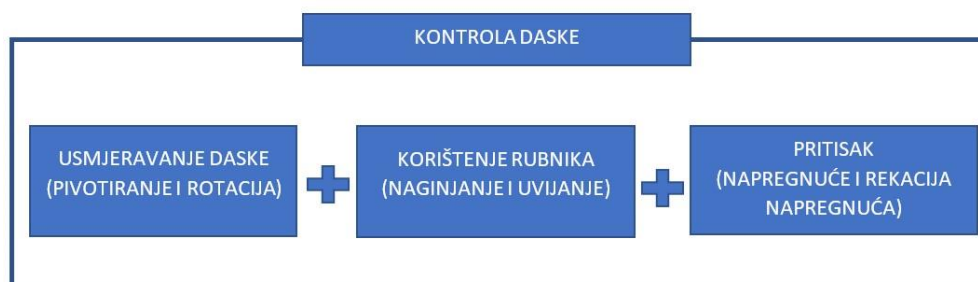
Slika 6. Prikaz neophodnih pokreta koji dovode do kontrole daske

Usmjeravanje daske koristi se za odabir željenog smjera kretanja, najbolje se primjenjuje nakon korištenja rubnika i opterećenja daske. Raspodjela opterećenja po dužini daske ima značajan učinak na upravljanje. U centralnom položaju u odnosu na dasku izvodit će se rotacije, dok se pivotiranje izvodi kada je centar težine daskaša dominantno na prednjem ili stražnjem dijelu daske. Pomicanje centra težišta prema nosu daske olakšat će upravljanje dok će prijenos težine na rep daske otežati upravljanje. Za učinkovito upravljanje potrebno je ostati centriran u odnosu na dužinu daske. S obzirom na različitost terena i zadatka potrebno je kombinacijom rotacije i pivotiranja usmjeravati dasku u željenom smjeru kretanja.