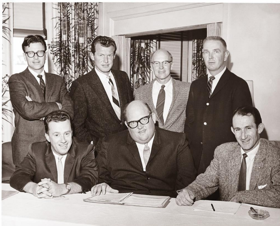
Slika 2. Osnivači Američke udruge instruktora daskanja a snijegu