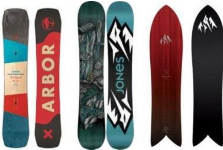
Slika 5. Različiti tipovi i oblici dasaka s obzirom na namjenu

Alpske natjecateljske daske koriste se za vožnju pri velikim brzinama po uređenim stazama. Oblik daske je uži i duži od ostalih skupina. Na ovakvim tipovima dasaka upotrebljavaju se tvrdi vezovi i cipele. Daske je jako uska radi brže mogućnosti prijelaza s jednog rubnika na drugi. Zbog natjecateljskih zahtjeva imaju dugi bočni luk i veliki stupanj tvrdoće. Ovi oblici dasaka koriste se u boardercross i freecarve disciplinama te nisu preporučljivi za početnike. Freeride daske po izgledu su dosta slične daskama slobodnog stila no tehničke specifikacije stvaraju najveću razliku. Upotrebljavaju se u kombinaciji s mekanim vezovima i cipelama. Prikladne su za početnike jer imaju široko područje namjene. Bočni luk je srednje veličine s nosom i repom koji su blago zaobljeni i podignuti. Ekstreme ovih tipova dasaka razlikuje nekoliko tehničkih specifikacija kao što su dužina daske za veću stabilnost, širina daske i lastin rep za bolju komponentu plutanja u pršiću te. U ovaj tip dasaka spadaju i splitboard daske. Daske slobodnog stila svojim tehničkim komponentama namjenu pronalaze najviše u izvođenju skokova, trikova i vožnju na umjetnim podlogama. Često su široke, lake za voditi i rotirati. Daske ovog stila imaju mekši i više podignut rep i vrh daske. Upotrebljavaju se meki vezovi i cipele te su daske često mnogo tanje i lakše, dok daska svojom niskim indeksom tvrdoće mnogo oprašta u smislu tehničke izvedbe (Zbor Trenera i Učitelja Snowboarda Hrvatske, 2022).