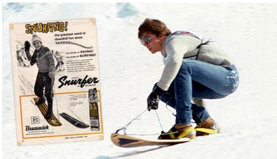
Slika 1. Reklamni letak za „Snurfer“

Izum prve daske približne namijene ovoj koju danas poznajemo pripisuje se Amerikancu po imenu Sherman Poppen koji je 1965. godine svojoj kćeri za Božić izradio i poklonio Snurfer . Snurfer nije imao posebnu kliznu plohu niti vezove, upravljanje je bilo predviđeno korištenjem ručke privezane užetom za vrh daske (Snowboard History Timeline Part 1: 1960's-70's, 1996).