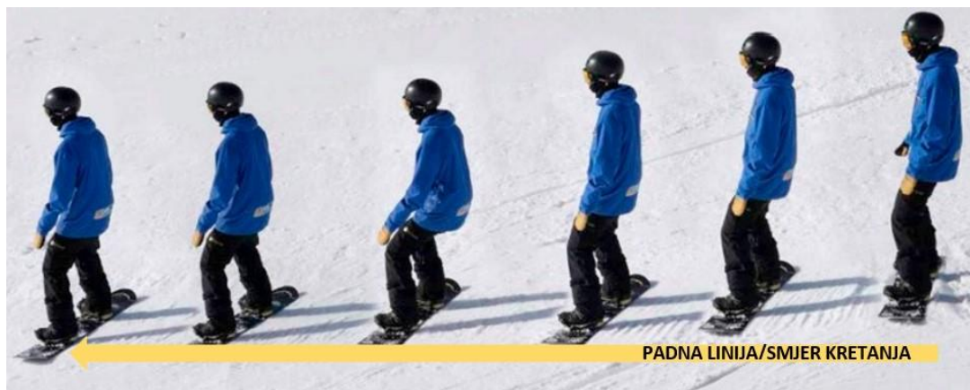
Slika 8. Prikaz bočnog otklizavanja