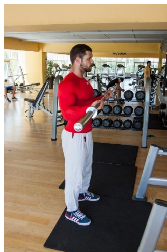
Slika br. 66