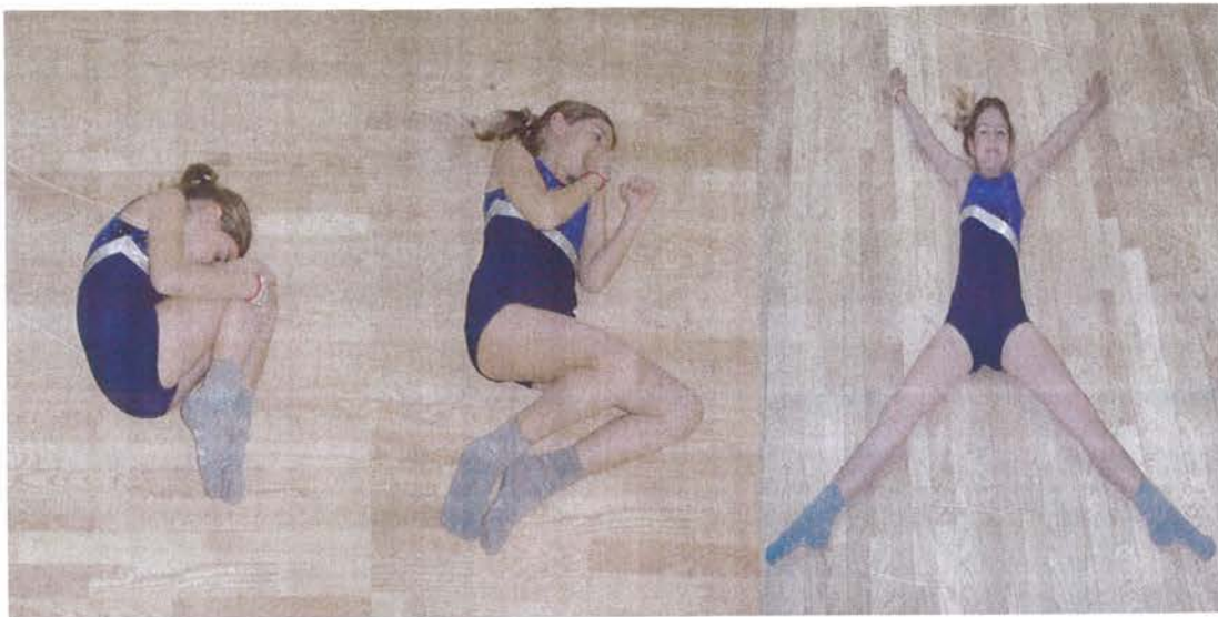
Slika 6. Širenje poput morske zvijezde