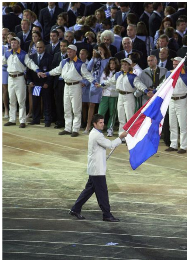
Slika 5. Zoran Primorac nosi hrvatsku zastavu na otvaranju OI u Sydneyu 2000. godine

Stolnotenisači Hrvatske osvojili su na Olimpijskim igrama jednu srebrnu i jednu brončanu medalju, ali nastupajući za reprezentaciju Jugoslavije (stolni tenis je dio olimpijskog programa tek od 1988. godine).