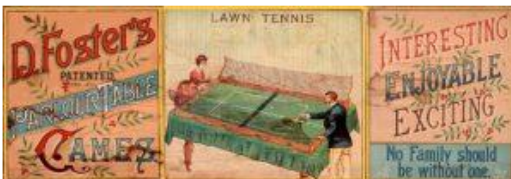
Slika 2. Igra na stolu koju je patentirao David Foster

U 19. stoljeću u Engleskoj počinje priča o stolnom tenisu, kada su u zatvorenim prostorijama za vrijeme lošeg vremena igrali nekakvu varijantu stolnog tenisa s teniskim reketima. Red postavljenih knjiga ili konzervi su predstavljale mrežu, a igra je prozvana „minijturni tenis“ (Uzorinac, 1988). U to doba igrale su se po cijeloj Velikoj Britaniji i njenim kolonijama, kao i u Americi, različite varijante minijturnog tenisa s nestandardiziranim rekvizitima i bez određenih pravila. Najraniji postojeći dokazi o stolnom tenisu su iz 1880. godina ,a to je set koji je prikazan na Slici 2.,koji je napravio David Foster, patentiran u Engleskoj, koji je uključivao stolne verzije tenisa, kriketa i nogometa. Igra lawn tennis sadržavala je rekete s napetim žicama, gumenu loptu prekrivenu tkaninom od 30mm, drvenu mrežu i velike bočne mreže koje su se protezale duž obje strane (ITTF,2022).