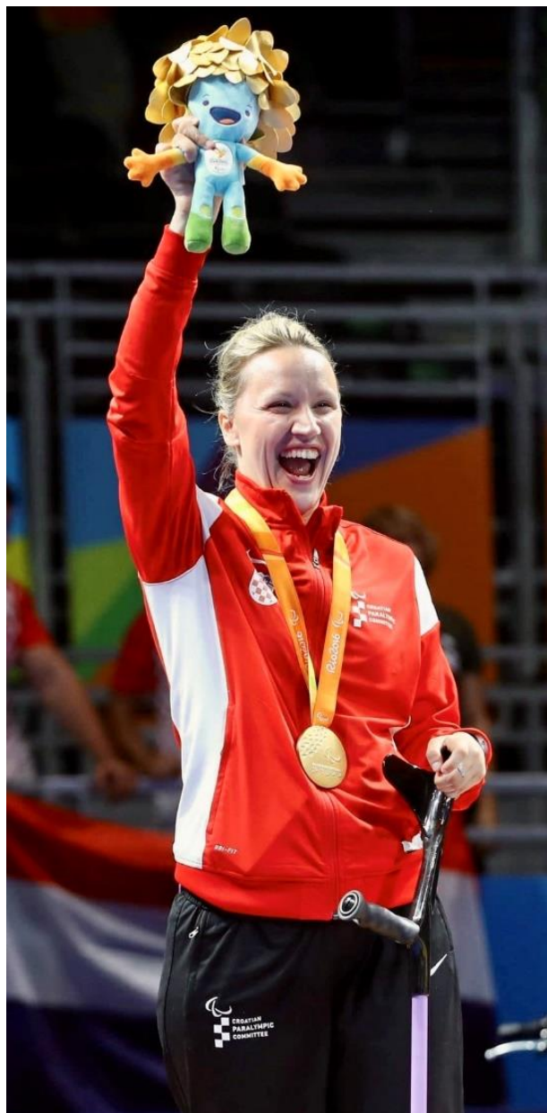
Slika 10. Sandra Paović paraolimpijska pobjednica