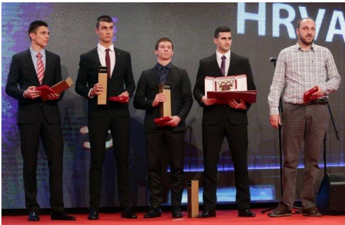
Slika 8. Hrvatska muška stolnoteniska reprezentacija preuzima nagradu za najuspješniju momčad 2014. godine

Tablica 5 prikazuje hrvatske ekipe koje su osvojile 7 medalja nastupima na ekipnim europskim prvenstvima. Ženska reprezentacija osvojila je 5 odličja, a muška 2. Nažalost nemamo naslov ekipnog europskog zlata, a stepenicu niže smo bili 2003. i 2005. sa ženskom reprezentacijom i 2007. godine s muškom reprezentacijom.