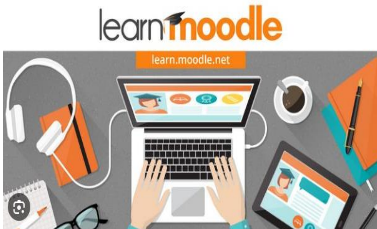
Slika 5. Moodle, platforma za e-učenje

Riječ Moodle skraćena je izraza Modularno objektno-orijentirano dinamičko obrazovno okruženje (eng. Modular Object-Oriented Dynamic Learning Environment) i veže se na obrazovnu teoriju društvenog konstruktivizma. Moodle predstavlja besplatno sredstvo otvorenog koda (eng. open source ), odnosno dozvoljen je uvid u programski kôd, njegovo mijenjanje i prilagodavanje, ali pod uvjetom da se ponudi zajednici na korištenje pod originalnom licencom. Ujedno, moodle je i glagol koji na engleskom jeziku označava proces polaganog prolaska kroz neku materiju, u ovom slučaju kroz elektronske obrazovne sadržaje, načinom i dinamikom koji odgovara sudioniku obrazovnog procesa. Moodle zajednica iznimno je velika i broji preko stotinu milijuna korisnika na više od 79000 registriranih web sjedišta. Države koje imaju najveći broj registriranih sjedišta su Sjedinjene Američke Države, Španjolska i Brazil. U Hrvatskoj je javno dostupno 100 sjedišta, a broj korisnika je u stalnom porastu (Nacionalni portal za učenje na daljinu, „Nikola Tesla“). 2