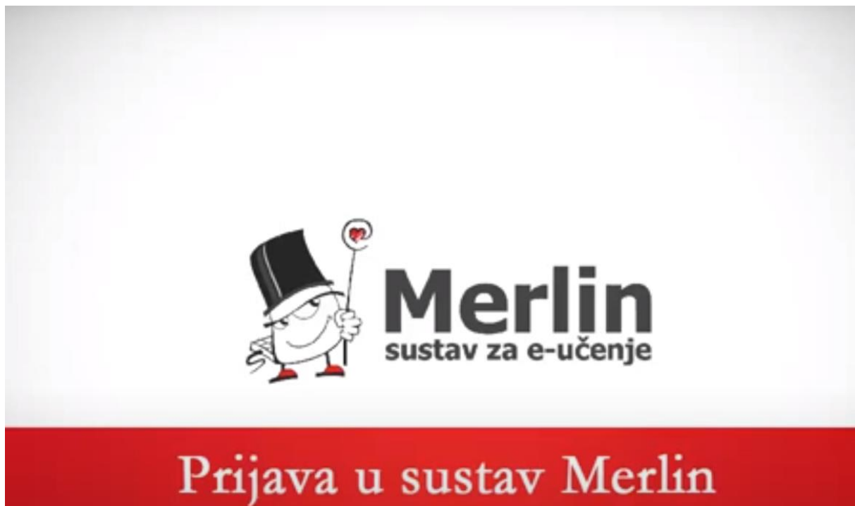
Slika 2. Merlin, platforma za e-učenje