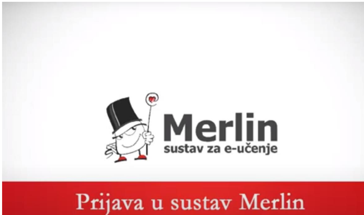
Slika 2. Merlin, platforma za e-učenje