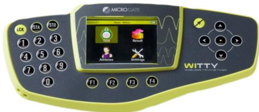
Slika 3. Witty GATE mjerač (slika preuzeta sa https://training.microgate.it/en/products/witty/wittytimer )