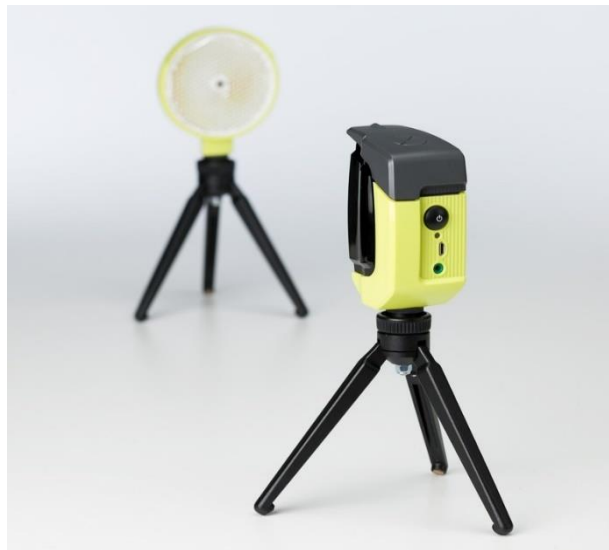
Slika 2. Witty GATE fotoćelije

Promatrana varijabla se mjerila Witty GATE uređajem koji ima doomet od 150 metara, što foto ćelije čini vrlo pouzdanima. Prikupljeni podaci sa fotoćelija se prenose na mjerač vremena s maksimalnom preciznošću ( \pm 0,4 tisućinke sekunde). Witty tajmer daljinski prepoznaje ID broj foto ćelije tako da korisnik može jednostavno postaviti vrstu signala na fotoćeliji: start, stop i međuvremena. Ova tehnologija se smatra referentnim alatom za mjerenje vremena (Buchheit i suradnici, 2014).