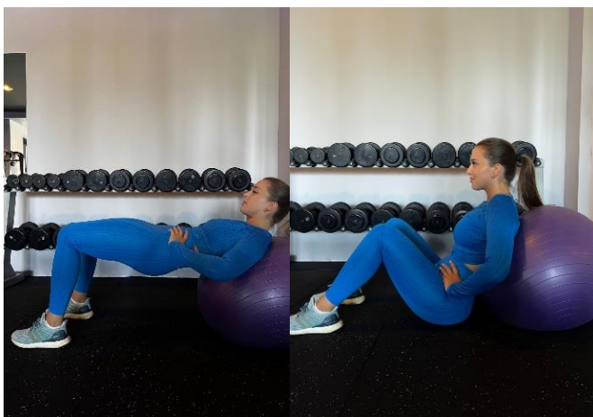
Slika 4. Podizanje kukova na velikoj fitnes lopti

Pogreške: nepravilno postavljanje stopala na loptu, pretjerano savijanje donjeg dijela leđa, prebrzo izvođenje pokreta, zanemarivanje disanja, nedovoljno spuštanje ili podizanje kukova