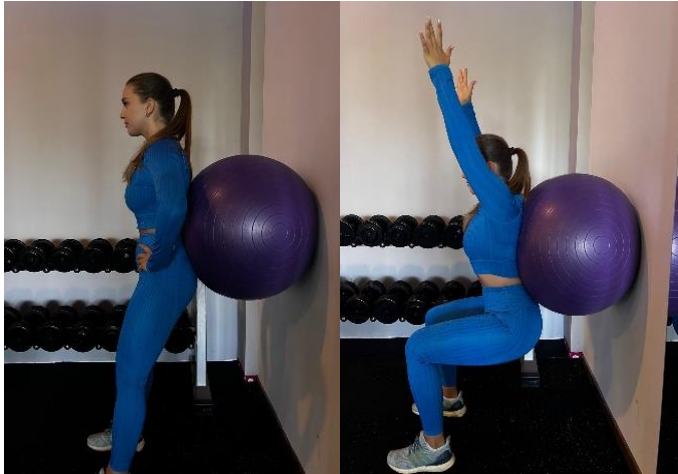
Slika 3. Čučanj uz zid na velikoj fitnes lopti