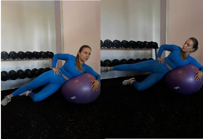
Slika 6. Bočno podizanje noge na velikoj fitnes lopti

Pogreške: previsoko podizanje gornje radne noge, neadekvatna aktivacija bočnih mišića, loše postavljanje gornjeg dijela tijela kao oslonca, nedovoljna kontrola pokreta, nepravilno disanje, loša početna pozicija