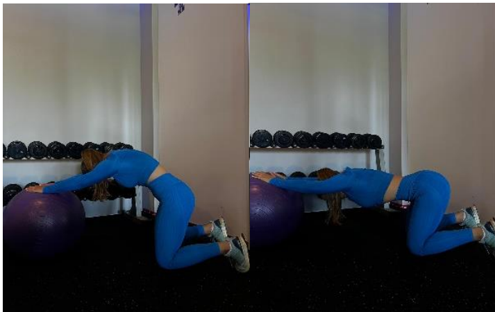
Slika 5. Obla-ravna leđa uz veliku fitness loptu

Pogreške: prekomjerno zakrivljanje ili savijanje leđa, nedovoljna aktivacija mišića trupa, neusklađenost disanja s pokretom, loš položaj ruku i koljena, nagli pokreti