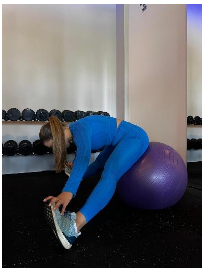
Slika 9. Istezanje donjeg dijela leđa i stražnje lože na velikoj fitnes lopti

Pogreške: grbljenje leđa prerano, nedovoljna kontrola pokreta, nepravilna pozicija stopala, pritisak na trbuh