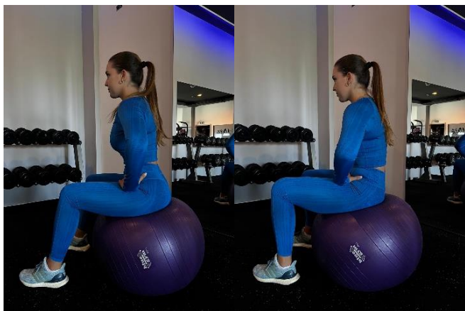
Slika 2. Gibanje zdjelice na velikoj fitnes lopti

Pogreške: preveliki nagib zdjelice, nedovoljna aktivacija mišića trupa, prebrzi pokreti, nepravilno disanje, loša početna pozicija tijela