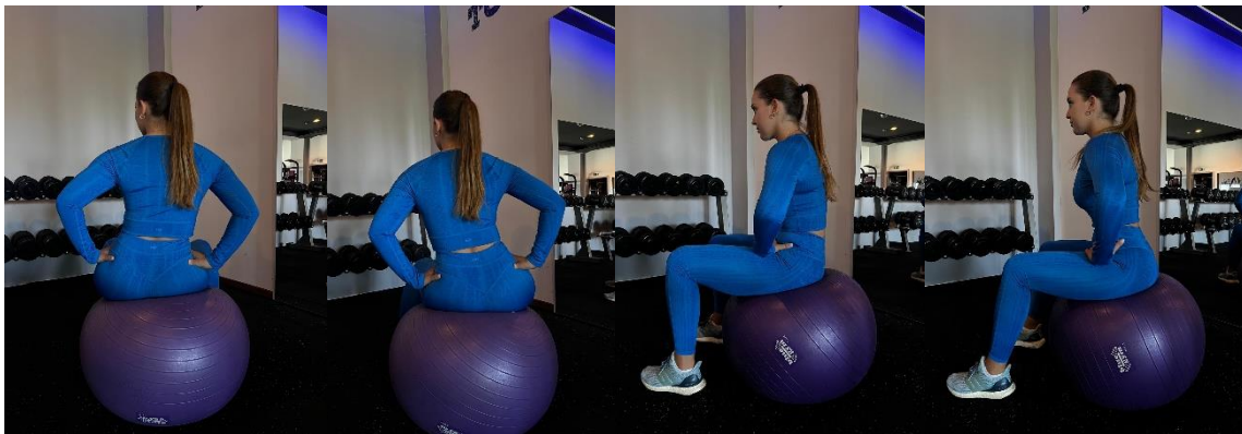
Slika 1. Cirkularni pokreti kukovima na velikoj fitnes lopti

Pogreške: loša početna pozicija, prebrzi pokreti kruženja, premali ili preveliki krugovi, nedovoljna aktivacija mišića trupa, nepravilno disanje, predugo izvođenje vježbe bez odmora