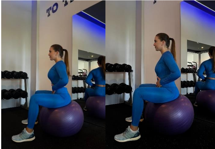
Slika 10. Duboko dijafragmalno disanje s rukama na trbuhu

Pogreške: plitko disanje, predugo zadržavanje daha, prebrzo disanje, nepravilno držanje, nedovoljna stabilnost