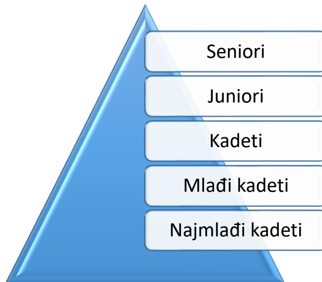
Slika: 3 - Muška vertikala kluba

Kod muškaraca je u pogonu uključeno 30 odbojkaša koji se natječu u seniorskim natjecanjima (neki već od mlađe kadetske dobi) uz 67 polaznika razvojnih grupa koji se natječu u natjecanjima mlađih dobnih kategorija što dovodi do zaključka da je selekcijska piramida veoma sužena, međutim, taj problem kod muške odbojke nije ništa novo već egzistira već duže vremena.