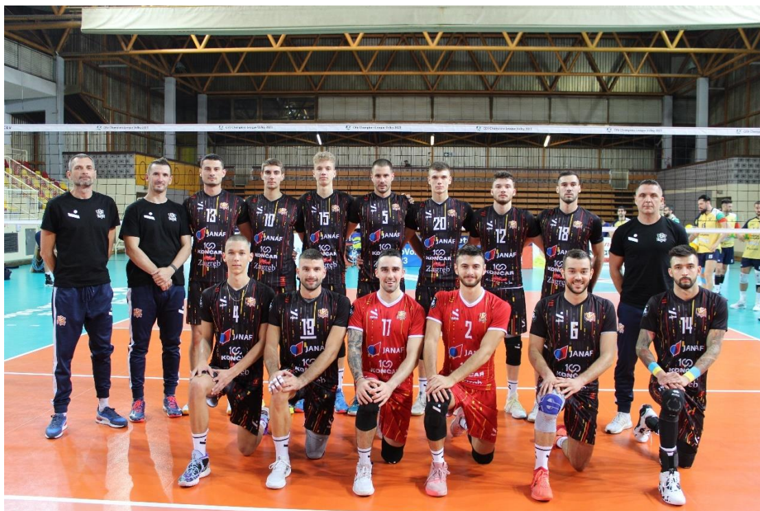
Slika: 4 - Seniorska muška ekipa HAOK Mladost u natjecateljskoj sezoni 2023./2024.

Muška seniorska ekipa sudjeluje u sljedećim natjecanjima: u Hrvatskoj Superligi , Hrvatskom kupu Vinko Dobrić i ima ambicije dominirati domaćom scenom. Također sudjeluju u MEVZA ligi (Srednjoeuropska liga) i kvalifikacijama za CEV Ligu prvaka .