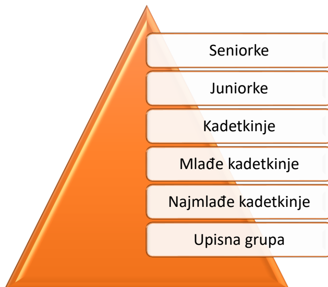
Slika: 2 - Ženska vertikalna kluba

Kod žena je u pogonu uključeno 67 odbojkašica koje se natječu u seniorskim natjecanjima i 199 polaznica razvojnih grupa koje ne natječu (upisna grupa) ili se natječu u natjecanjima mlađih dobnih kategorija pa je selekcijska piramida prirodno postavljena.