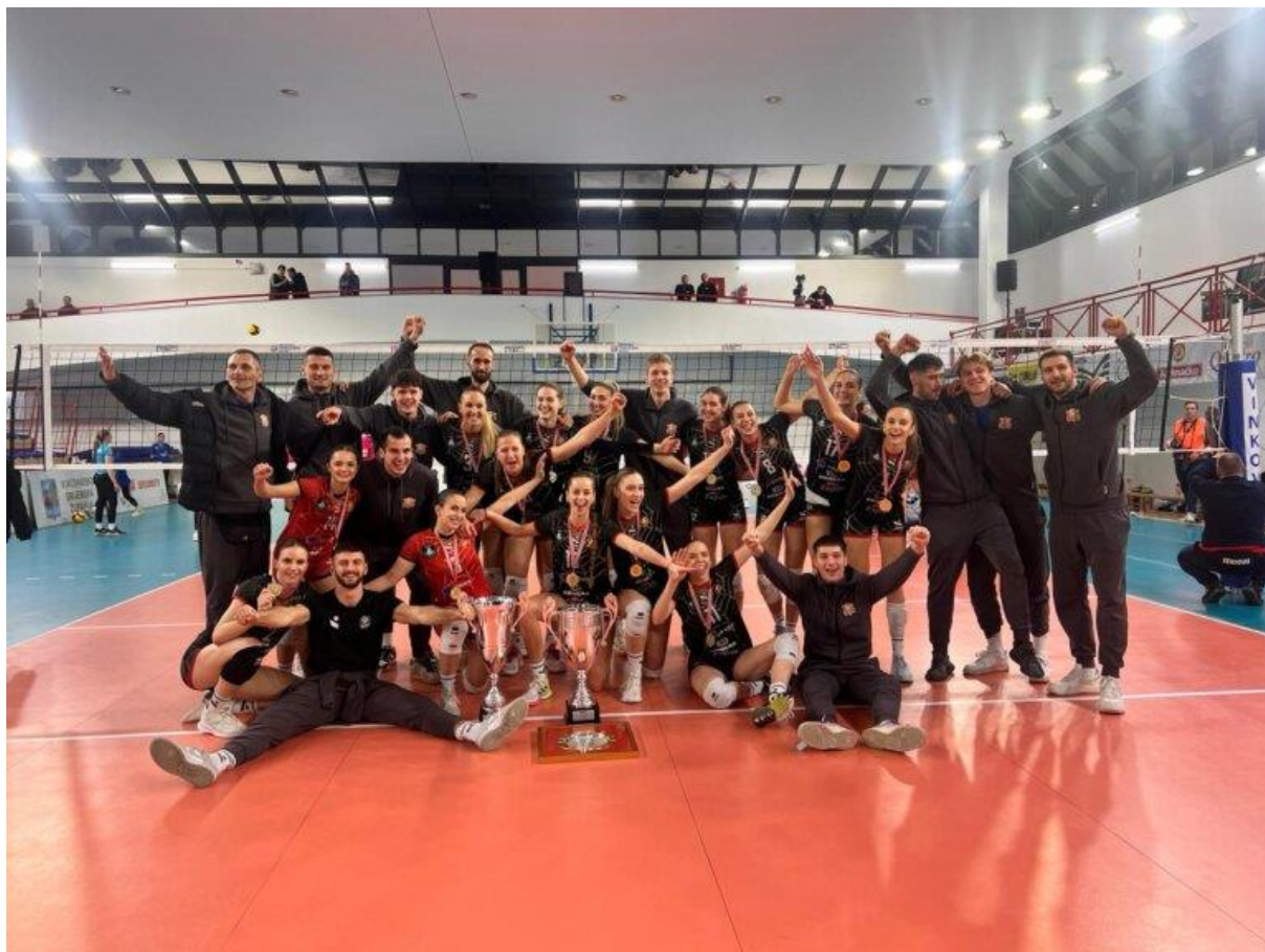
Slika: 6 – Odbojkašice i odbojkaši Mladosti osvajači kupa Hrvatske

Na kraju unatoč svim iskušenjima u sezoni 2023./2024, možemo samo biti zadovoljni sa ostvarenim rezultatima. Osvojiti četverostruku krunu s djevojkama i dečkima može samo klub HAOK Mladost!