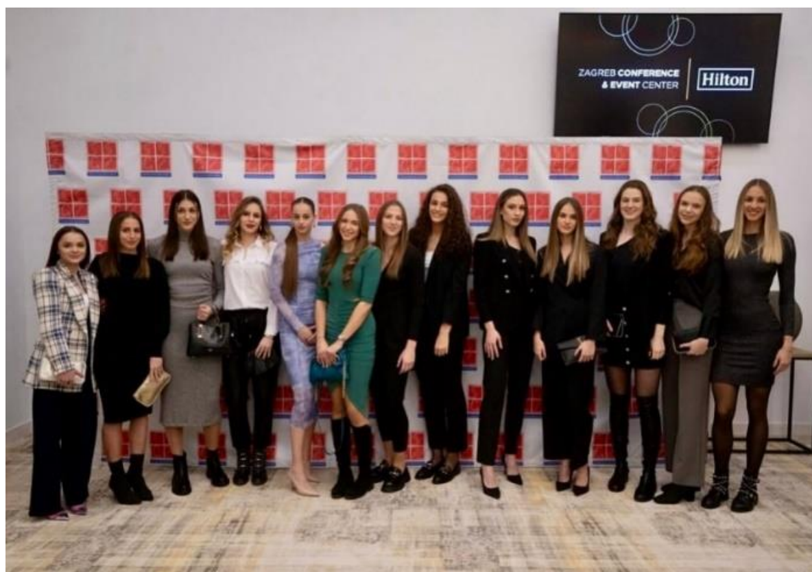
Slika: 7 - Najbolja ženska ekipa Grada Zagreba u 2023. godini