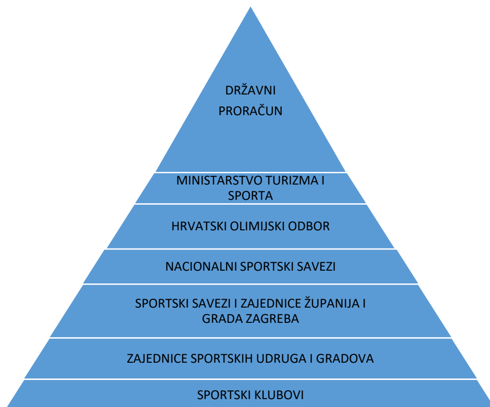
Tablica 14. Organigram financiranja sporta u Republici Hrvatskoj

HAOK Mladost je prateći svoju strategiju uspio izvući klub iz dubioza međutim za sljedeći iskorak neophodna je promjena u samom sustavu sporta. Prije svega u financiranju sporta s naglaskom na financiranje klubova koji su izravni proizvođači vrhunskih sportaša.