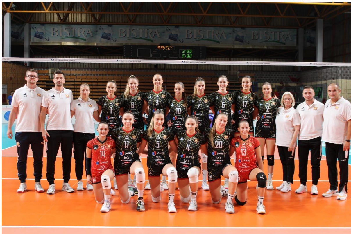
Slika: 5 - Seniorska ženska ekipa HAOK Mladost u natjecateljskoj sezoni 2023./2024.

Ženska seniorska ekipa natječe se u sljedećim natjecanjima: u Hrvatskoj Superligi i Hrvatskom kupu Snježane Ušić . Također sudjeluje u međunarodnim natjecanjima CEV Ligi prvaka i MEVZA Srednjoeuropskoj regionalnoj ligi.