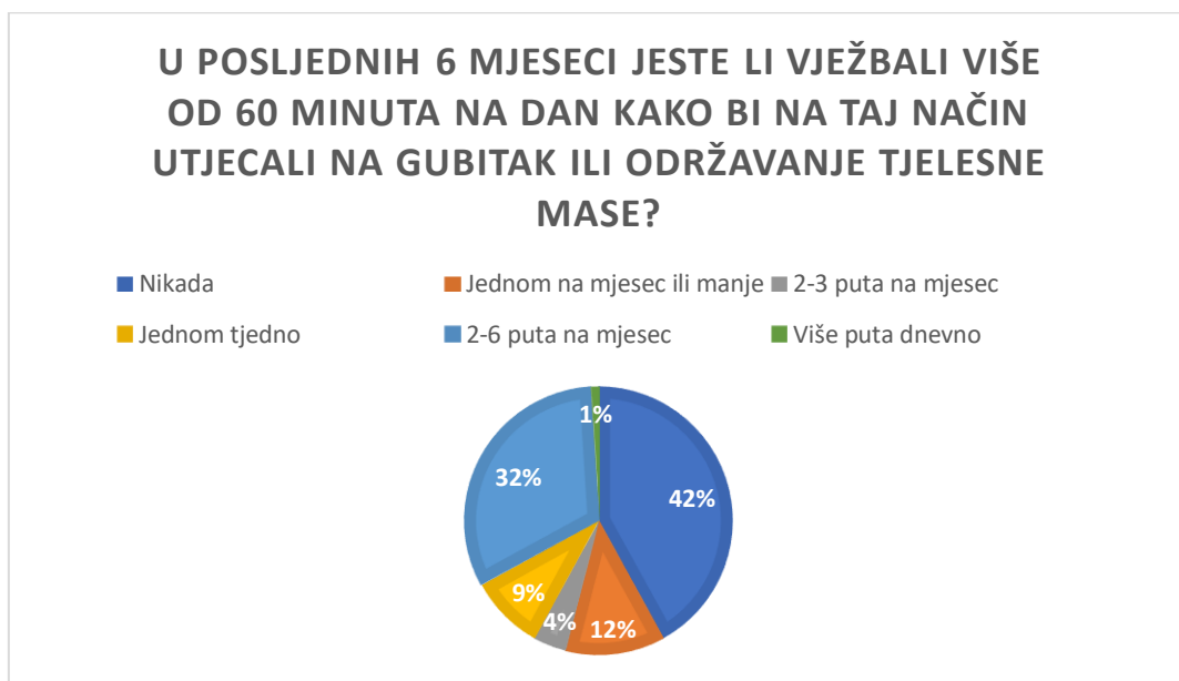
Slika 3 grafički prikaz frekvencije vježbanja s ciljem gubitka ili održavanja tjelesne mase

Međutim, s druge strane vježbanje nerijetko može predstavljati jedan od kompulzivnih mehanizama putem kojeg se održava simptomatologija poremećaja hranjenja, stoga smo u nastavku ispitali učestalost vježbanja s ciljem održavanja ili redukcije tjelesne mase (slika 3), zato što se upravo taj čimbenik često nalazi u pozadini pojedinih specifičnih poremećaja hranjenja, kao što su anoreksija ili bulimija. Iz rezultata možemo uvidjeti da je 68% ispitanika minimalno jednom mjesečno vježbalo s ciljem održavanja ili gubitka tjelesne mase, a gotovo 32% to čini 2-6 puta mjesečno, no to sukladno rezultatima nije povezano simptomatologijom ovisnosti o vježbanju kod sudionika ovog uzorka.