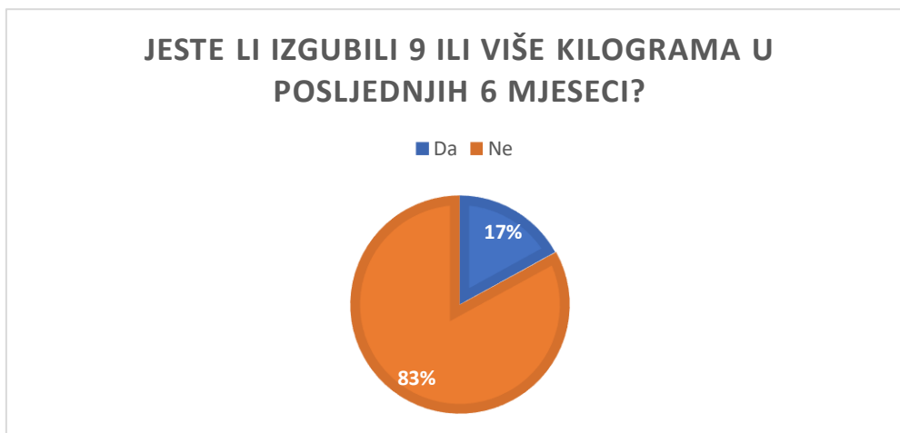
Slika 1 Grafički prikaz frekvencije gubitka kilograma u posljednjih 6 mjeseci

Osim gubitka kilograma i ukupnog rezultata na upitniku odstupajućih prehrambenih navika sukladno dosadašnjoj literaturi, u obzir valja uzeti i učestalost konzumacije dodataka prehrani (slika 2) s obzirom da je u pojedinim istraživanjima (Vižintin i Barić, 2013), primijećena direktna pozitivna korelacija između konzumacije dodataka prehrani i povećanog rizika od razvoja ovisnosti o vježbanju. Međutim, uvidom u rezultate možemo uvidjeti da u ovom slučaju nije dobivena korelacija između navedenih čestica ( r = -,17 ). Drugim riječima, konzumacija dodataka prehrani nije povezana s razvojem ovisnosti o vježbanju na ovom uzorku ispitanika.