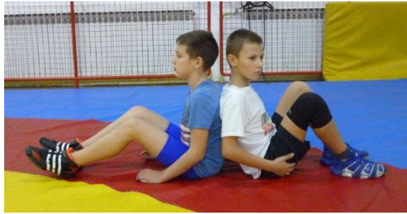
Slika 43: Igra 5