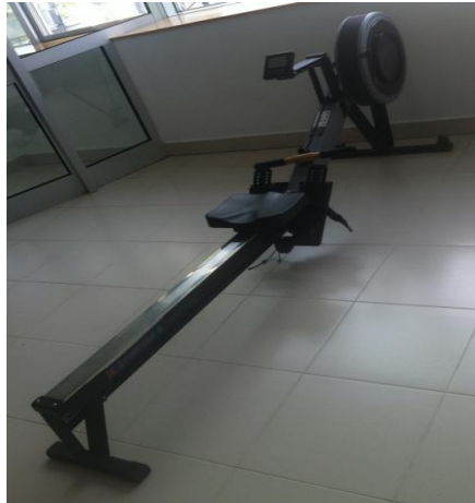
Slika 3: Veslački ergometar