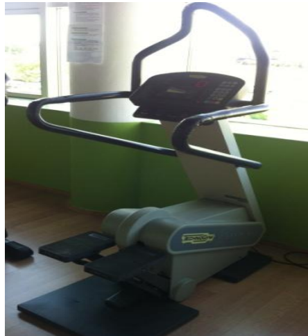
Slika 6: Steper