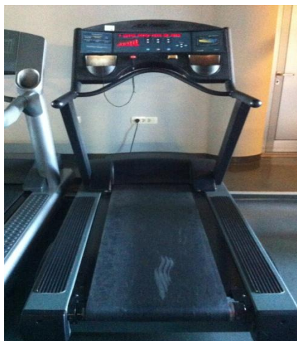
Slika 5: Traka za trčanje