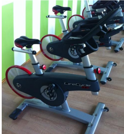
Slika 2: Bicikl ergometar