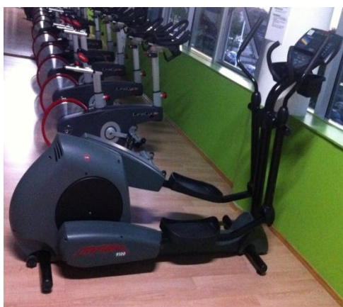
Slika 7: Orbitrek