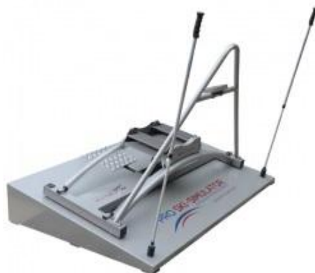
Slika 8: Pro ski simulator