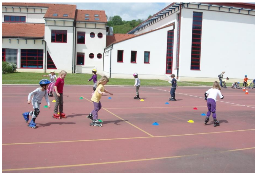
Slika 17. Savladavanje poligona