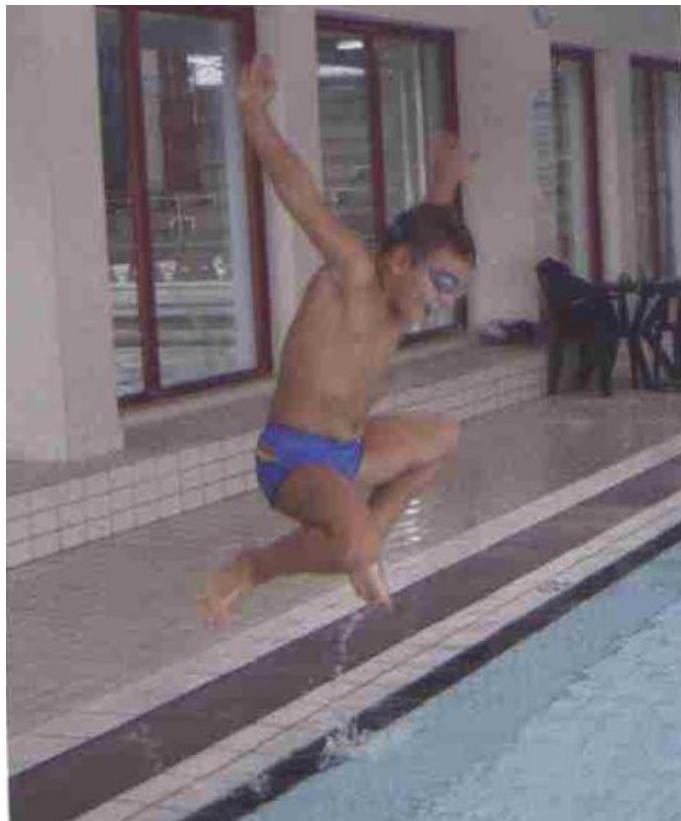
Slika 9. Skokovi u vodu

Djeca poredani jedan iza drugoga skaču sunožnim odrazom na noge kroz obruč, kao pingvin u rupu na santi leda. Za vrijeme skoka u vodu obruč pridržiava voditelj.