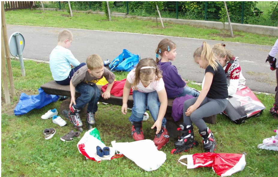
Slika 16. Obuvanje i kopčanje rola