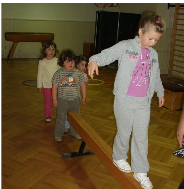
Slika 25. Hodanje po gredi

2. Djeca stoje u koloni dok jedno dijete iz kolone izvodi hodanje bočno tako da se ruke nalaze u odručenju i licem je okrenuto prema voditelju koji ga prati (sa ili bez asistencije).