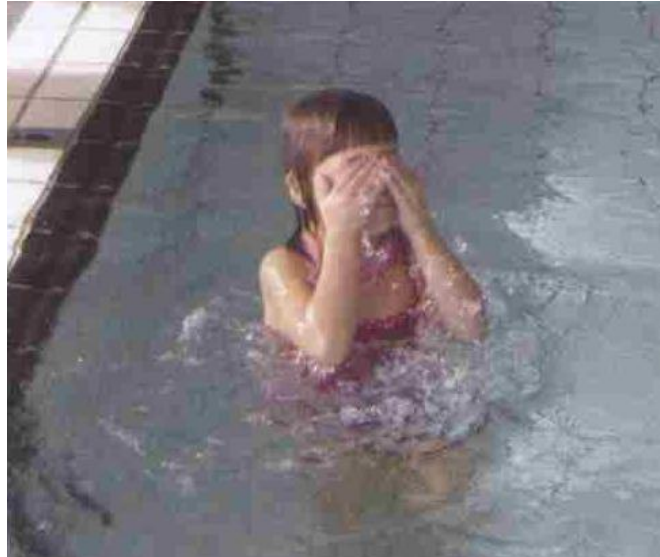
Slika 4. Umivanje

Djeca su u vodi, dlanovima zagrabe vodu i prvo umiju ruke a zatim obraze. Motiviramo ih tako da im kažemo da su im uprljani obrazi od čokolade i da ih treba oprati.