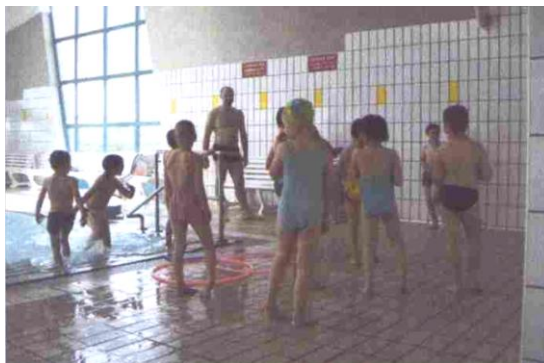
Slika 1. Upoznavanje djece sa bazenom

Kada djeca dođu na bazen potrebno je uspostaviti kontakt s njima, te im približiti vodeni medij kroz igru ili priču. Prije početka privikavanja na vodu potrebno je svaki zadatak dobro objasniti izvan vode kako bi taj isti zadatak kasnije u vodi bio brže i preciznije realiziran. Nakon objašnjenja zadatka slijedi demonstracija pa provođenje zadatka. (Slika 1)