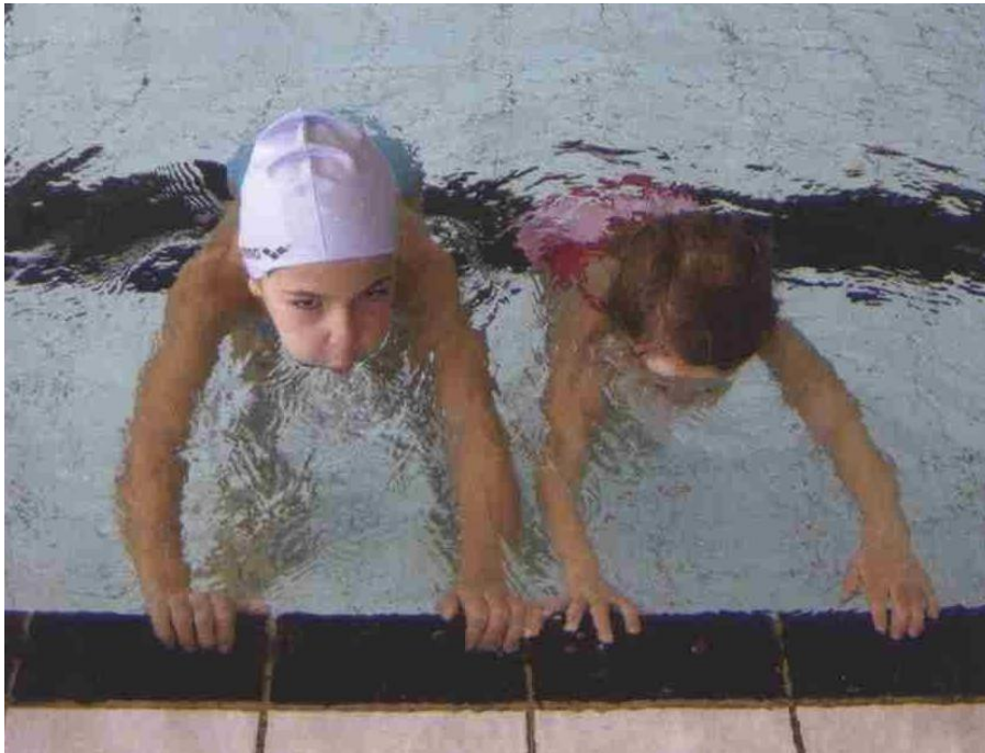
Slika 5. Izdisanje pod vodom

Dobro naučen ritam disanja izvan vode pomoći će početnicima da ovladaju brojnim vježbama disanja u vodi. Djeca trebaju naučiti snažno udahnuti kada su im usta izvan vode, a izdahnuti kada su usta ispod vode. Važno je reći da se udah izvan vode vrši kroz usta, dok se izdah ispod vode vrši kroz usta i nos. Izdisajem kroz usta i nos sprječava se ulazak vode u nosnu šupljinu. Zadatke puhanja zraka u vodu treba raditi postupno i sporo, da ne bi došlo do udaha vode u pluća. Treba početi s igrama puhanja na površini vode, a kasnije usta uranjati sve dublje u vodu. (Slika 5)