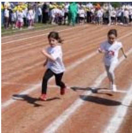
Slika 29. Pretrčavanje