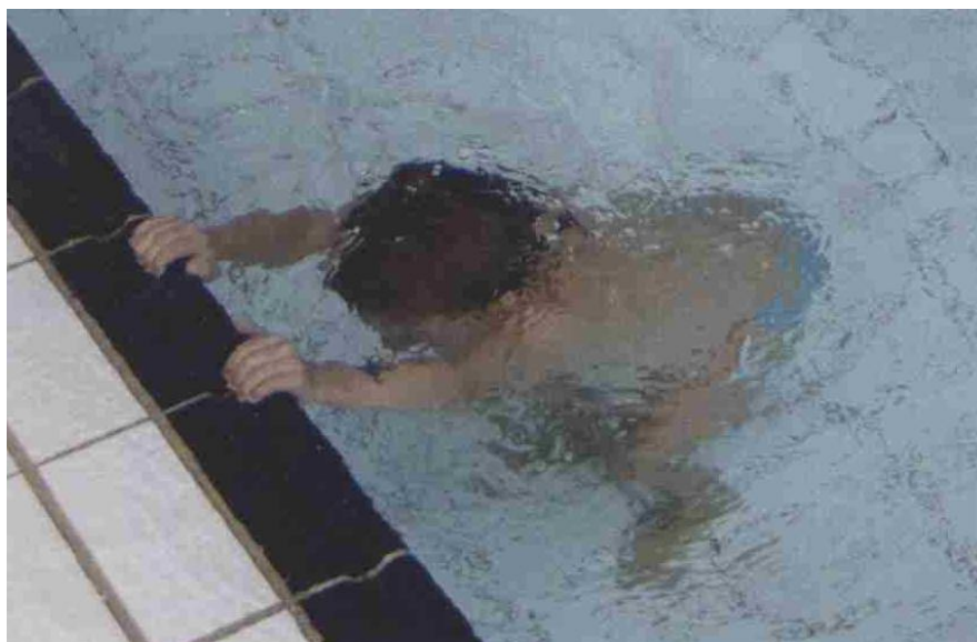
SLIKA 3. Uranjanje glave u vodu

Kod svih aktivnosti u vodi i pravilnog plivanja, u svim plivačkim tehnikama, glava se uranja u vodu. Uranjanje glave u vodu kod djeteta stvara neobičan ugođaj s obzirom da su u početku oči zatvorene. Da bi postigli potpuno uranjanje u vodu treba početi prvo s igrama „umivanja“, tuširanja, polijevanja, međusobnog prskanja lica i glave, uranjanja pojedinog dijela lica kao prislanjanje nosa, brade, očiju i čela do vode pa sve do potpunog uranjanja glave u vodu. Pri tome se djeca nalaze u pretklonu, a rukama se drže za rub bazena. Prije uranjanja treba snažno udahnuti i ne ispuštati zrak. Kod ovakvih zadataka moramo biti oprezni jer svaka prisila može dovesti do obrnutog efekta, do straha i bježanja djece iz vode. Zbog toga u periodu igara za uranjanje u vodu voditelj mora biti u vodi zajedno s djecom. (Slika 3)