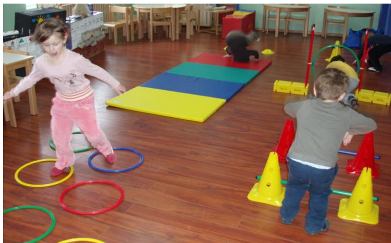
Slika 19 . Poligon 1