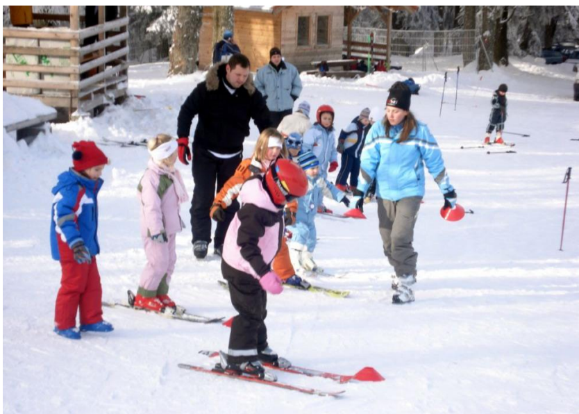
Slika 12. Stepenasto penjanje

Penjanje na ovaj način je dosta naporno pa se provodi i kod manjih strmina. Prilikom vježbanja ovog načina penjanja djeca se kreću uz blažu padinu u razmaknutoj vrsti. Kasnije se može vježbati i na nešto strmijem terenu u kombinaciji s vježbama u spustu niz brijeg.