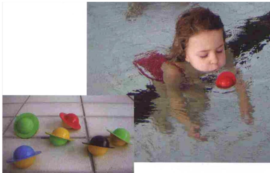
Slika 6. Loptica putuje

Djeca su u vodi a ispred njih na površini nalaze se lagane plutajuće igračke (loptice za stolni tenis, baloni, šeširići). Puhanjem, tik do površine vode, djeca potiskuju igračku prema naprijed. (slika 6)