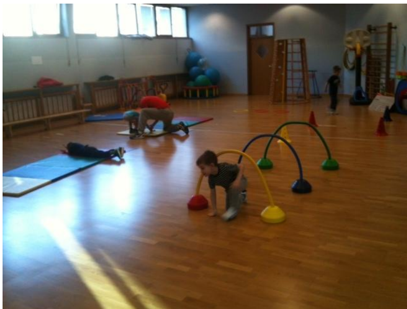
Slika 21. Poligon 3

Opis zadatka: Djeca se nalaze u jednoj koloni poredani jedan iza drugoga. Voditelj objasni i demonstrira svaki dio zadatka koji se treba obavljati na poligonu. Svako dijete krene na voditeljev znak. Nakon znaka dijete dolazi do strunjače gdje izvodi kotrljanje opruženim tijelom „palačinka“, zatim izvodi kolut naprijed (sa ili bez asistencije), sunožne poskoke iz obruča u obruč, dodirivanje čunjeva naizmjeničnim trčanjem (cik-cak), te provlačenje kroz polukružne prepreke. (slika 21 )