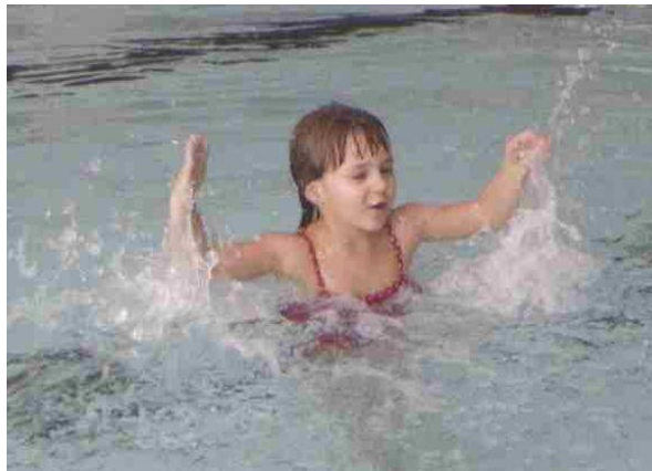
Slika 2. Pljeskanje dlanovima po vodi

Voditelj je u vodi a djeca izvan nje. Na njegov znak polagano ulaze u vodu i prskaju ga, vičući „pada kiša“, a on se brani povremenim potapanjem pod vodom.