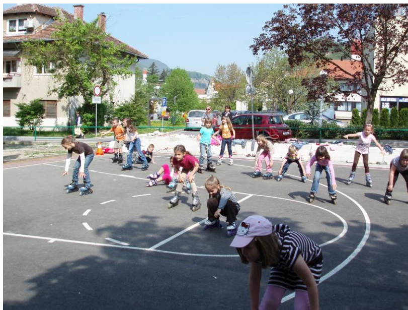
Slika 18. Oponašamo lik