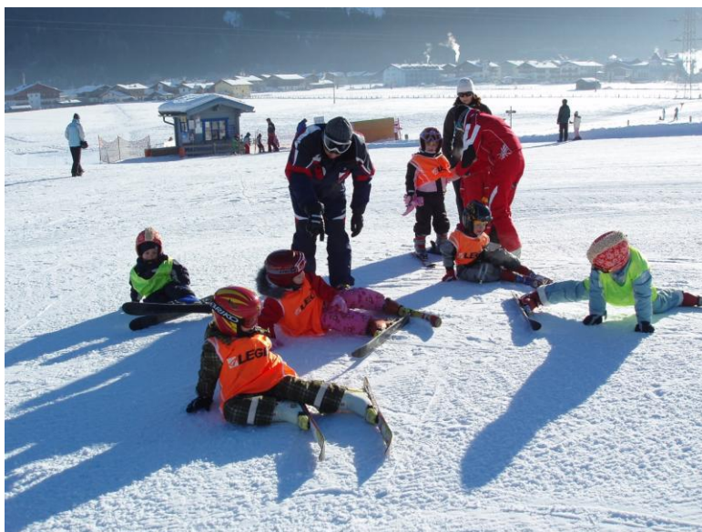
Slika 11. Padanje i ustajanje

Pri padanju, posebno pri većim brzinama treba opružiti trup, noge i ruke tako da se spriječi prevrtanje. Kod ustajanja na padini treba privući skije što više ispod tijela i postaviti ih poprečno na strminu. Ustajanje se izvodi podupirući se o štapove. Djeca uvježbavaju padove na svježe izgaženom snijegu, bilo u vrsti, krugu ili slobodnoj formaciji, ali sa dovoljno razmaka. Padati treba u jednu pa u drugu stranu i podizati se na način koji smo naveli. Nakon pada i ustajanja na ravnici prelazi se na padanje i ustajanje na blažoj pa strmijoj padini. (slika 11 )