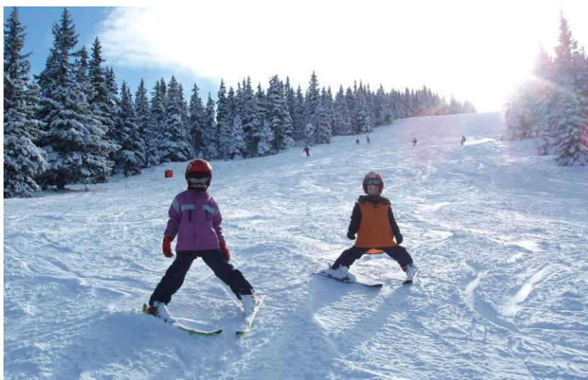
Slika 14. Zaustavljanje u položaju pluga

c) Djeca iz spusta ravno prelaze u plužni položaj. U stalnom pluženju istovremeno se potiskuju pete i sniženjem stava potiskuju se repovi u šire pluženje. Nakon toga vraća se uspravljanjem u uži plužni položaj. Ova vježba prvo se provodi na mjestu, a tek potom u kretanju.