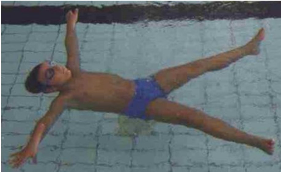
Slika 7. Plutanje

Kad dijete dobro nauči plutati treba ga naučiti kako da se odrazi od ruba bazena da klizi po vodi. Kod klizanja je također važno da se zadržava zrak u plućima. Plutanje (slika 7) i klizanje (slika 8) može se izvoditi u 3 osnovna položaja: na prsima, na leđima i sklopčano. Voditelj uvijek mora biti pored djece.