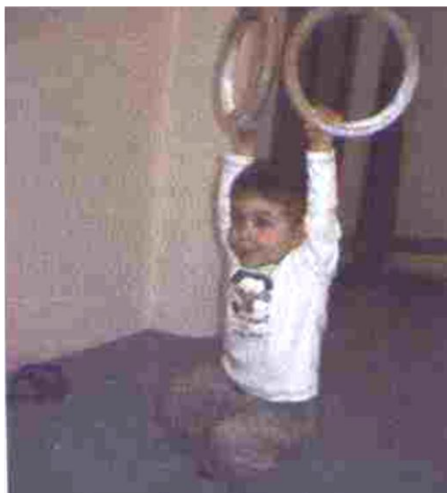
Slika 26. Vis

Dijete se nalazi ispod spuštenih karika tako da opruženih ruku može primiti karike i podići noge od tla. Može se izvoditi sa i bez asistencije voditelja. (slika 26)