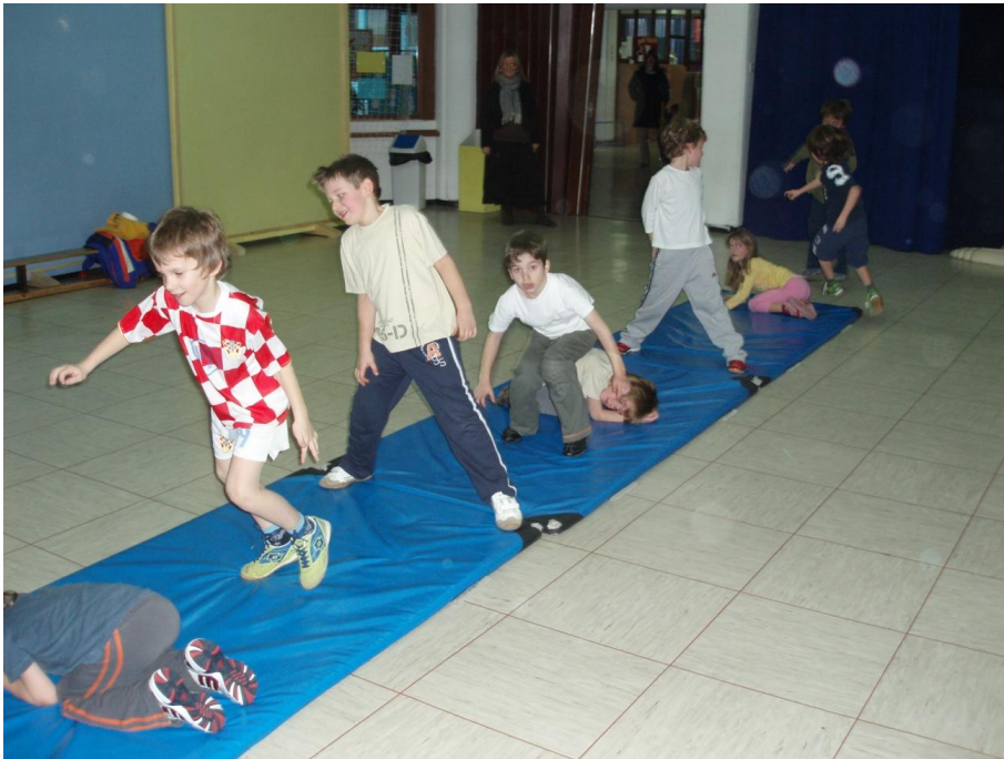
Slika 23. Provlaka - preskok

Djeca stoje u vrsti te ih prebrojimo na prvi i drugi. Svi koji su bili prvi, postavse u raznožni stav, a svi koji su bili drugi legnu na prsa tako da ruke i noge podvuku pod sebe (upor sklonjeni). Dijete koje izvodi zadatak naizmjenice se provlači kroz noge pa preskače. (slika 23)