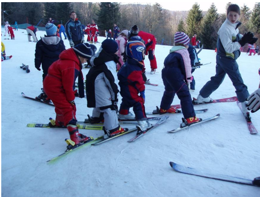
Slika 15. Priprema iz pluga za plužni zavoj