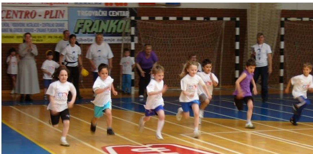
Slika 28. Trčanje

Motorička znanja i motoričke sposobnosti razvijaju se usporedno i sustavno jer su atletska znanja i sposobnosti, na čiji razvoj djeluju atletske operatore, temeljna za nadogradnju velikog broja znanja i sposobnosti bitnih za uspjeh u drugim aktivnostima. Višestrani razvoj je ono što djeca moraju dobiti kroz atletiku i to kroz kineziološke operatore koji su interesantni, raznovrsni, zabavni i djelotvorni. (slika 28)