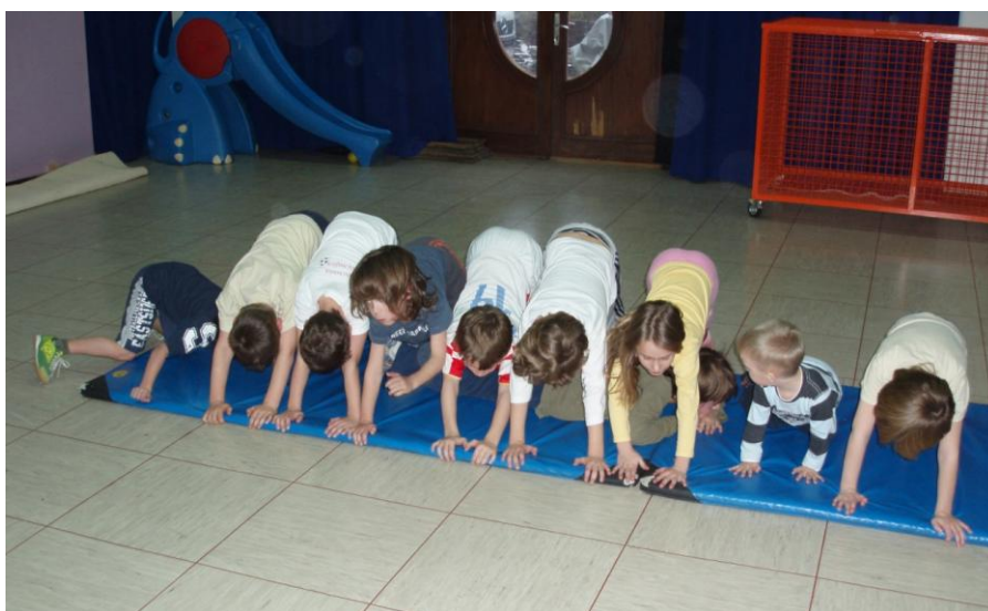
Slika 22. Provlaka ispod tunela

Djeca su poredani jedan do drugoga na strunjači u upor na rukama i nogama (most prednji). Vježba se izvodi tako da onaj koji je zadnji, počne puzati ispod tunela koji tvore djeca. Kada jedno dijete prođe, cijeli tunel digne se, te postavi most prednji i tako nastavlja raditi niz kako bi drugi mogli proći. Ponavljamo vježbu dok se svi ne izmijene. (slika 22 )