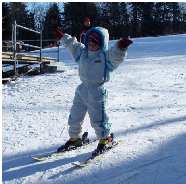
Slika 13. Spust ravno s odručenjem