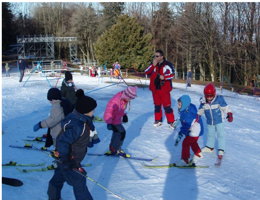
Slika 10. Okretanje u mjestu

d) Provode se različite igre jednom ili objema skijama na nogama (hvatalice i štafetne igre) na ravnom prostoru. (slika 10 )