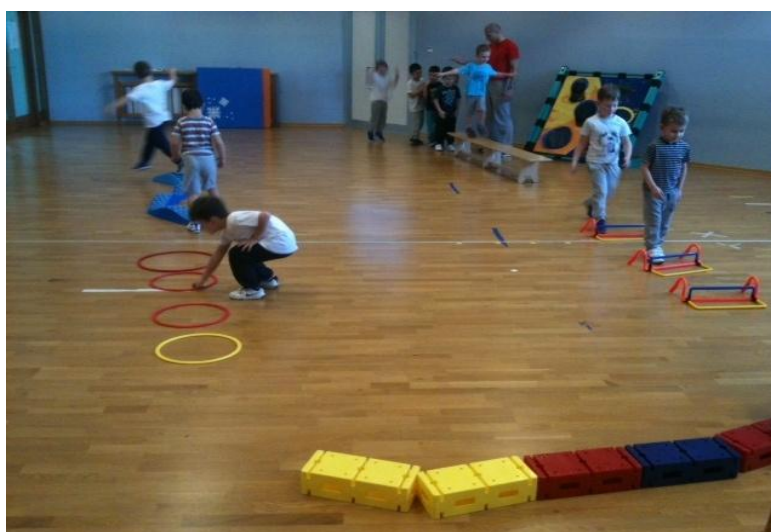
Slika 20. Poligon 2

Opis zadatka: Djeca se nalaze u jednoj koloni poredani jedan iza drugoga. Voditelj objasni i demonstrira svaki dio zadatka koji se treba obavljati na poligonu. Svako dijete krene na voditeljev znak. Nakon znaka dijete prolazi hodanje po klupi, zatim sunožno preskače preko prepona, hoda po plastičnim kockama održavajući ravnotežu, zatim izvodi sunožne poskoke iz obruča u obruč te hoda po „valovima“ (zmija). (slika 20)