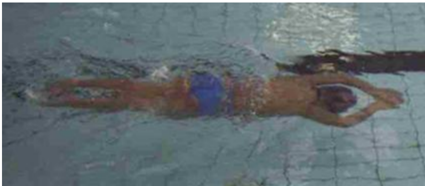
Slika 8. Klizanje