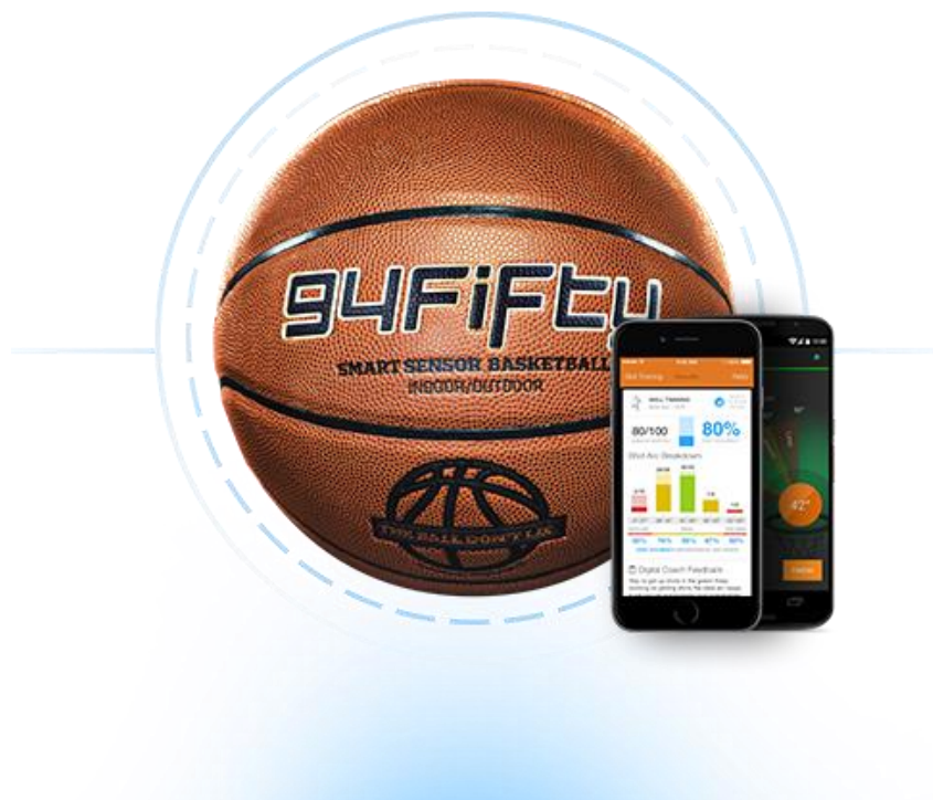
Sl. br. 1: 94 fifty smart sensor basketball

Brzina izvođenja šuta predstavlja važan parametar koji je određen vremenskim intervalom od trenutka primanja lopte, do trenutka u kojem se kontakt između prstiju šuterske ruke i lopte u zadnjoj fazi završava.