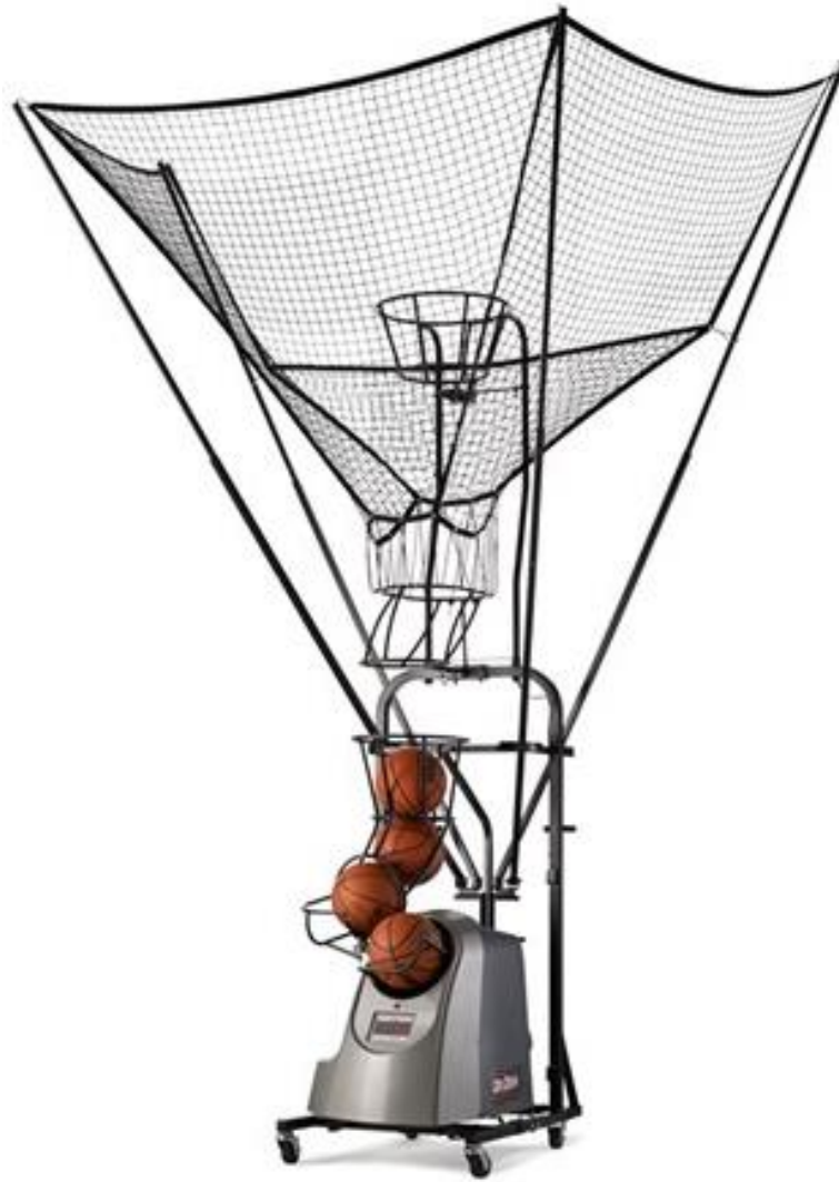
Sl.br.4: Dr. Dish – shooting machine

Prednost ovog tipa tehnologije je standardizacija dodavanja za svakog igrača, te kreiranje vremensko-prostornog odnosa između dodavanja i primanja lopte.