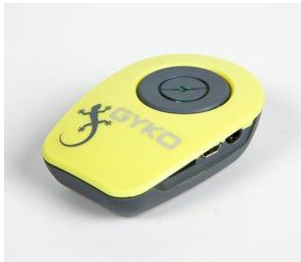
Sl.br.3: Gyko® senzor

Opto jump u kombinaciji sa Gyko uređajem (sl.br.3), omogućuje procjenu trajanja koncentrične i ekscentrične faze tijekom osnovnih ili specifičnih motoričkih pokreta.