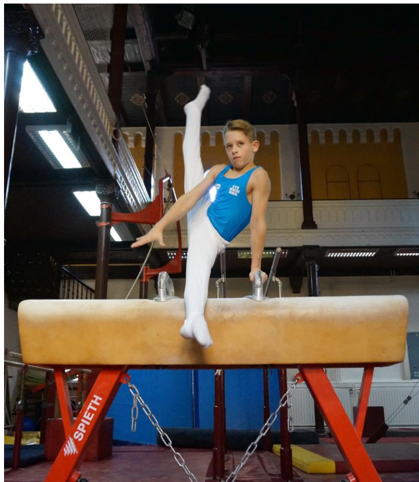
Slika 6. Njih u upor u jašu na konju sa hvataljkama