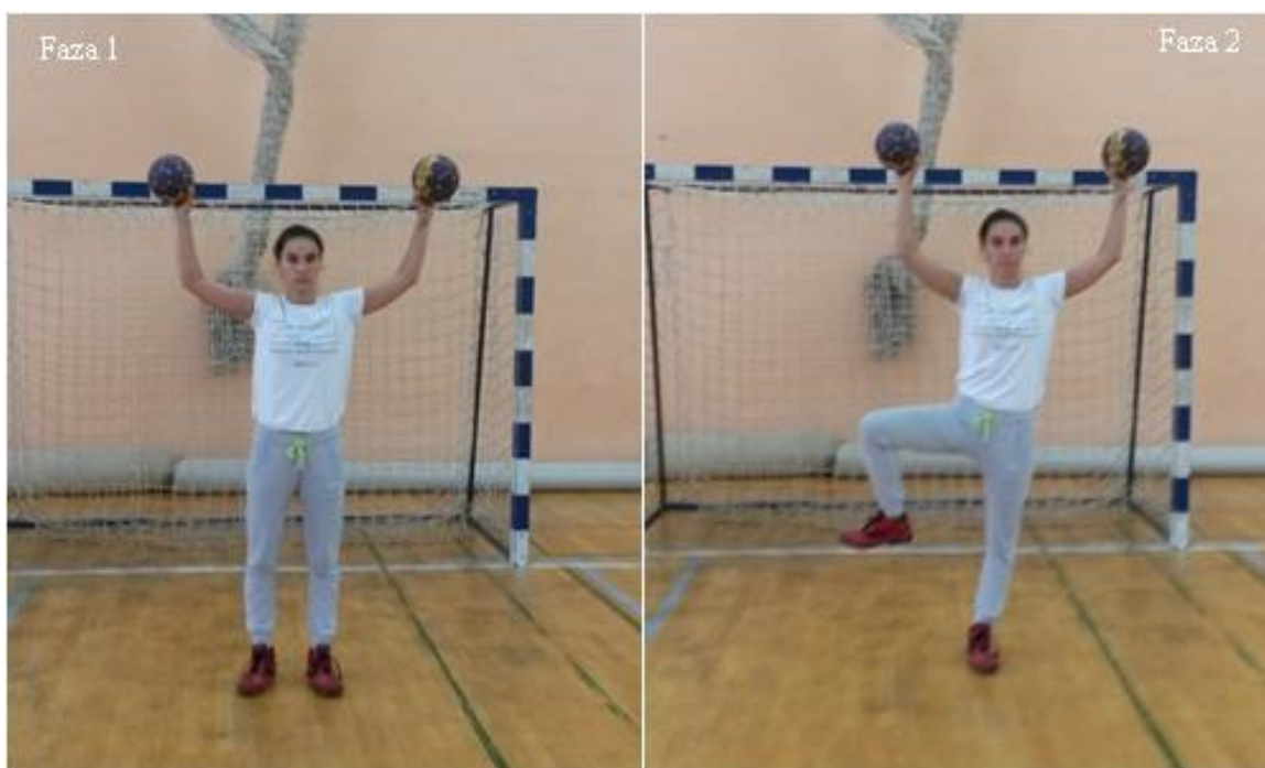
Slika 9. Odnoženje pogrčeno

OPIS: Početna pozicija, osnovni vratarski stav s loptama (faza 1), osnovni vratarski stav s loptama sa odnoženjem pogrčeno desne (faza 2).