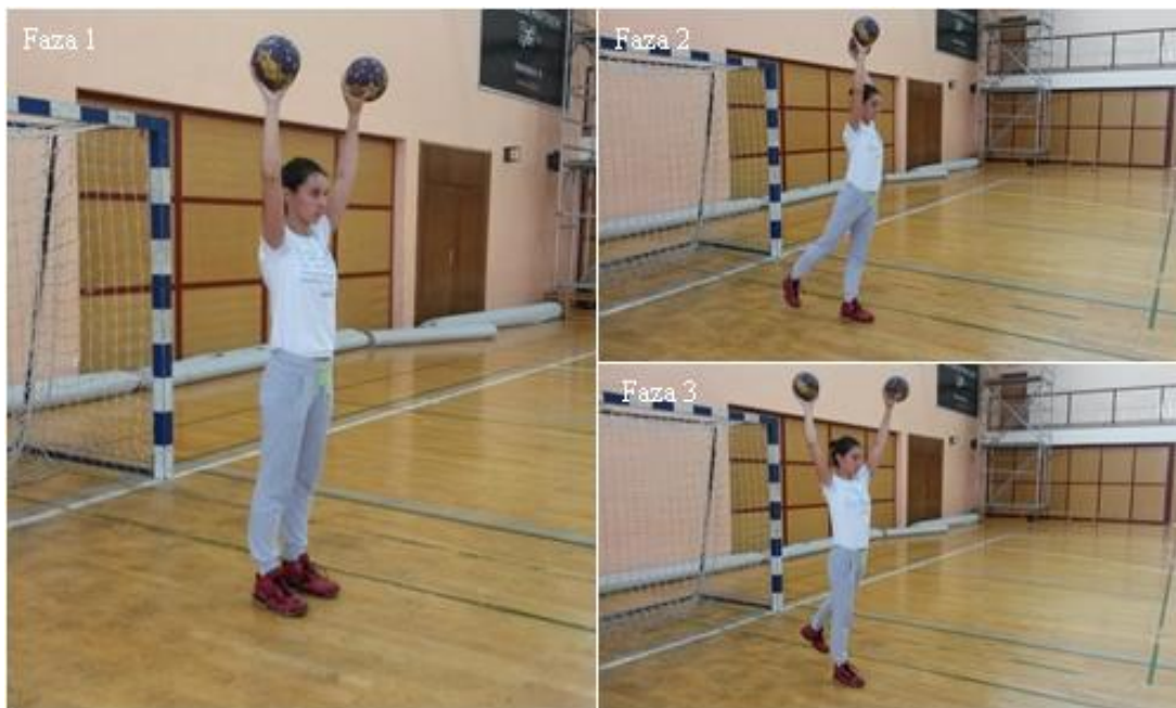
Slika 7. Stojeći superman

OPIS: Početna pozicija, raskoračni stav, uzručiti s loptom (faza 1), zanožiti desnom, zaručiti lijevom (faza 2), zanožiti lijevom, zaručiti desnom (faza 3).