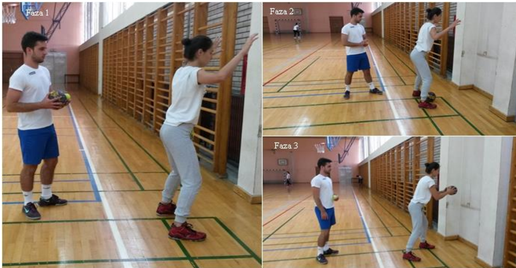
Slika 21. Hvatanje rukometne lopte prolaskom kroz noge