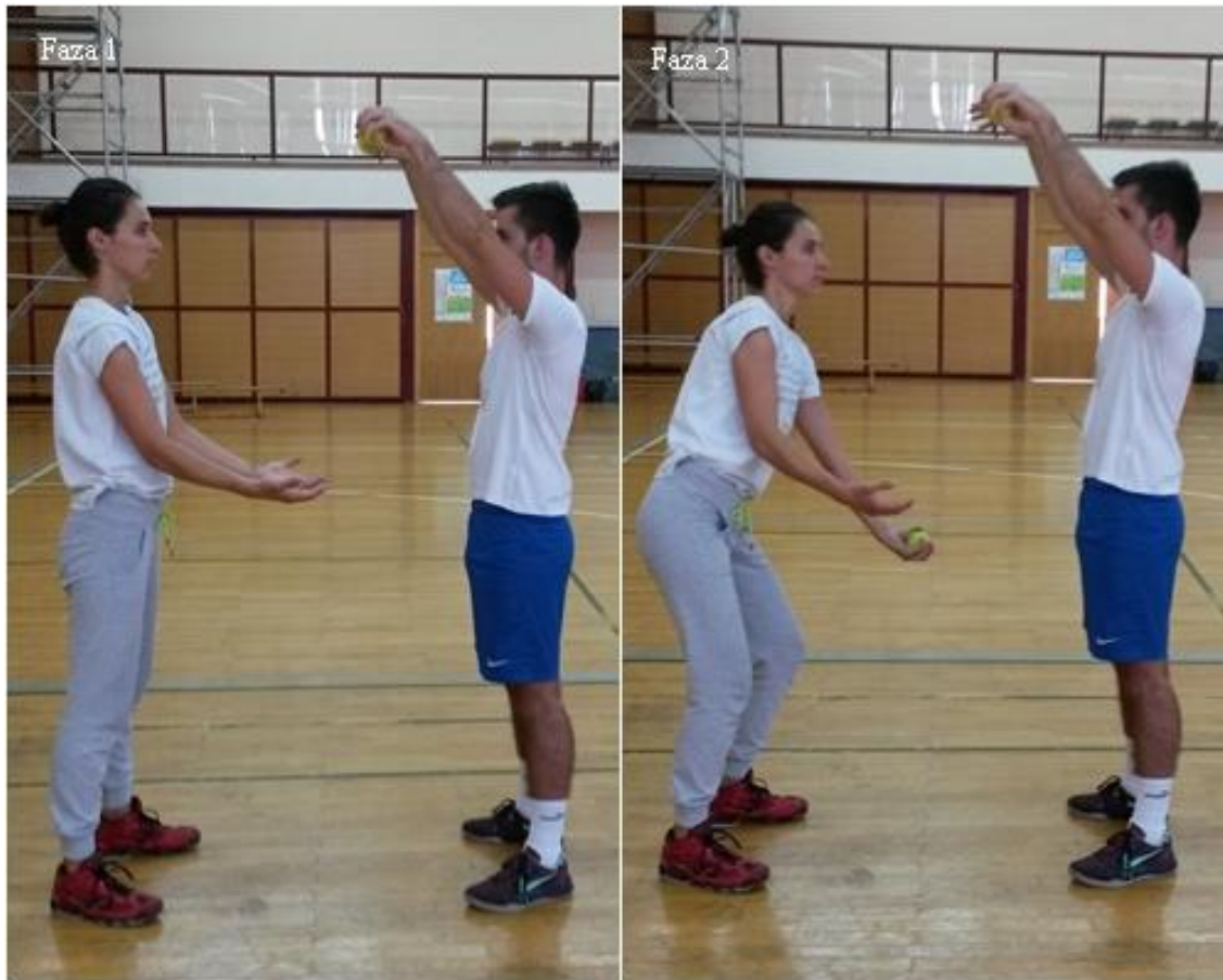
Slika 20. Hvatanje teniske loptice

OPIS: Vježba se izvodi u paru. Prvi vježbač predruči dolje, drugi vježbač predruči gore s teniskim lopticama (faza 1), drugi vježbač ispušta lopticu, prvi vježbač ju mora uhvatiti (faza 2).