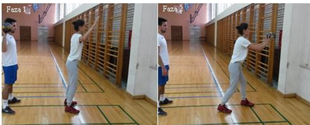
Slika 23. Hvatanje rukometne lopte odbijene od zida