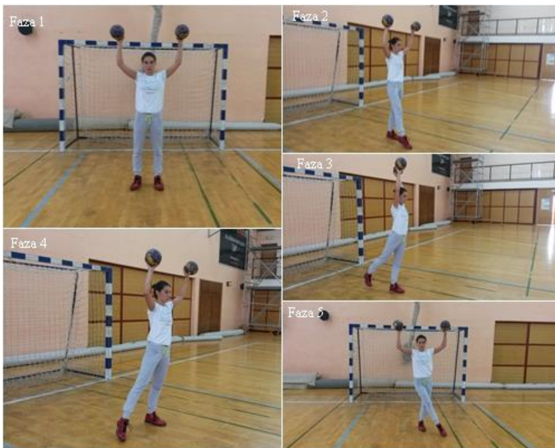
Slika 11. „Križ“

OPIS: Početna pozicija, osnovni vratarski stav s loptama (faza 1), osnovni vratarski stav sa prednoženjem desne (faza 2), osnovni vratarski stav sa zanoženjem desne (faza 3), osnovni vratarski stav sa odnoženjem desne (faza 4), osnovni vratarski stav sa prednoženjem desne u lijevo (faza 5).