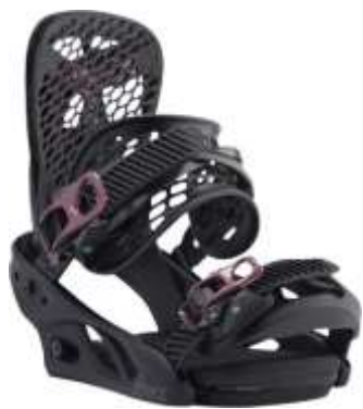
Slika 5.3.2.1.: Polutvrdi vezovi

Polutvrdi vezovi nazivaju se i step-in vezovima. Na njih se cipela pričvršćuje sa strane ili na potplati cipele. (ZTUSH, 2009:11) (Slika 5.3.2.1., 5.3.2.2.)