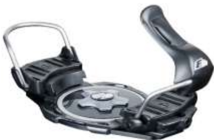
Slika 5.3.1.1.: Tvrđi vezovi

Tvrđi vezovi su izrađeni također od metala ili plastike te su čvrsto vezani na dasku centralno na tri ili četiri točke. (ZTUSH, 2009:11) (Slika 5.3.1.1.)