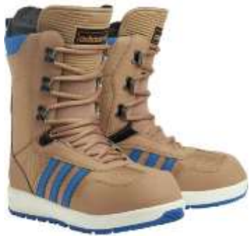
Slika 5.2.3.1.: Meke buce