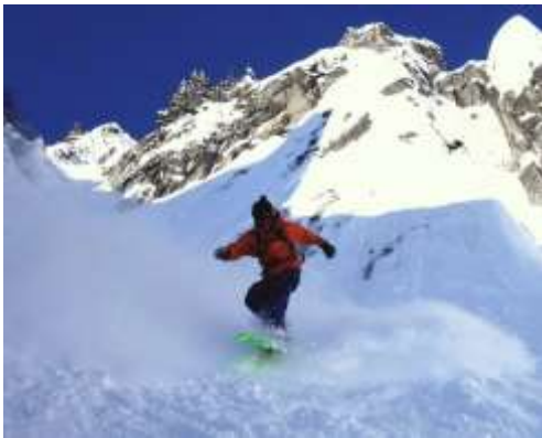
Slika 7.3.1.: Vožnja ravno

Zaustavljanje kretanja izvodimo tako da spustimo težište tijela ulaskom u polučučanj te prebacimo težište na stražnju nogu. Na taj se način zaustavimo u snijegu.