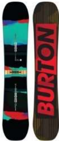
Slika 5.1.1.1.: Freeride daske

Freeride daske raspoznatljive su po njihovoj dužini koja može sezati i do 180 cm. Spadaju u srednje tvrde daske. Imaju mekše vrhove. Bočni luk je srednje velik. Rep i krivina su uzdignuti. (ZTUSH, 2009:6) (Slika 5.1.1.1.)