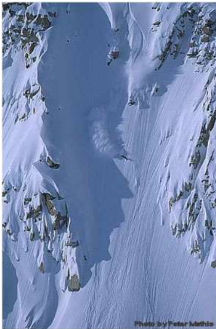
Slika 4.3.: Big Mountain

Ova vrsta freeridea je jedina u kojoj postoje organizirana natjecanja iako ta natjecanja još uvijek nisu u organizaciji FIS-a (fran. - Fédération Internationale de Ski ).