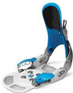
Slika 5.3.2.2.: Step-in vezovi