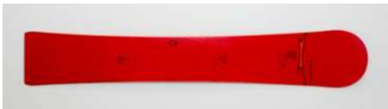
Slika 5.1.3.1.: Carving daska