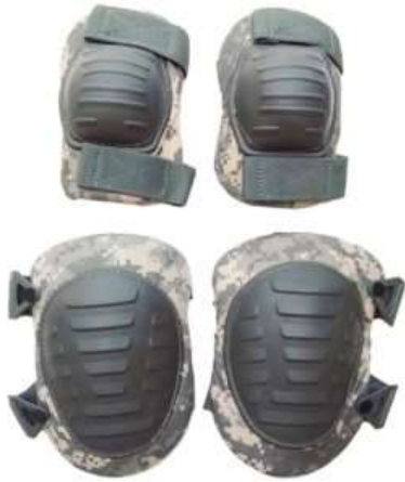
Slika 5.4.4.: Štitnici za laktove i koljena