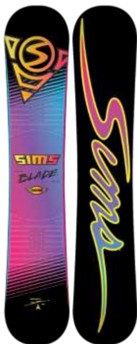
Slika 2.3.:Sims daske danas