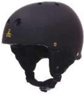
Slika 5.4.1.: Zaštitna kaciga