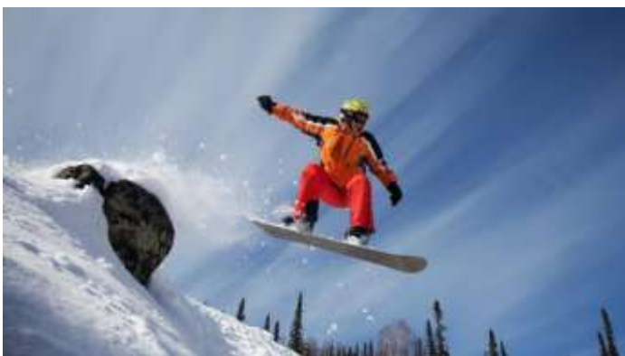
Slika 7.7.1.: Osnovni skok

Osnovni skok u freerideu izvodi se s prirodnih prepreka kao što su snijegom prekrivene stijene, veliko kamenje, grmlje i ostalo. U fazi dolaska na prepreku nalazimo se u polučučnju s težištem na stražnjoj nozi. Kada izliječemo s prepreke, koljena povlačimo prema prsima, ruke su nam paralelne s daskom, a pogled je usmjeravamo u pravcu leta. Doskačemo na stražnji dio daske s amortizacijom u koljenima. (Slika 7.7.1.)