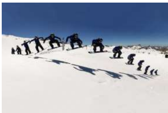
Slika 7.6.1.: Ollie

Ollie u slobodnom stilu vožnje izvodimo na način da ulazimo u čučanj istovremenim prebacivanjem težine na stražnju nogu. Odguravanjem od repa daske i naglim rasterećenjem težine tijela skačemo u zrak povlačenjem koljena prema sebi. Tada se daska nalazi u zraku paralelno s podlogom. Zatim doskačemo na punu dasku s težištem na obje noge i amortizacijom u koljenom zglobu. Ollie se u freerideu izvodi na sličan način uz neke razlike. Kod freeride olliea vršimo potisak na stražnju nogu ulaskom u čučanj. Time snijeg tlačimo kod repa daske, kako bi se stvrdnuo i kako bismo se mogli repom daske odgurnuti od njega. Odguravanjem i povlačenjem koljena prema prsima skačemo u zrak, a doskok izvodimo na stražnju nogu uz istovremenu amortizaciju koljenima. (Slika 7.6.1.).