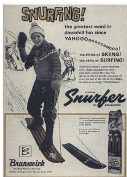
Slika 2.6.: Reklama za snurfer iz 1969.