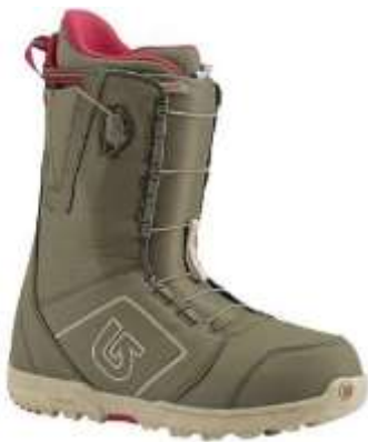
Slika 5.2.2.1: Polutvrde cipele

Polutvrde cipele uglavnom su slične mekim cipelama, ali su pojačane stražnjim osloncem, koji može biti na vezivanje. (Slika 5.2.2.1.)