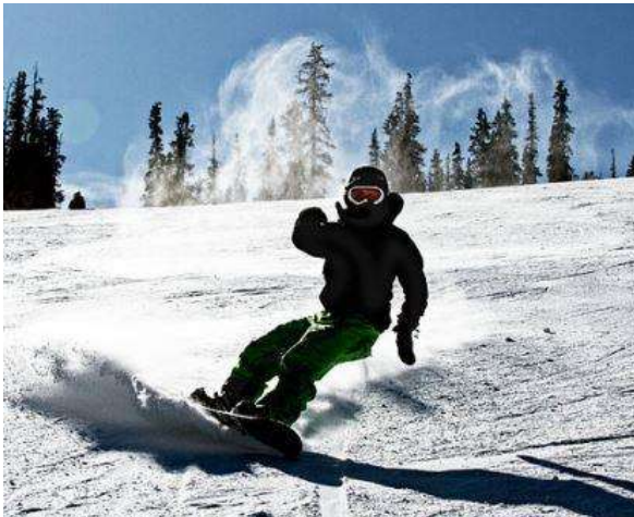
Slika 7.4.1: Početni zavoj

Početni zavoji u freerideu značajno se razlikuju od osnovnih zavoja na uređenim stazama. Zauzimamo osnovni freeride položaj te iz vožnje ravno usmjeravanjem pogleda i prednje ruke u željenom smjeru te prijenosom težine na prste ili pete stražnje noge radimo zavoj. (Slika 7.4.1.). Početni freeride zavoj značajno je lakši od osnovnog zavoja jer ne vozimo po rubnicima. Snijeg je dosta dubok te ne dolazi do opasnosti od zapinjanja rubova. Način izvođenja takvih zavoja dosta je sličan surfanju na valovima.