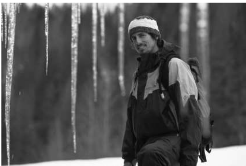
Slika 3.1.: Craig Kelly

Kada je Craig Kelly (Slika 3.1.), odbio milijunske ugovore i napustio tada veoma popularno „mainstream“ daskanje na snijegu kako bi se posvetio freerideu , industrija daskanja na snijegu je ostala šokirana. Jedan od najboljih snowboardera svijeta, čovjek koji je zadužio daskanje na snijegu, odjednom je sve to napustio kako bi se posvetio vožnji po neistraženom terenu opasnih planina.