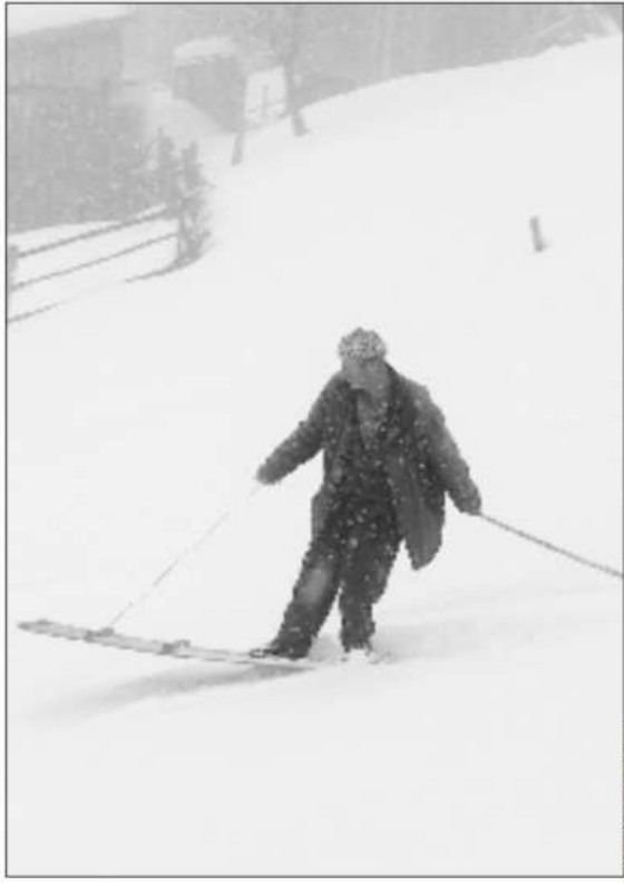
Slika 2.1.: Mještalin iz turskog sela na lazboardu

Iako postoji mnogo ovakvih zanimljivih priča o mogućim začetcima daskanja na snijegu, za potrebe ovog rada, spomenut ću one najbitnije koje su oblikovale daskanje na snijegu kakvo postoji danas.