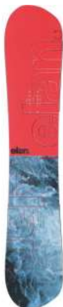
Slika 5.1.2.1.: Freestyle daske

njihovu vožnju, a malo prenapregnuće olakšava rotaciju. Dužina im je ispod 130 cm (ZTUSH, 2009:6), a za njih se upotrebljavaju meki vezovi. (Slika 5.1.2.1.)