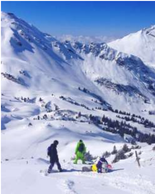
Slika 4.2.: Off-piste

Off-piste , u samom svom nazivu, nosi objašnjenje ovog stila freeridea . Freerider koristi uobičajeni prijevoz, odnosno žičaru, kako bi se popeo na početak staze, no prilikom spuštanja ne koristi postavljenu i uređenu stazu, nego se spušta pored nje, doslovno – „off-piste“. Ovaj stil freeridea uključuje spuštanje po neugaženom snijegu, između prirodnih prepreka koje sačinjavaju drveća, granje, kamenje i slično. (Slika 4.2.).