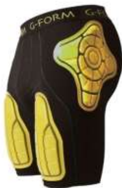
Slika 5.4.3.:Štitnik za stražnjicu