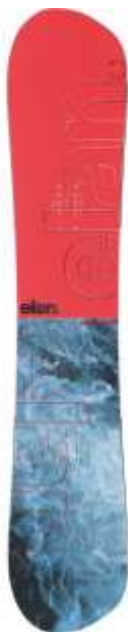
Slika 5.1.2.1.: Freestyle daske

njihovu vožnju, a malo prenapregnuće olakšava rotaciju. Dužina im je ispod 130 cm (ZTUSH, 2009:6), a za njih se upotrebljavaju meki vezovi. (Slika 5.1.2.1.)