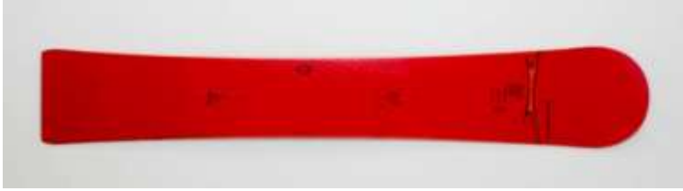
Slika 5.1.3.1.: Carving daska