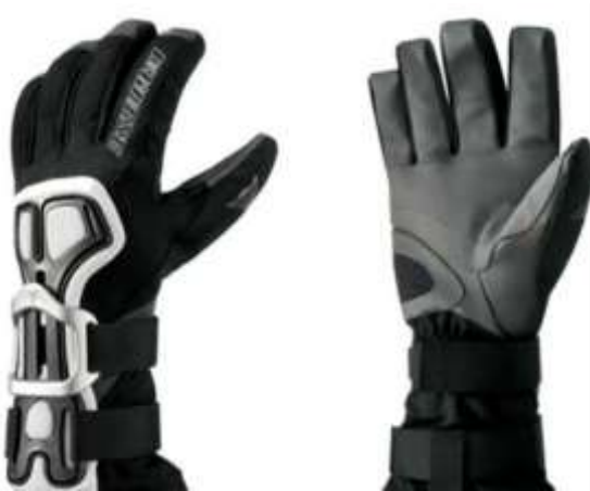
Slika 5.4.5.: Zaštitne rukavice