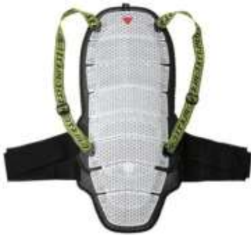
Slika 5.4.21.:Štitnik za leđa