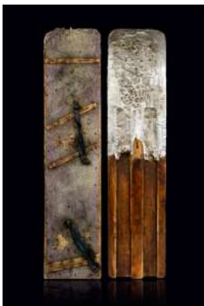
Slika 2.2.: Simsov prvi "skiboard" kao dio njegovog školskog projekta

ubrzo otvorio osobnu tvrtku koja je poznata i dan danas – „Sims snowboards“ (Slika 2.3.).(Snowplaza, 2013)