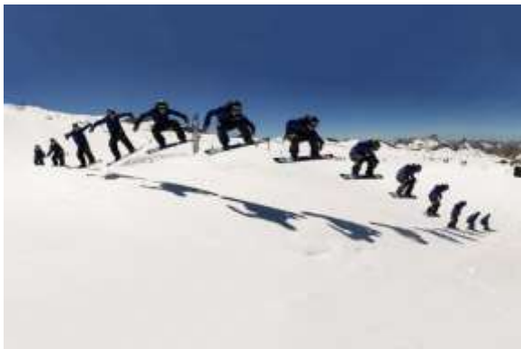
Slika 7.6.1.: Ollie

Ollie u slobodnom stilu vožnje izvodimo na način da ulazimo u čučanj istovremenim prebacivanjem težine na stražnju nogu. Odguravanjem od repa daske i naglim rasterećenjem težine tijela skačemo u zrak povlačenjem koljena prema sebi. Tada se daska nalazi u zraku paralelno s podlogom. Zatim doskačemo na punu dasku s težištem na obje noge i amortizacijom u koljenom zglobu. Ollie se u freerideu izvodi na sličan način uz neke razlike. Kod freeride olliea vršimo potisak na stražnju nogu ulaskom u čučanj. Time snijeg tlačimo kod repa daske, kako bi se stvrdnuo i kako bismo se mogli repom daske odgurnuti od njega. Odguravanjem i povlačenjem koljena prema prsima skačemo u zrak, a doskok izvodimo na stražnju nogu uz istovremenu amortizaciju koljenima. (Slika 7.6.1.).