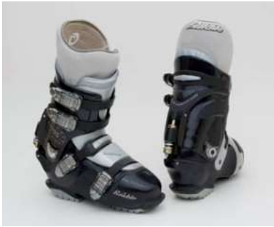
Slika 5.2.1.1.: Tvrde cipele