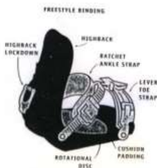
Slika 5.3.3.1.: Meki vezovi - dijelovi veza

Meki vezovi izrađuju se od gume ili plastike, a na njih je cipela pričvršćena pomoću dviju traka. Koriste se na freeride i frestyle daskama te omogućuju opuštenu vožnju i izvođenje skokova, te vožnju po neravnom terenu. (Slika 5.3.3.1.).