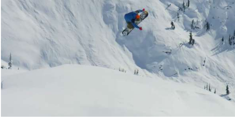
Slika 4.1.: Backcountry