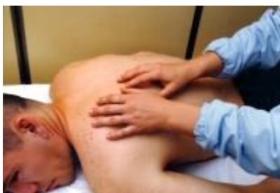
Slika 10. Vibracije i potresivanje (preuzeo sa http://www.stetoskop.info/Tehnika-masaze-4024-s13-content.htm )