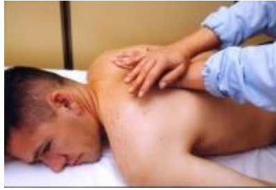
Slika 6. Trljanje dlanom