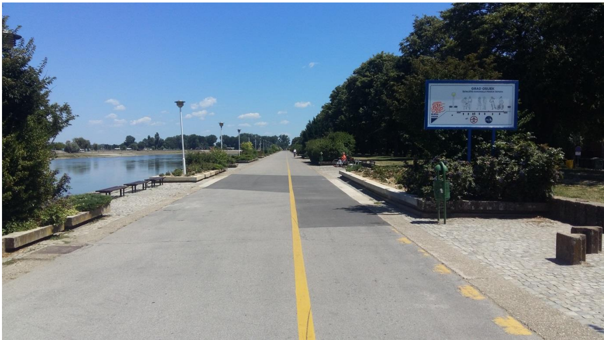
Slika 1. Promenada

Osijek je grad poznat i imenom Grad na Dravi . On to uistinu i je, jer se cijelom svojom dužinom proteže uz rijeku Dravu. Grad se širio duž toka rijeke Drave, čemu svjedoči njegov duguljasti oblik. Osijek doseže oko 10 kilometara duljine, a širok je svega 3 kilometra. Obala grada zaštićena je ali i ukrašena betonskom utvrdom, a rubni dijelovi grada zemljanim nasipom.