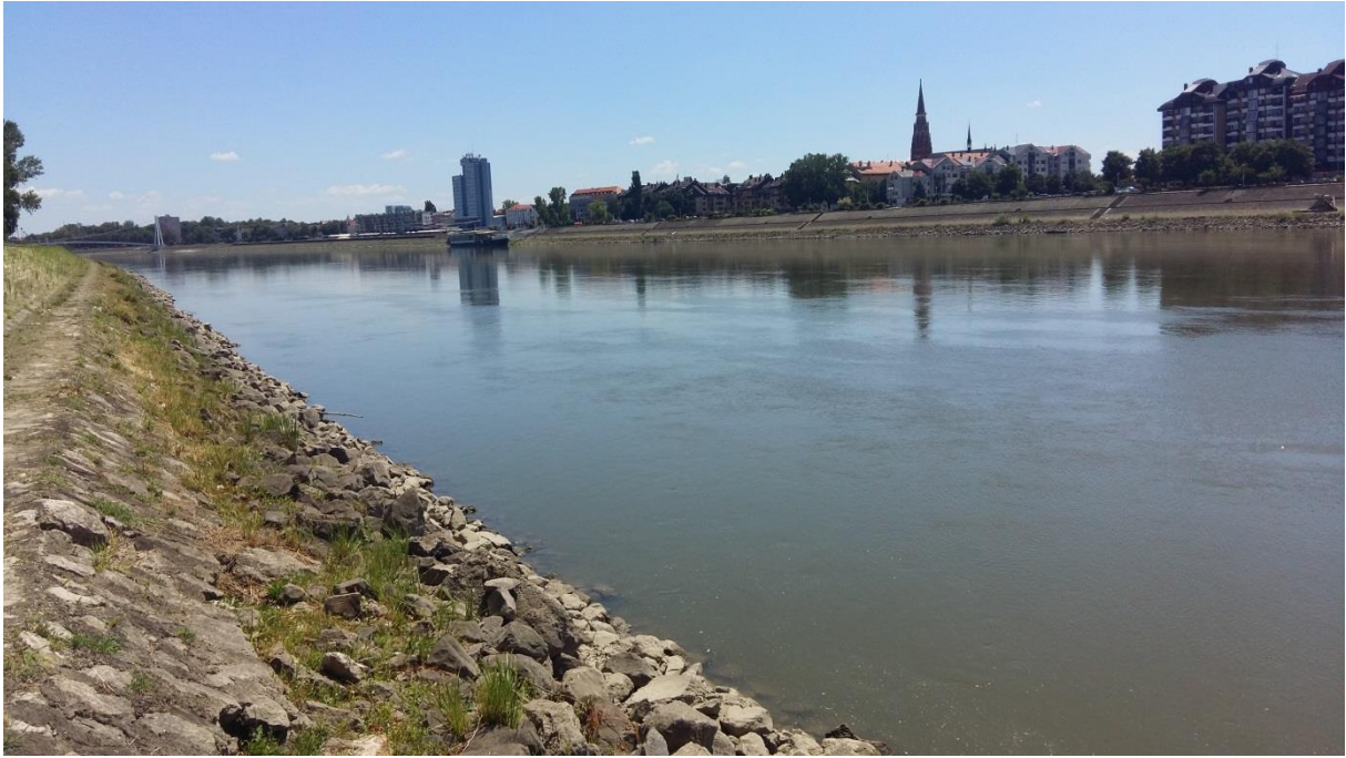
Slika 3. Tok rijeke Drave