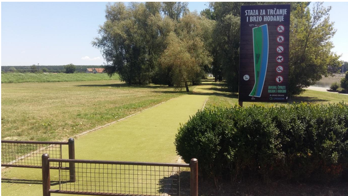
Slika 5. Staza za trčanje i brzo hodanje

Predlažem sljedeće programe: nordijsko hodanje, hodanje po uskim podlogama (ravnoteža), žustrije hodanje, ples na otvorenom, plivanje, vježbe disanje u parkovima, pecanje.