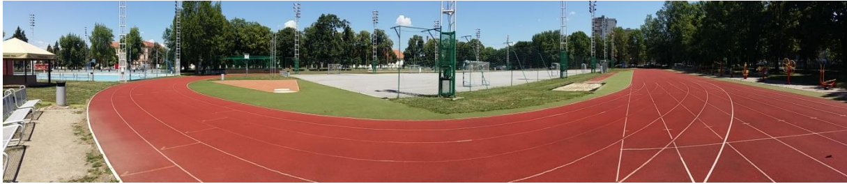
Slika 2. Srednjoškolsko igralište

Srednjoškolsko igralište jedno je od najprivlačnijih mjesta kako za mlade rekreativce, tako i za nastavu (slika 2). Njega koriste građani za rekreaciju, srednjoškolski centri za nastavu tjelesne i zdravstvene kulture, i to I. i II. gimnazije, Ekonomske škole i EMŠC-a, sve kategorije i razne udruge za humanitarne utakmice. Objekt je obnovljen 2013. godine. Sadrži stazu za trčanje, terene za nogomet i košarku, odbojkaško igralište u pijesku, bočalište, pijesak za skok u dalj te razne sprave za vježbanje. Skate park je također bio dio ovog objekta no preseljen je na lijevu obalu rijeke Drave. Riješeno je i pitanje prostora za bicikle. Svi korisnici ovog objekta isti koriste bez naknade.