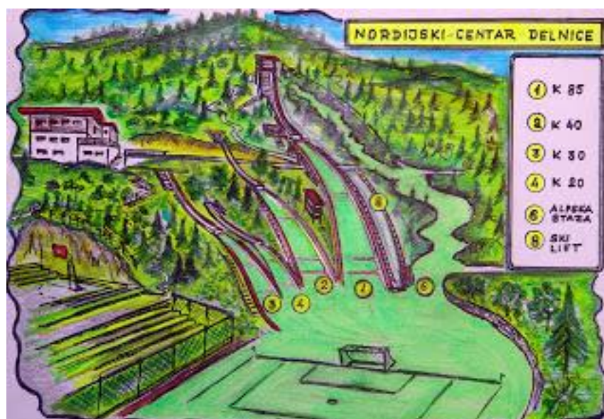
Slika 2. Prikaz plana izgradnje Nordijskog centra Delnice

“Grad Delnice u izgradnju je prateće infrastrukture ovih objekata uložio je 138000 kuna, a svota potrebna za daljnje radove vezane uz postavljanje pragova i plastike još nije određena, iako se zna da će plastika biti postavljena na skakaonice od 8 i 25 m, dok za trideset metarsku skakaonicu postoji obećanje Međunarodnog olimpijskog komiteta koji će taj novac osigurati iz sredstava solidarnosti. No, to, kao i radovi na izgradnji četrdeset pet metarske skakaonice, odnosno proširenja sedamdeset metarske na skakaonicu od 80-85 m sada su u drugom planu. Najbitnije je prije jeseni urediti ove dvije male skakaonice kako bi mali goranski skakači i skakačice napokon mogli svakodnevno trenirati u Delnicama” (Grad Delnice zeleno srce Hrvatske, 2009).