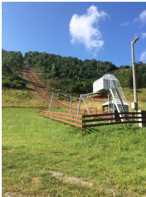
Slika 7. Prikaz vučnice u ljeto 2017. godine

Skijalište Čelimbaša nalazi se u mjestu Mrkopalj, udaljenom desetak kilometara od mjesta Ravna Gora, odnosno 15 km od grada Delnice. Što se tiče samog položaja skijališta, vrlo je povoljan iz razloga što kada siđete s autoceste Rijeka-Zagreb na izlazu Delnice, nastavite starom cestom prema Rijeci i za čas ste na skijalištu. Mjesto Mrkopalj nalazi se na 824 mnv, okruženo brdima Čelimbaša i Maj. Vrh Čelibaše nalazi se na 1084 mnv, u podnožju nalaze se tanjurići dužine 750 m koji vuku skijaše na vrh. Za razliku od vučnice na Petehovcu koja je na blagom terenu, vučnica je relativno strma i ne preporuča se djeci mlađoj od 10 godina.