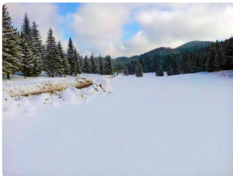
Slika 14. Vrbovska poljana