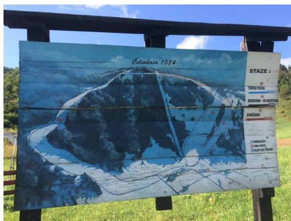
Slika 5. Mapa skijališta

za proizvodnju umjetnog snijega kako bi skijalište što dulje u zimskim mjesecima bilo u funkciji.