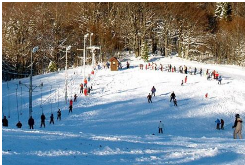
Slika 4. Skijaški centar “Petehovac”