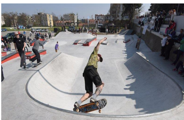
Slika 13. Skate park „Rojc“ u Puli 14

2. Prirodnim prostorima udaljenim od naseljenih mjesta. U prirodi najčešće se provode: