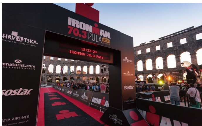
Slika 17. Cilj Ironman utke u Pulskoj Areni 18

Osim toga, dan ranije organizirana je dječja utrka „Ironkids“ kao popratni event, kojom se promovirala glavna utrka i njome su se otvorile mogućnosti daljnje tradicijske organizacije dječje utrke (Ironman 70.3 Pula, 2016).