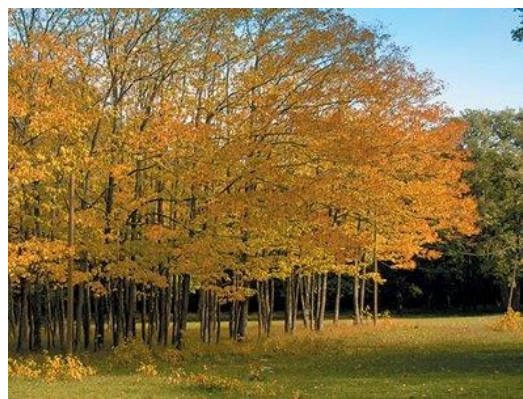
Slika 15. Park šuma „Šijana“ 16