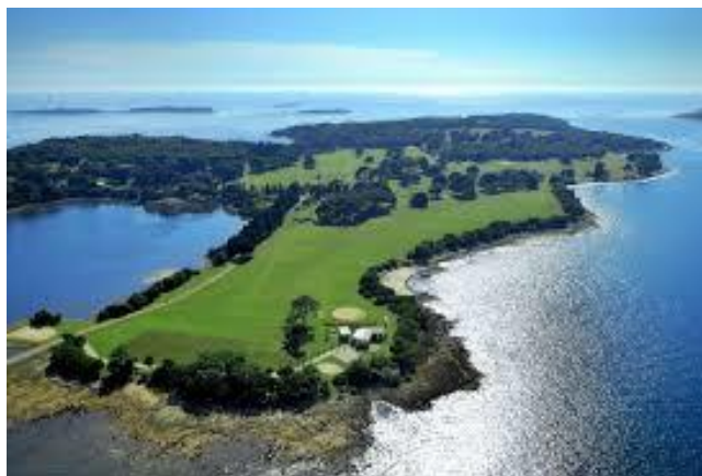
Slika 16. Golf teren na Brijunima 17

U blizini grada Pule, na otoku Brijuni, postoji jedno golf igralište ( slika 16 ), a kako raste broj gostiju iz godine u godinu, raste i potražnja za tom aktivnošću. Brijuni su proglašeni nacionalnim parkom i uvršteni na popis UNESCO-ve kulturne i prirodne baštine 1983. godine. (Blažević, 1984:93). Od toga nije profitirala samo okolica Brijuna - Fažana, Valbandon i Peroj, već i grad Pula, cijela Istarska regija i Republika Hrvatska. Brijune čini skupina od četrnaest otoka koje krase titula otočja mira i suradnje, kao takvi su poznati u cijelom svijetu te imaju neprocjenjivo turističko značenje za republiku Hrvatsku, Istru i grad Pulu. Zbog bogate kulturne baštine i povijesti, na Brijunima se razvija selektivni oblik turizma i to memorijalno-izletnički i kongresni turizam (Del Vecchio, 2015). Sportsko-rekreacijski turizam nije nepoznat pojam na Brijunima upravo zbog popularne ponude golfa.