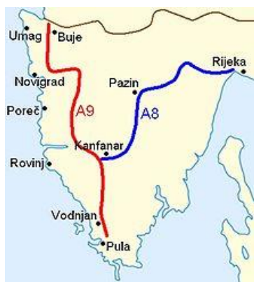
Slika 4. Istarski Ipsilon 5

Iz navedenog možemo zaključiti kako je jedan od faktora ulaganja u prometnu infrastrukturu i njena potražnja, odnosno statistika u i izvan sezone koja prikazuje broj vozila koji se tim relacijama kreću. Prateći trend razvoja turizma u Istri, i sve većeg broja gostiju koji ju posjećuju, za očekivati je da će se prometna infrastruktura i dalje razvijati kako bi, turistima iz područja Središnje Europe, pružala brz i efikasan izlazak na more. Prema podacima iz 2008. godine, 70% međunarodnih turista u Hrvatsku dolazi automobilima (Škorić, 2008). To je bitan podatak jer, između ostalog, omogućuje integraciju biciklističkih sportsko-rekreacijskih ponuda i to bez prevelikih investicija u pogledu opreme, budući da turisti mogu svoju biciklističku opremu ponijeti sa sobom na putovanje.