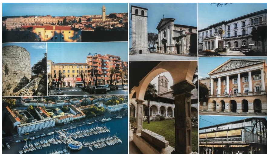
Slika 3. Grad Pula i njegove znamenitosti 3

Grad Pula ( slika 3 ) kao turistička destinacija atraktivan je između ostalog zbog bogate kulturno-spomeničke baštine, koja je ostavština rimskog carstva i Austro-Ugarske monarhije. Ne može se zanemariti prekrasna obala i uređene plaže, kao ni pogodan geografski položaj i klimatski uvjeti. Značaj kulturno-spomeničke baštine, i njezin utjecaj na turizam biti će prikazan u posebnom poglavlju ovoga diplomskoga rada.