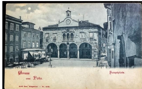
Slika 7. Pulska Vijećnica, Forum 8

Pula kao najveća baza Austro-Ugarske ratne mornarice ( slika 8 ) godinama se razvijala kao središte morskih i prometnih puteva, tada u vojne svrhe, a danas, zahvaljujući tim komunikacijama razvija se u vodeću turističku regiju u Republici Hrvatskoj. Podzemni tuneli kojima je grad isprepleten bili su u funkciji strateškog kretanja vojske. Grad je, po uzoru na Rim, izgrađen na 7 brežuljaka.