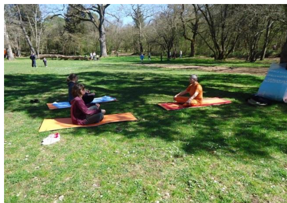
Slika 10. Yoga i meditacija u Šijanskoj šumi