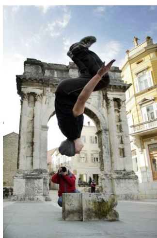
Slika 12. Parkour u Puli 13