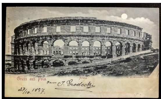
Slika 6. Pulski Amfiteatar 1897. godine 7

Poznati britanski dnevni list „The Guardian“ na svome je portalu istaknuo pulsku Arenu kao primjer jednog od najbolje očuvanih rimskih amfiteatara koji do danas ima posve sačuvane sve tri kamene razine. Stoga ne čudi podatak da je Pulu je Arenu u 2015. godini (kraj studenog) posjetilo 394.235 posjetitelja. (Golja i sur., 2015).