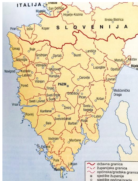
Slika 2. Istra: Administrativna podjela 2

O turističkoj moći Istarske regije i grada Pule najviše svjedoči godišnji trend povećanja broja noćenja. Tako je npr. u gradu Puli do kraja listopada 2015. ostvareno 1.6 milijuna noćenja i 295.297 dolazaka, što predstavlja porast od 6,6% noćenja odnosno 8% dolazaka u odnosu na isto prošlogodišnje razdoblje. (Golja i sur., 2015). Grad Pula kao najveći grad Istarske županije i osmi po veličini u Republici Hrvatskoj značajno pridonosi razvoju županije ali i cijele države. Stoga će se u ovome diplomskom radu između ostaloga iznositi činjenice na razini Istre i povući će se manje paralele na državnoj razini.