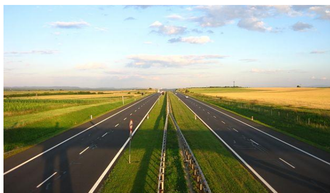
Slika 5. Istarski Ipsilon 6