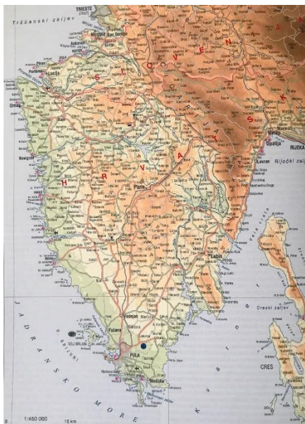
Slika 1. Istarski poluotok 1

Istarski poluotok ( slika 1 ) najveći je poluotok na Jadranu a smješten je na sjeveroistočnom dijelu Jadranskog mora. Sa Sjeverozapadne strane graniči sa Slovenijom, a morskim putem sa Italijom. Hrvatskoj pripada 90% površine Istarskog poluotoka, a on predstavlja 4,98% ukupne površine Republike Hrvatske ( slika 2 ).