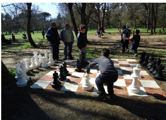
Slika 9. Šah u Šijanskoj šumi

Program traje tri do četiri vikenda uz mnoge sportske i sportsko-rekreacijske, te zdravstvene aktivnosti ( slike 9, 10 ) 11 .