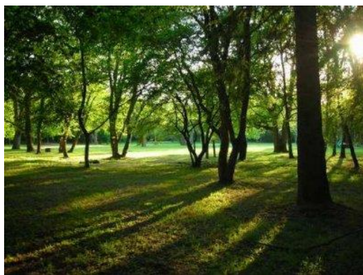
Slika 14. Park šuma „Šijana“ 15

3. Izletištima u blizini grada i rekreacijskim centri na periferiji grada – uobičajeno u „zelenim zonama“. Najpoznatija zelena zona u gradu Puli je park šuma „Šijana“ koja nudi sadržaje za sportsku rekreaciju kao što su trim staze, zelene površine, staze za motocross i „brdski biciklizam“, te dječja igrališta.