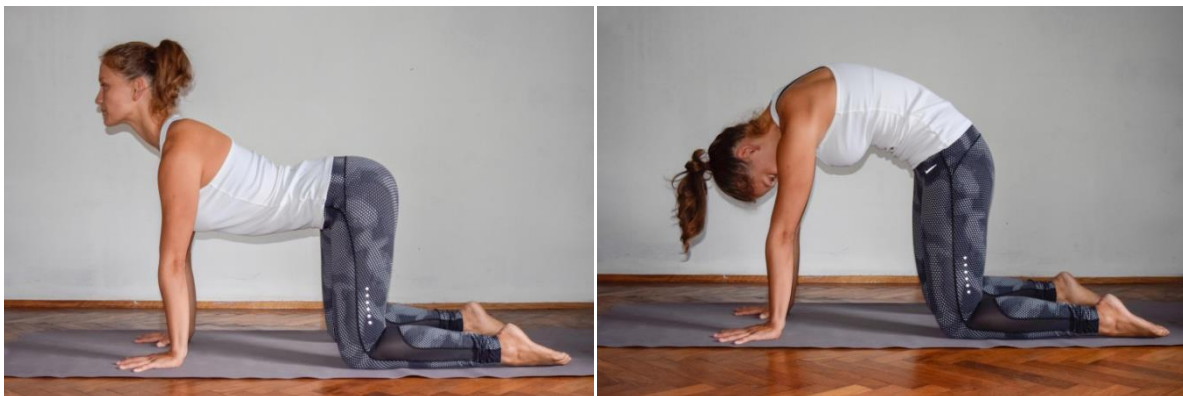
Slika 3: Bidalāsana

U položaju upora prednjeg na koljenima gdje su nam dlanovi ispod ramena, a koljena ispod kukova, na udisaj uvinemo kralježnicu i pogled ide prema naprijed, a na izdisaj zaoblimo kralježnicu, podvučemo zdjelicu i bradu položimo na prsa. Bitno je da je donji dio trbuha cijelo vrijeme aktivan (Bandhe) tj. da se ne opušta u fazi udisaja. Vježbom utječemo kako na fleksibilnost tako i na jakost mišića trupa ali i ostalih mišića.