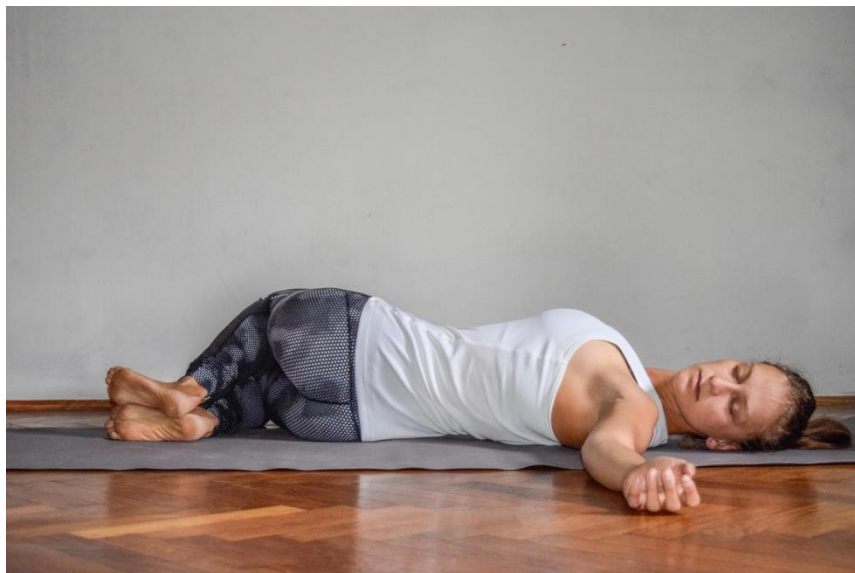
Slika 2: Osnovna torzija

Ležimo na leđima, noge su savijene, a ruke pružene u visini ramena dlanova okrenutih gore. Uz izdisaj noge spuštamo na jednu stranu pazeći da nam se stopalo "penje" na stopalo, a glavu okrenemo u suprotnu stranu. Udisajem se vraćamo u početnu poziciju. Vježbom istežemo i aktiviramo duboke posturalne mišiće kralježnice. Djelujemo na vratne i ramene mišiće. Eliminiramo bolove u kralježnici, pogotovo njenom lumbalnom dijelu.