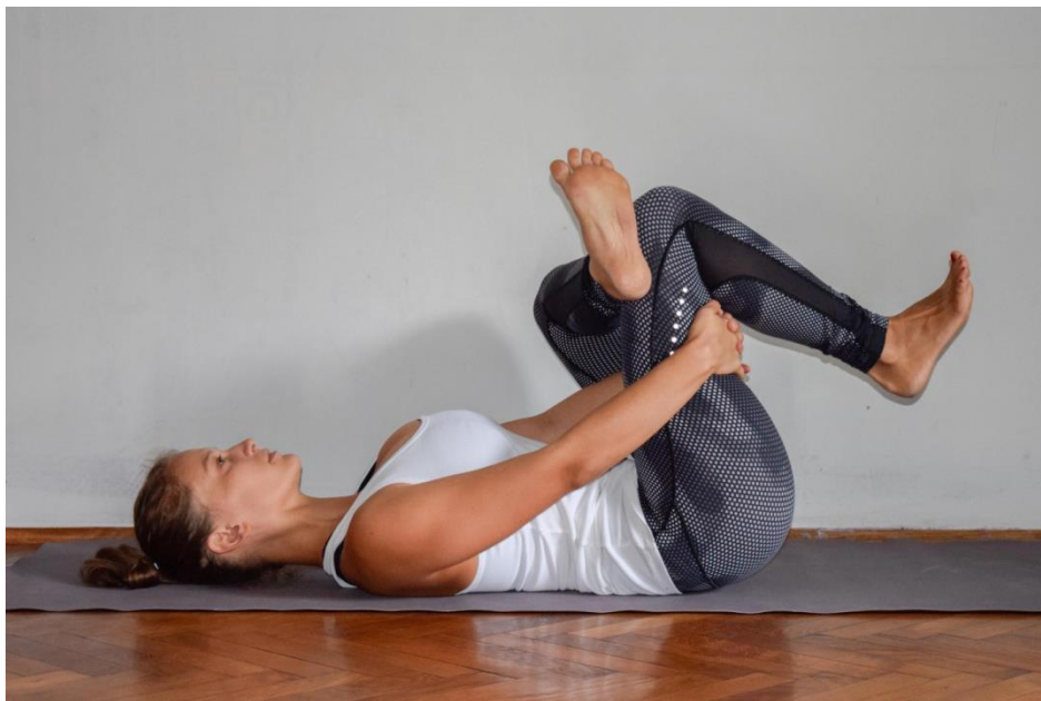
Slika 5: Supta kapotasana

Ležimo na leđima. Gležanj jedne noge postavimo iznad koljena druge noge, te rukama obgrlimo natkoljenicu te noge. Povlačimo natkoljenicu prema prsima, a koljeno druge noge guramo u suprotnom smjeru. Dišemo cijelo vrijeme duboko. Vježbom otvaramo mišiće zdjelice, a posebno se isteže piriformis koji može biti jedan od uzročnika lumbalnog bolnog sindroma.