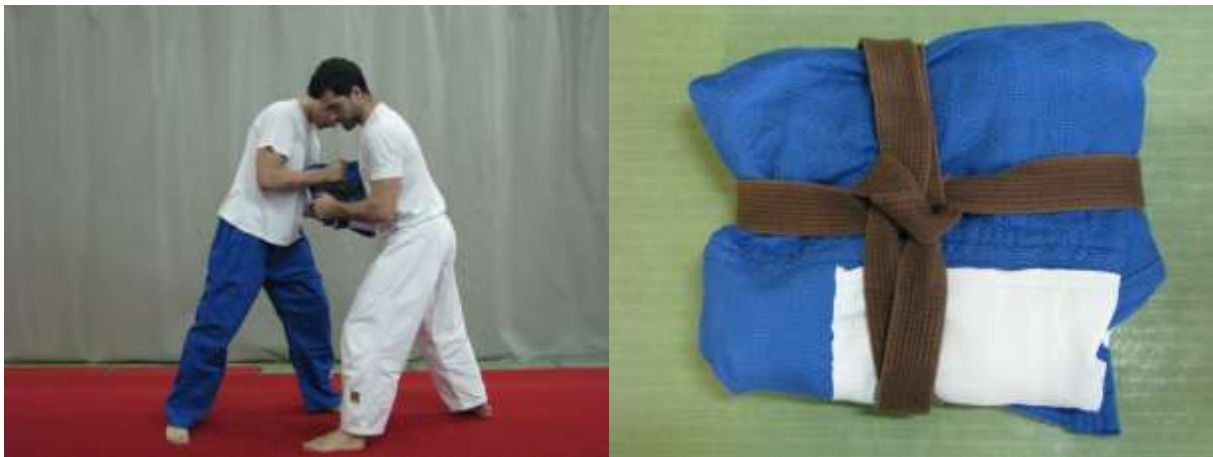
Slika 21. Borba za kimono

Jednostavni oblici hrvanja veoma su koristan trenažni operator jer svojim kretnim strukturama slične kretanjima hrvača u borbi te su natjecateljskog karaktera. Utječu na poboljšanje motoričkih i funkcionalnih sposobnosti, razvoj taktike i taktičkog razmišljanja te služe za razvoj i učvršćivanje natjecateljskog duha. Najčešće se koriste kao uvod u glavni dio sata na satovima specifične kondicijske pripreme i na ostalim specifičnim treninzima. "Njihov utjecaj je velik i na samopouzdanje, borbenost, hrabrost, snalaženje u nepredviđenim situacijama, privikavanje na pobjedu i poraz te na ostale osobine važne za uspjeh u hrvanju. Također, igrama se razvija vedro raspoloženje na treningu, što olakšava svladavanje velikih trenažnih opterećenja koji obično slijede nakon takvih sadržaja" (Slačanac, Baić, Cvetković, Horvatin-Fučkar, 2010).