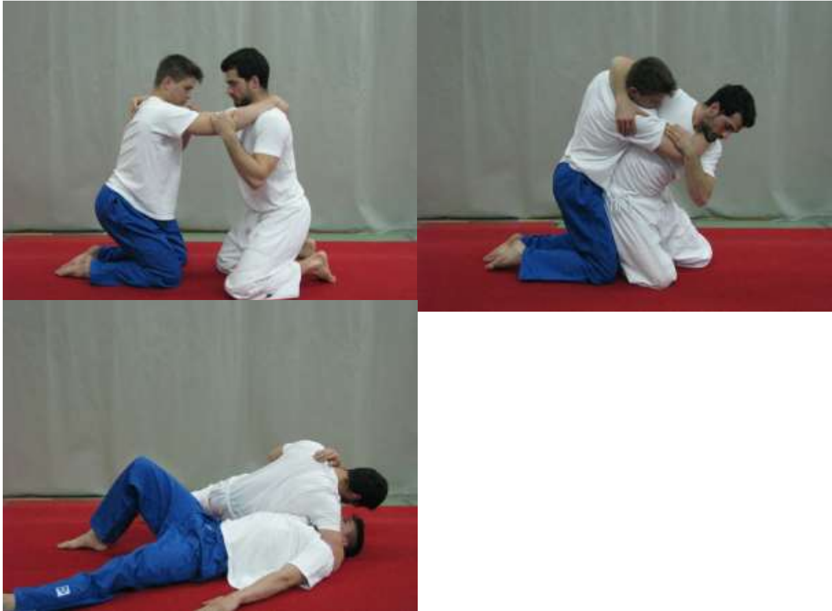
Slika 24. Borba na koljenima

Iz istoimenog hvata za ruku i glavu borci ne raspuštajući ruke nastoje jedan drugoga oboriti na tlo. Ova igra se može koristiti kao priprema za bacanje protivnika kod najmlađih judaša i hrvača prije prelaska na tehnike bacanja u stojećem stavu (sl. 24).