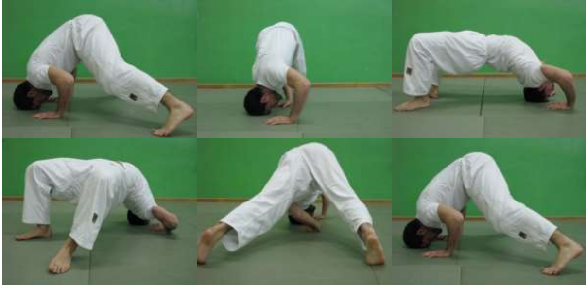
Slika 20. Obilaženje oko glave (šestarenje)

Iz položaja prednjeg mosta vježbač rotacijom tijela oko glave prelazi u poziciju stražnjeg mosta te daljnjom rotacijom se vraća nazad u poziciju prednjeg mosta. Napomena kod ove vježbe jest da glava odnosno pogled ostaje u istoj poziciji tijekom izvođenja vježbe. Vježba služi za povećanje fleksibilnosti mišića zdjelice i kralježnice (sl. 20).