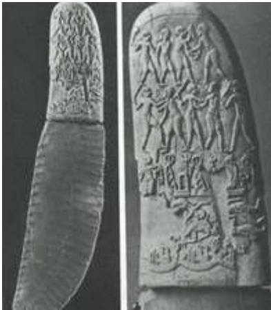
Slika 3. Nož i pripadajuće korice sa motivima hrvača 3100. god. p.n.e.

Analizirajući povijest hrvanja (prema Marić i sur., 2007.) može se zaključiti da hrvanje naprotiv ostalih modernijih sportova nema svog izumitelja, i vjeruje se da je staro kolika je stara i ljudska civilizacija. U početku različiti oblici hrvanja, karakteristični za pojedine zemlje, upotrebljavali su se kao sredstvo obuke i pripreme vojske za ratovanje. U skladu sa specifičnostima zemlje, populacije, taktike i stila ratovanja pojedine zemlje više su upotrebljavale brzinu i okretnost u hrvanju (Japan, Korea, Kina, Turska) dok su neke više bile orijentirane na upotrebu snage u borbi sa obuhvatom (Gruzija, Slaveni, Kelti, Skandinavci, Germani, Gali). Daljnji razvoj naoružanja i vojne opreme smanjuje značaj hrvanja no ono i dalje ostaje nezamjenjivo sredstvo za fizičku i psihološku pripremu vojske.