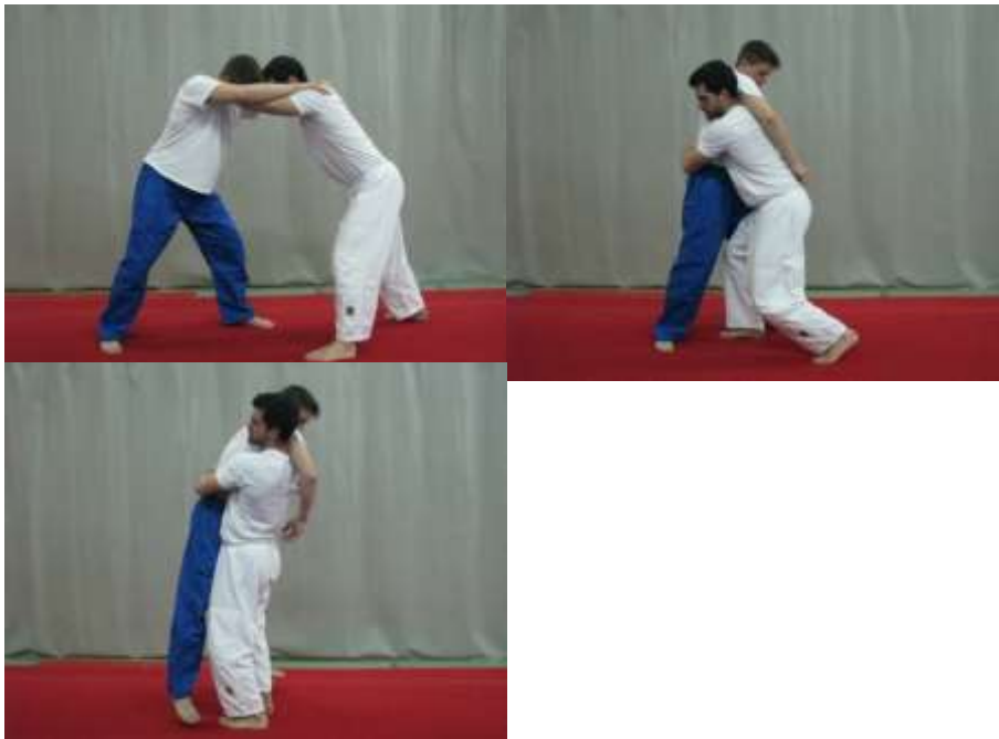
Slika 22. Borba za pojas

Iz uspravnog stojećeg položaja gdje se ruke nalaze na partnerovim ramenima borac pokušava doći u poziciju za tehniku bacanja obuhvatom oko trupa. Pobjednik je onaj borac koji više puta uspije podići protivnika od tla (sl. 22).