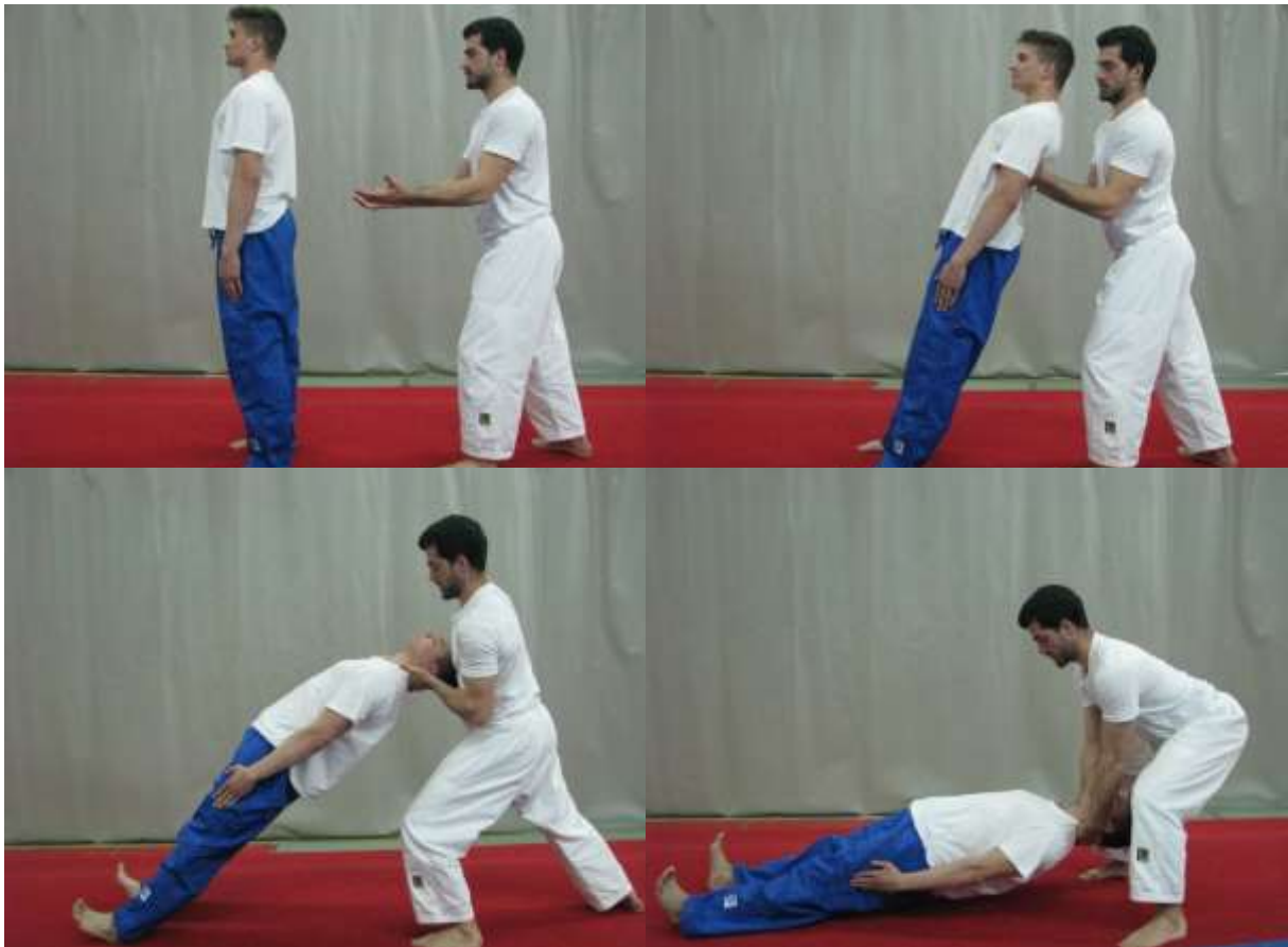
Slika 9. Mrtvo dizanje.

Suvježbač stoji leđima okrenut prema vježbaču te nakon što ostvari napetost u mišićima cijelog tijela počinje padati na leđa. Vježbač ga prati rukama te ga kontrolirano spušta do poda i istim principom vraća nazad u početni položaj. Veoma je važno da su vježbačeva leđa ravna tijekom izvođenja cijele vježbe te da suvježbač ostvari ukočen položaj tijela te tako vježbu učinio izvedivom. Vježba služi za jačanje mišića ruku, ramenog pojasa, leđa i nogu (sl. 9).