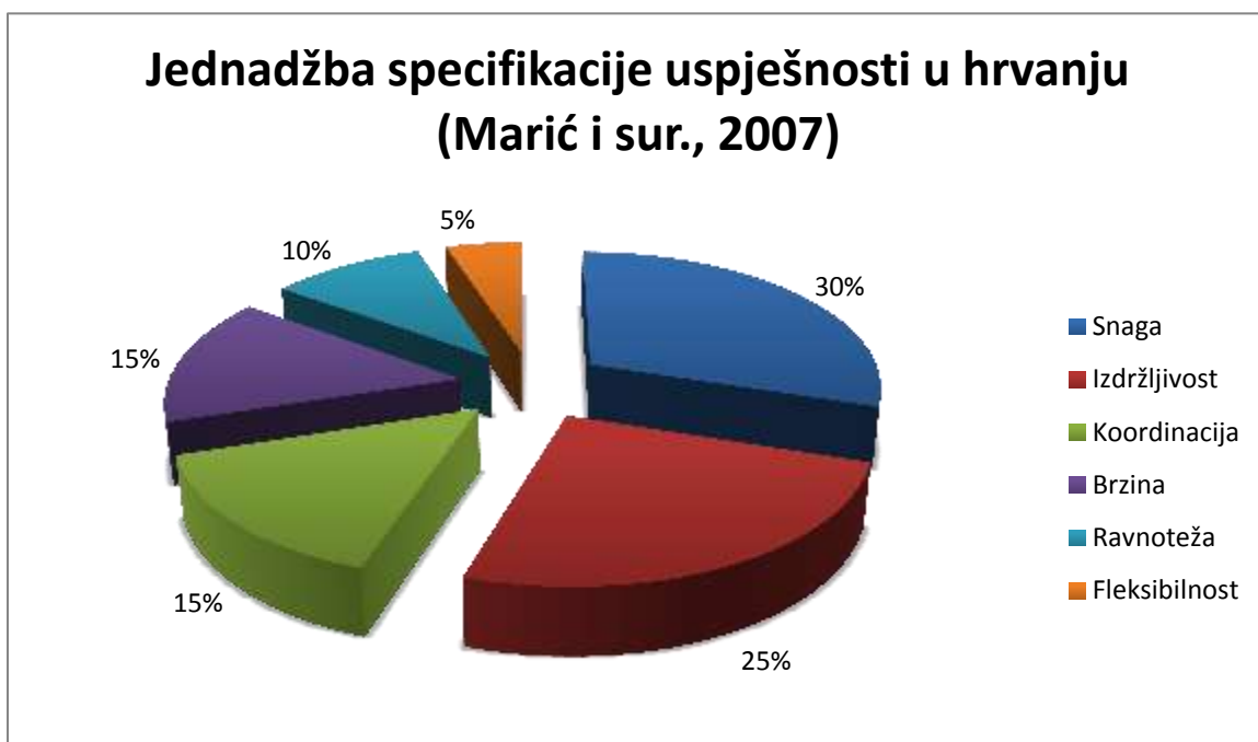
Dijagram 2 Jednadžba specifikacije uspješnosti u hrvanju

Jednadžba specifikacije uspjeha u bilo kojem sportu predstavlja hipotetski ili znanstveno utvrđenu hijerarhijsku strukturu sposobnosti, osobina i znanja potrebnih za