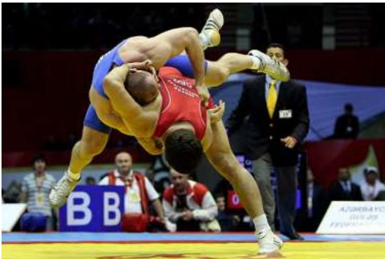
Slika 2. Bacanje u borbi hrvanja