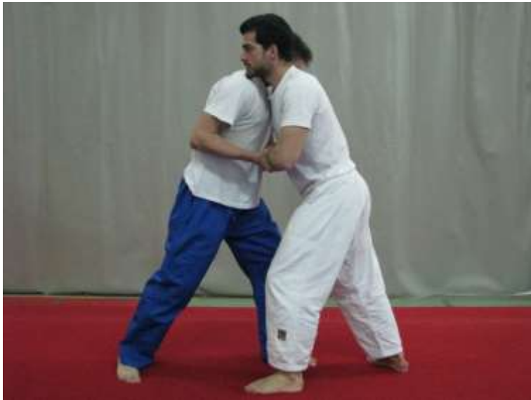
Slika 8. Čekičanje

Vježbači u stojećem istoimenom gardu naslonjeni prsima jedan na drugoga izvode čvrste izmjene hvatova za podlaktice te oslobađanja od istih. Vježba služi za jačanje mišića ruku i ramenog pojasa (sl. 8).