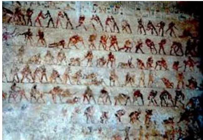
Slika 4. Freska iz egipatske grobnice iz 2050 – 1800.-te god. p.n.e.

Najstariji i najvrijedniji povijesni trag o hrvanju je kameni nož sa koricama u kojima su uklesani motivi hrvača. Vjeruje se da kameni nož sa pripadajućim koricama datira iz 3100. god. p.n.e. Pronađen je u grobnici Djabal el-Arak a u današnje vrijeme čuva se u Pariškom muzeju Louvre. U kraljevskim grobnicama XI. I XII. dinastije u Egiptu pronađene su freske koje pokazuju veoma raznoliku i bogatu tehniku hrvačkog sporta a datiraju procjenjuje se između 2050 – 1800.-te godine p.n.e.