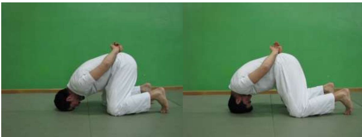
Slika 16. Prednji most na koljenima bez oslonca na rukama

Kada je prva faza prednjeg mosta usvojena, vratna muskulatura ojačana te sigurnost vježbača u izvođenje vježbe povećava prelazi se na sljedeći korak progresije prednjeg mosta. Micanjem ruku sa podloge povećava se opterećenje na muskulaturu vratne kralježnice i tako ostvaruje prvi korak napretka, progresivno opterećenje (sl 16).