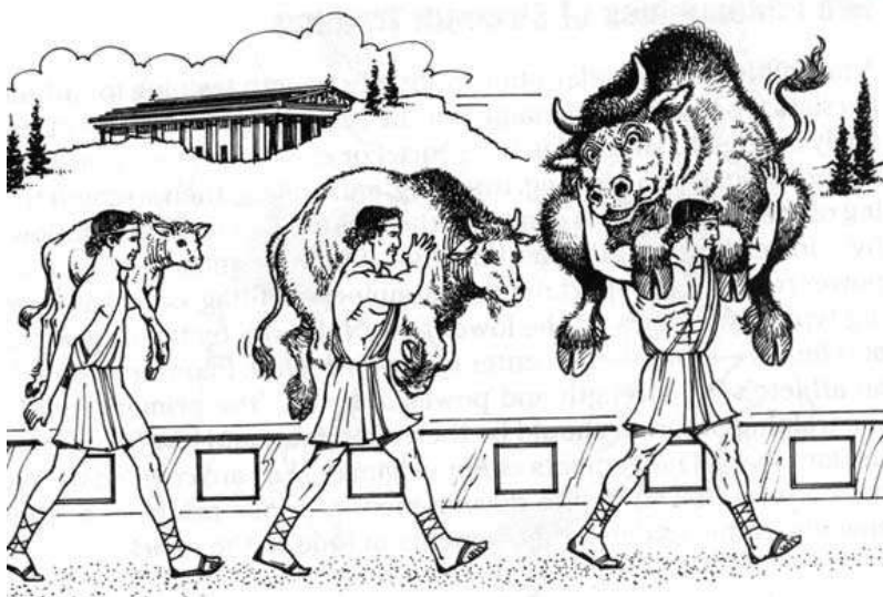
Slika 5. Milon iz Krotona

O podvizima snage i umijeću hrvača iz tog vremena stoje mnogi zapisi i legende. Jedan od najslavnijih hrvača Antičkog vremena zasigurno je Milon iz Krotona.