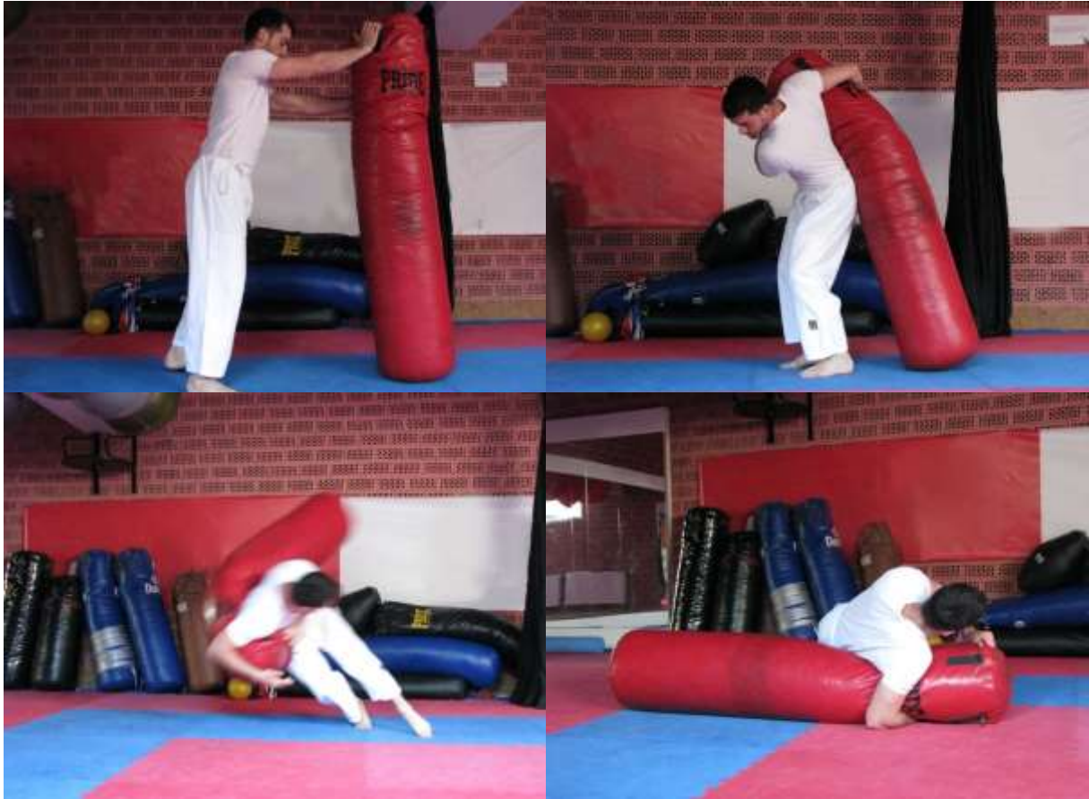
Slika 6. Bacanje vreće (lutke) obuhvatom oko glave