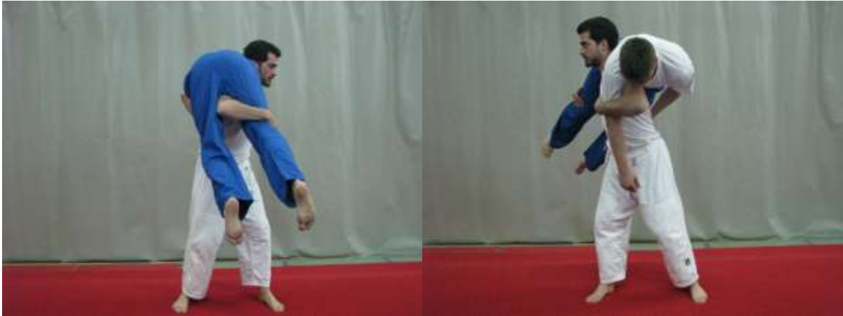
Slika 11. Zasuci tijelom

Iz obostranog klečećeg položaja vježbač obuhvatom oko trupa podiže suvježbača od tla. Vježba služi za jačanje mišića ruku, leđa i nogu. Važno je da su leđa vježbača ravna tokom izvođenja vježbe te da mu trup bude što bliže suvježbačevom trupu (sl. 10).