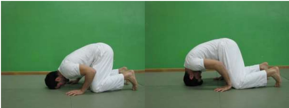
Slika 15. Prednji most na koljenima i sa osloncem na rukama

Specifične vježbe hrvačkog mosta nastale su još u drevnoj Grčkoj prema opisu Pindara, te danas broje više od 70 vježbi. Vježbe hrvačkog mosta podjednako jačaju vratnu muskulaturu, mišiće trupa i nogu te razvijaju fleksibilnost kralježnice. Isto tako pomažu u svladavanju automatskih obrambenih refleksa prilikom padanja u nazad ili preko glave. Na slikama će biti prikazana jednostavna progresija prednjeg mosta koja se koristi za jačanje vratne muskulature kako početnika tako i sportaša ili rekreativaca koji nisu u mogućnosti u cijelosti izvesti zadnju, najzahtjevniju fazu vježbe.