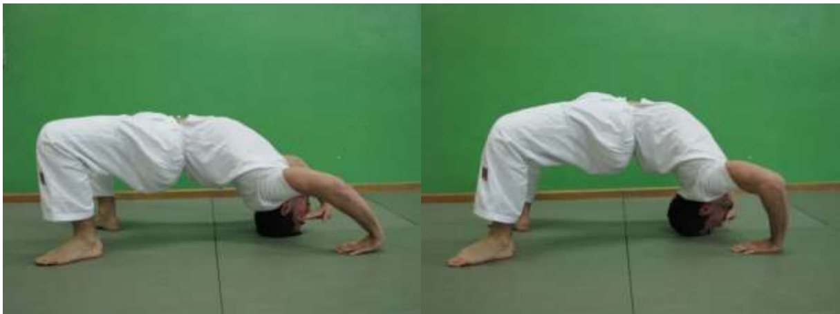
Slika 19. Ljuljanje u mostu

Odizanjem ruku od podloge ostvaruje se najveće opterećenje na mišiće vratne kralježnice te kao završna faza progresije ujedno je i najzahtjevnija. Do ove faze vježbe dolazi se kontinuiranim radom na prijašnjim fazama i provođenju vježbe tijekom pripremnog dijela sata ili treninga (sl. 18).