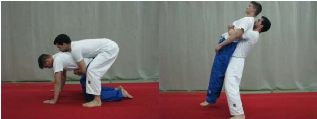
Slika 13. Podizanje iz klečećeg položaja obuhvatom oko trupa

Preporučuje se prilikom prvih pokušaja izvedbe ovu vježbu izvoditi sa lakšim suvježbačem (sl. 12).