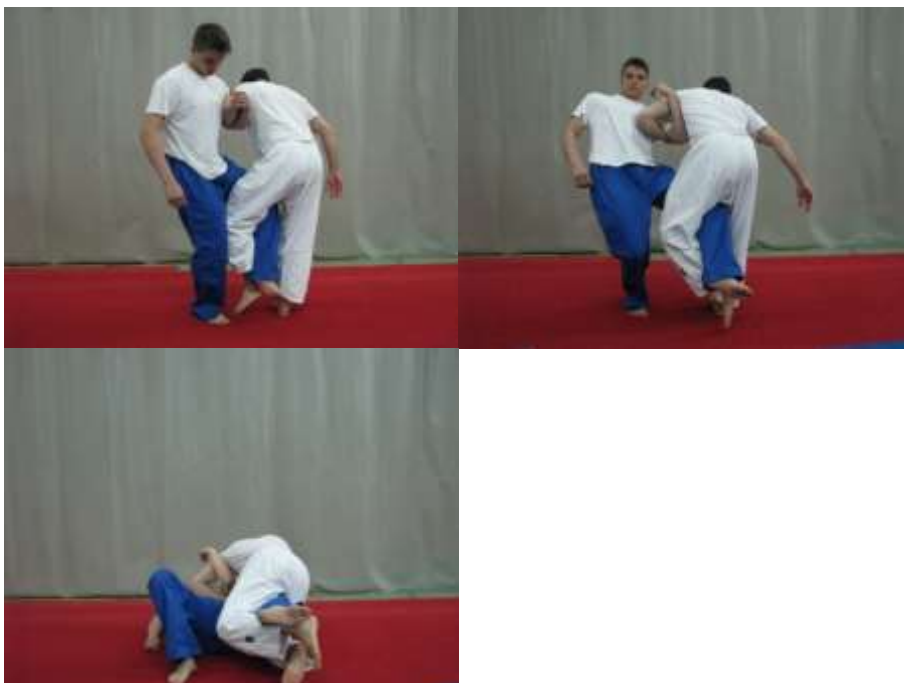
Slika 23. Borba kukama

Iz uspravnog stojećeg položaja gdje se ruke nalaze na partnerovim ramenima borac pokušava doći u poziciju za tehniku bacanja obuhvatom oko trupa. Pobjednik je onaj borac koji više puta uspije podići protivnika od tla (sl. 22).