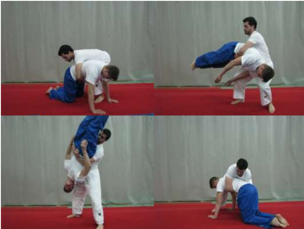
Slika 14. Podizanje i klečećeg položaja obuhvatom oko trupa sa rotacijom

Iz širokog raskoračnog stava vježbač obuhvati suvježbača oko trupa te izvodi pretklone trupa provlačeći suvježbača kroz noge. Vježba služi za jačanje mišića leđa, ruku i nogu. Suvježbač prilikom izvedbe vježbe pokušava maksimalno uvinuti tijelo te se čvrsto držati za ruke vježbača, dok vježbačeva leđa moraju ostati ravna tijekom cijele izvedbe (sl. 13).