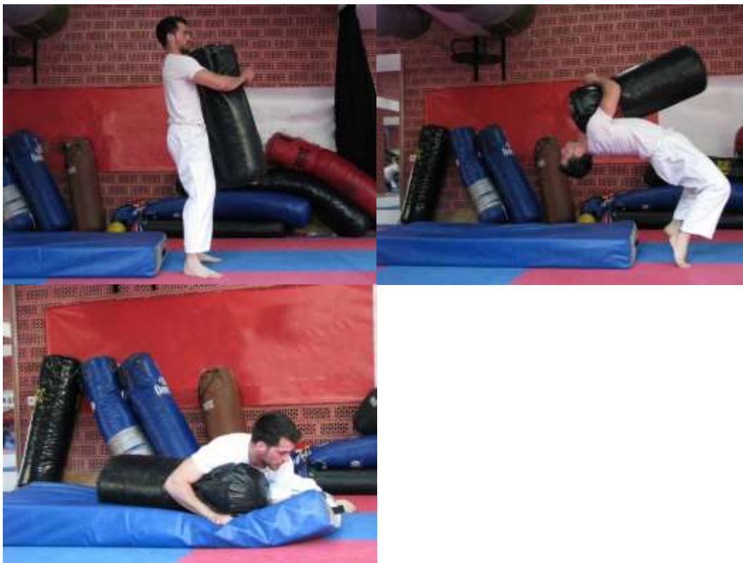
Slika 7. Bacanje vreće (lutke) obuhvatom oko trupa (pojas)