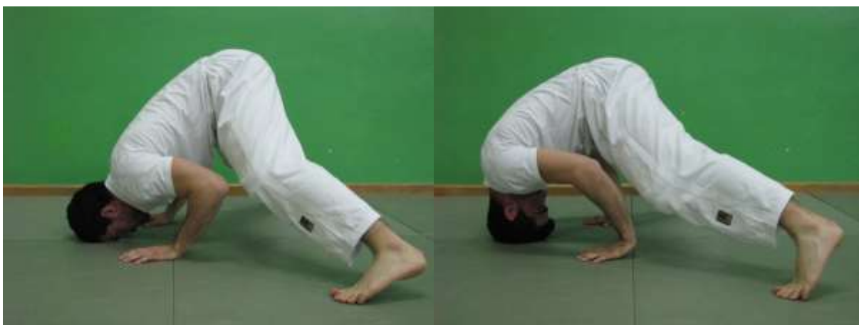
Slika 17. Prednji most

Kada je prva faza prednjeg mosta usvojena, vratna muskulatura ojačana te sigurnost vježbača u izvođenje vježbe povećava prelazi se na sljedeći korak progresije prednjeg mosta. Micanjem ruku sa podloge povećava se opterećenje na muskulaturu vratne kralježnice i tako ostvaruje prvi korak napretka, progresivno opterećenje (sl 16).