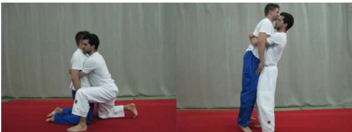
Slika 10. Podizanje iz klečanja obuhvatom oko trupa

Suvježbač stoji leđima okrenut prema vježbaču te nakon što ostvari napetost u mišićima cijelog tijela počinje padati na leđa. Vježbač ga prati rukama te ga kontrolirano spušta do poda i istim principom vraća nazad u početni položaj. Veoma je važno da su vježbačeva leđa ravna tijekom izvođenja cijele vježbe te da suvježbač ostvari ukočen položaj tijela te tako vježbu učinio izvedivom. Vježba služi za jačanje mišića ruku, ramenog pojasa, leđa i nogu (sl. 9).