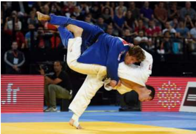
Slika 1. Bacanje u judo borbi

Cilj ovog rada je prikazati specifične vježbe iz hrvackog sporta koje možemo efikasno primijeniti u treningu judaša. Upotreba navedenih vježbi bila bi opisana kao sredstvo treninga u pripremnom, glavnom i završnom dijelu sata. Pored toga cilj je usporediti strukturu oba sporta i naglasiti povezanost između hrvanja i juda koje su velikim dijelom utjecale na obrađivanje navedene teme. Svrha je rada prikazati hrvacki sport kao temeljni sport koji svojom bogatom tehničkom strukturom može koristiti kao snažan kineziološki transformator u svim ostalim sportovima, posebice u judu.