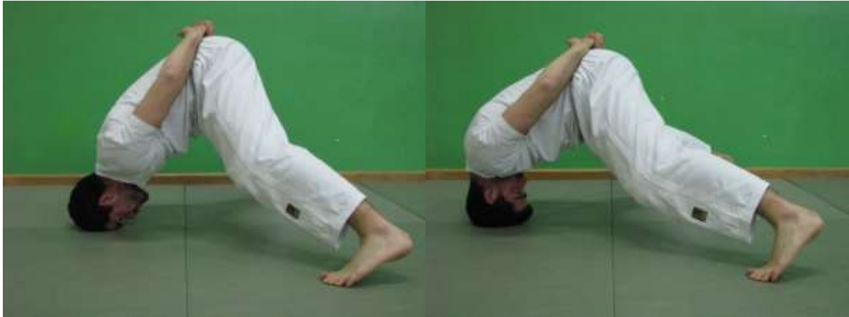
Slika 18. Prednji most bez oslonca na rukama

Odizanjem ruku od podloge ostvaruje se najveće opterećenje na mišiće vratne kralježnice te kao završna faza progresije ujedno je i najzahtjevnija. Do ove faze vježbe dolazi se kontinuiranim radom na prijašnjim fazama i provođenju vježbe tijekom pripremnog dijela sata ili treninga (sl. 18).