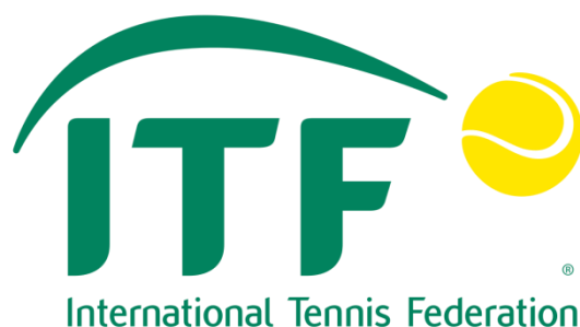
Slika 1. Logo Međunarodne svjetske organizacije ITF-a, itftennis.com (2017.)

Tenis je posljednjih godina na lošem glasu jer vlada mišljenje kako je teniske mečeve najlakše namjestiti. Naime, za razliku od ekipnih sportova poput nogometa, košarke ili rukometa, u tenisu se oko konačnog ishoda utakmice nije potrebno dogovoriti s pola momčadi već samo s jednim čovjekom koji tomu može pridonijeti namjernim pogreškama tijekom igre ( Index.hr, 2016 ). Za problem moguće postojanosti korupcije u tenisu, okrivljuju se teniske organizacije, koje su posljednjih deset godina povisile nagrade na najvećim turnirima, dok su nagrade na nižim turnirima ostale iste. Da bi se od tenisa moglo zarađivati, važno je biti među 50 najboljih tenisača svijeta. Tomu doprinosi i činjenica kako prosječni nogometaš tjedno zaradi kao dvjestoti tenisač svijeta godišnje. Ovakvi prilozima odlična su reklama za kladionice.