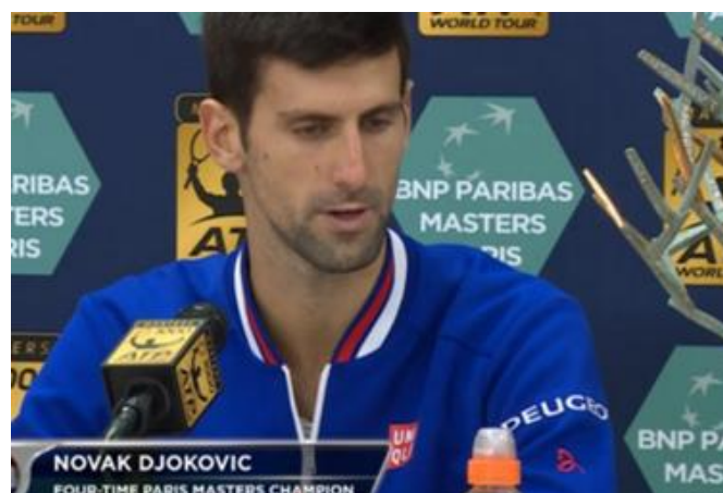
Slika 2. Novak Đoković

„On je tvrdio da nikada nije pristao na ponude za namještanje mečeva, ali i da mu je u više navrata nuđen novac za poraze u glavnom ždrijebu na velikim turnirima ATP serije. Kada je prošle godine prije Australian Opena upravo BBC zajedno s BuzzFeedom objavio informacije da je 16 tenisača iz top 50 ATP liste pod istragom zbog namještanja, tadašnji je teniski broj jedan Novak Đoković potvrdio da mu je preko posrednika 2006. nuđeno 200 000 dolara da pusti meč prvog kola u Sankt Petersburgu.“ ( telesport.telegram.hr, 2017 ).