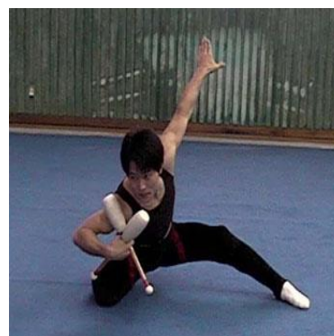
Slika 5: Čunjevi