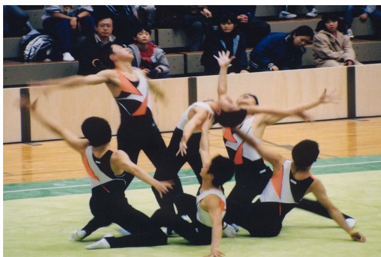
Slika 1: Grupna vježba

Što se tiče samog natjecanja, suci moraju biti udaljeni od samog partera minimalno 4m. Natjecatelji se mogu natjecati individualno odnosno pojedinačno ili u skupinama odnosno grupno. Kod grupnih natjecanja broj natjecatelja po grupi je 5 ili maksimalno 6. Ovisno o tome natječete li se u skupinama ili pojedinačno ima propisano vrijeme izvođenja vježbe. Skupne vježbe traju od 2 minute 30 sekundi do maksimalno 3 minute, dok individualne vježbe traju od 1 minute do 1 minute 30 sekundi. Ovaj sport se ponekad naziva i sinkronizirana gimnastika zbog toga što kombinira dinamične moćne akrobacije sa savršenim sinkroniziranim pokretima.