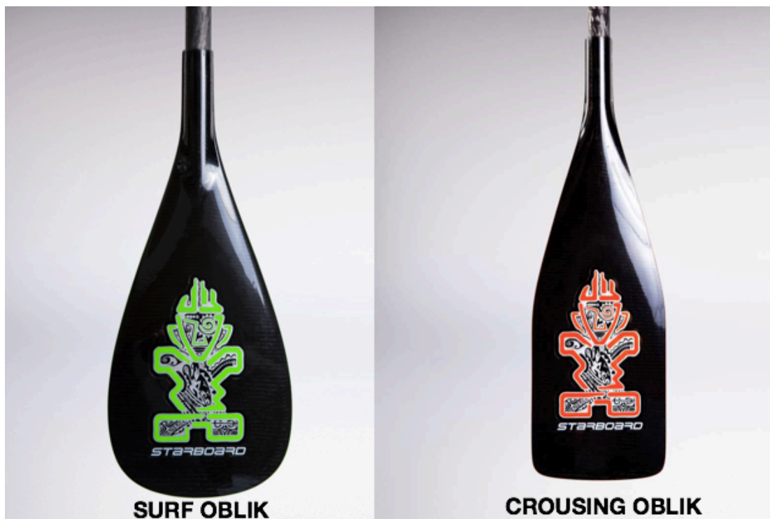
Slika 4. Tipovi vesla, Starboard, 2015, skinuto s interneta:

Vesla se, kao i daske, najočitije razlikuje po materijalima koja su korištena za njihovu izradu. Postoje aluminijska vesla koja mogu biti u jeftinijim varijantama i 1.5kg težine, vesla od stakloplastike koja su težinom ispod kilograma te na kraju natjecateljska vesla od karbona koja mogu težiti samo 500g. Oblik i veličina same lopatice najviše diktira primjenu vesla – pa tako najlakše prepoznamo surf i crousing oblik – Slika 4.