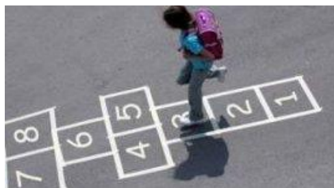
Slika 3. Školica

Provođenjem različitih prirodnih oblika kretanja savladavanja prostora i prepreka na vrlo jednostavan način može se razviti koordinaciju nogu kod djece. Započeti se može raznovrsnim jednostavnim načinima hodanja, poskoka, skokova, ... i sl. kombinacijom različitih koraka, promjenom smjera, brzine kretanja, ... i sl.. Školica je samo jedan od primjera kako kroz igru koju djeca vole (Slika 3.) na jednostavan način izvođenjem jednonožnih poskoka, raskoračnih, sunožnih skokova može razvijati koordinacija nogu.