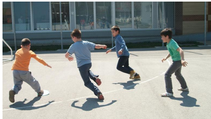
Slika 8. Lovce

Agilnost je sposobnost brze promjena smjera kretanja. Djeca ovu sposobnost razvijaju od malih nogu igrajući se lovce ( Slika 8 ), igru u kojoj bježeći od lovca često mijenjaju smjer kretanja. Da je agilnost dobro razvijena dijete nakon promjene smjera kretanja, može izvesti najveće ubrzanje u tom, željenom smjeru.