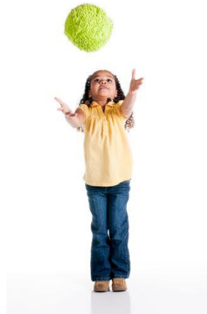
Slika 2. bacanje lopte s dvije ruke

Djeca mlađe školske dobi susreću se s različitim rekvizitima i predmetima. Kako bi se njima mogli koristiti te izvoditi različite elemente, potrebno je usvojiti baratanje raznovrsnim predmetima (lopte, obruča, vijače, čunjeva, ... i sl.) rukama. Bacanjem i hvatanjem rekvizita u pojedinim zadacima (npr. bacanje lopte u zrak (Slika 2), bacanje manje lopte, bacanje istovremeno dvije lopte i sl. djeca će usvajanjem sve složenijih zadataka razvijati koordinaciju ruku.