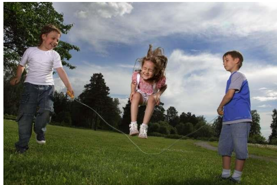
Slika 9. Preskakivanje vijače

Praćenje ritma se također definira kao vrsta koordinacije. Samo kretanje u zadanom ili proizvoljnom ritmu pokazuje kolika im je ritmičnost. Način razvoja ove vrste koordinacije vrlo je zanimljiv jer djeca općenito vole glazbu i izvođenje zadataka u različitom ritmu, što ih dodatno veseli i motivira. Razvoj ove sposobnosti moguće je npr. preskocima vijače ( Slika 9 ), gdje se za pravilno preskakanje moraju uvježbati ritam skoka i brzinu kretanja vijače kako ne bi uranili ili zakasnili na sljedeći preskok.