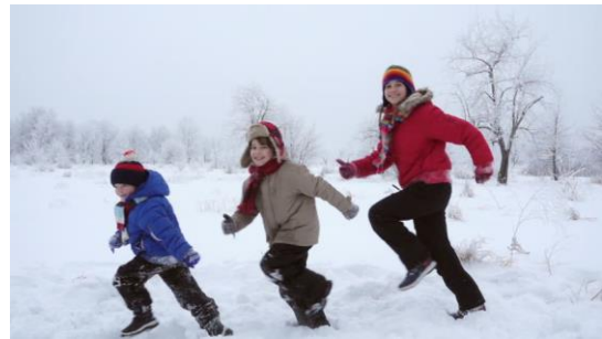
Slika 7. Trčanje na snijegu