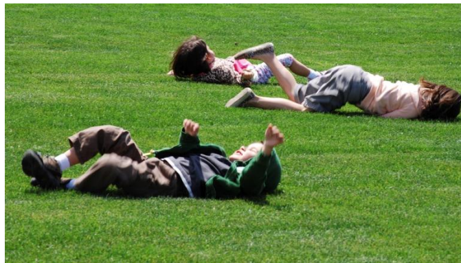
Slika 4. Kotrljanje

Naše se tijelo u svakodnevnom životu kreće kroz prostor, na različite način. Iako prevladavaju varijante hodanja i trčanja, u raznovrsnim se kineziološkim aktivnostima i sportovima izvode i različite vrste valjanja, kotrljanja ( Slika 4 ), kolutanja, puzanja, kretanja četveronoške, različitim uporima, smjerom kretanja, brzinom, ... i sl. za što je nužna koordinacija cijelog tijela koja označava sposobnost realizacije izvedbe zadanog elementa premještanjem tijela u prostoru.