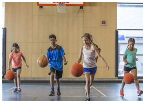
Slika 10. Vođenje lopte

Različita složena gibanja sastoje se od jedne ili više povezanih struktura gibanja. Kako bi se što bolje izveo kompleksan motorički zadatak, potrebna je optimalna brzina izvedbe istog. Ova vrsta koordinacije je specifična kod skokova, bacanja, vođenja lopte, ... i sl.. ( Slika 10 ).