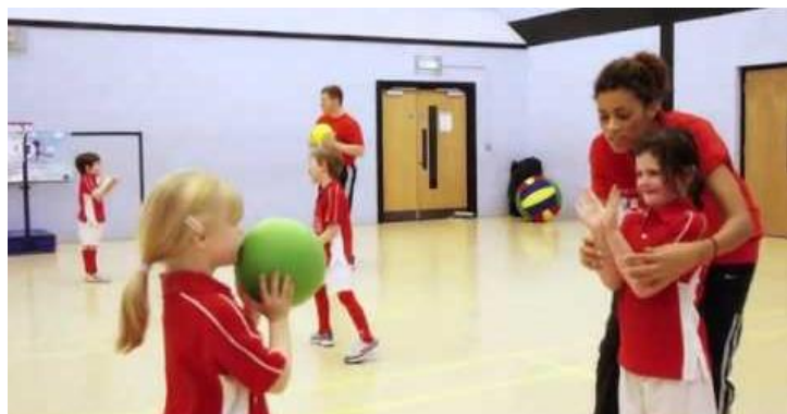
Slika 5. Dodavanje i hvatanje lopte

Ova sposobnost izuzetno je dominantna kod faze učenja, usvajanja novih motoričkih zadataka, elemenata. O njoj ovisi koliko će pojedinom djetetu trebati vremena, kolikim brojem pokušaja će usvojiti novi motorički zadatak. Uvijek se kreće sa savladavanjem jednostavnijih prirodne oblike kretanja, prema složenijim. Postupnost pri učenju će ubrzati i olakšati savladavanje novih zadataka. Bacanje, hvatanje i dodavanje lopte dobar su primjer ( Slika 5 ), jer nakon što dijete nauči hvatati, preciznije baciti može se započeti sa zadacima dodavanja.