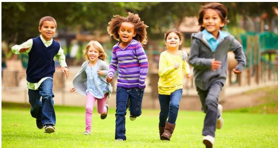
Slika 6. Trčanje na travi

Za razvoj ove vrste koordinacije, za efikasno iskorištavanje i prilagođavanje već postojećih motoričkih programa, potrebno je mijenjati: smjer kretanja, brzinu kretanja, amplitudu, tehniku i sl., prilagođavajući se novim zahtjevima. Npr. trčanje kao kretnja iz grupacije svladavanja prostora, promjenom podloge kao npr. nakon što su djeca savladala trčati po travi ( Slika 6 ), kada padne veliki snijeg, tehniku moraju reorganizirati na način da naglašavaju korake visokim podizanjem koljena, promijene duljinu koraka, ... i sl. ( Slika 7 ).