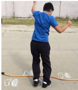
Slika 11. Sunožni skokovi naprijed-unatrag

U ovakvim vrstama pokreta u startu treba uključiti mišiće agoniste koji pomiču određeni dio tijela u odgovarajućem smjeru. Istovremeno treba isključiti antagoniste koji pokreću dio tijela u suprotnom smjeru. Nakon toga treba uključiti mišiće koji zaustavljaju dio tijela i pokrenuti u suprotnom smjeru ( Sekulić i Metikoša, 2007 ). Brzina frekvencije pokreta se razvija kod npr. sunožnih skokova naprijed-unatrag ( Slika 11. ), brzim koracima u mjestu, kretanju, ... i sl. uz sve veću brzinu izvođenja.