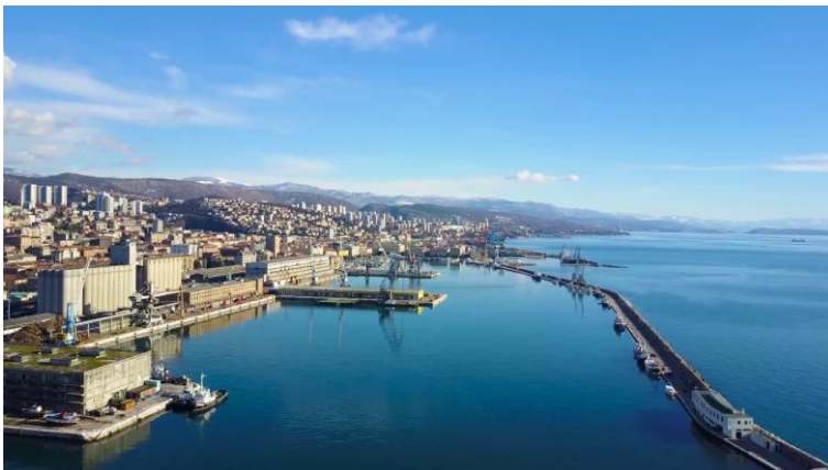
Slika 7: Lukobran Molo Longo

Postojeći lukobran glavnog lučkog bazena popularno zovu „molo longo“, zbog njegovih 1707 m dužine, a danas je u funkciji putničkog terminala i obalne šetnice koja je idealna za trening trčanja uz more i brodove.