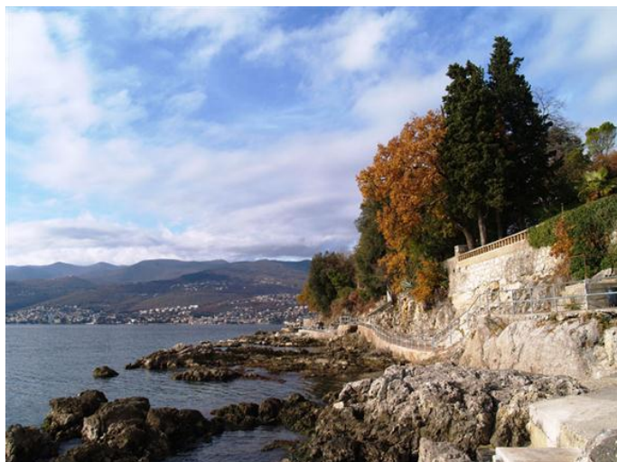
Slika 8: Dio šetnice na potezu Kantrida-Bivio

Markirana pješačko-izletnička staza " Šetnica uz Rječinu " od Trsata do izvora Rječine, omiljeno je odredište rekreativnih trkača. Najznačajniji fenomen ove krške rijeke su jako vrelo, duboko usječen kanjon, slapovi i brzaci, a prostor kanjona Rječine godine 1985. proglašen je zaštićenim objektom prirode.