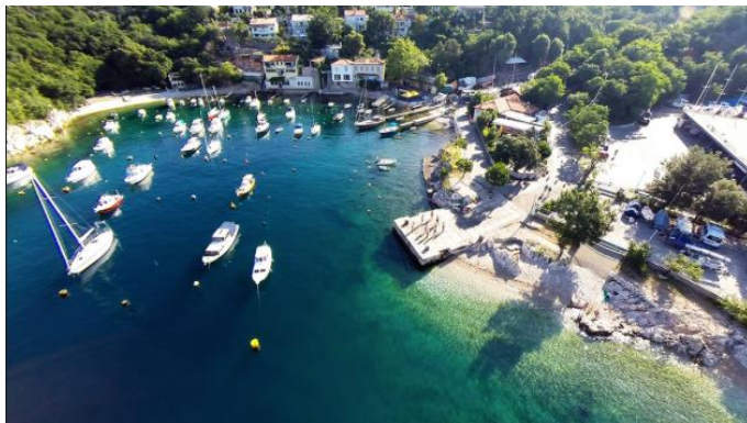
Slika 11: Kostrena

Kostrena se nalazi svega par minuta vožnje od centra Rijeke. Kostrenska šetnica duljine 3 km jednoga smjera slovi za jednu od najljepših uz more upravo zbog prekrasnih plaža i sunca koje se zimi jako dugo zadržava što je čini idealnom destinacijom za trening triatlonaca i rekreativnih trkača. U zaleđu mjesta postoje šetnice i uređena trim staza duž koje se može također rekreirati i uživati u pogledu.