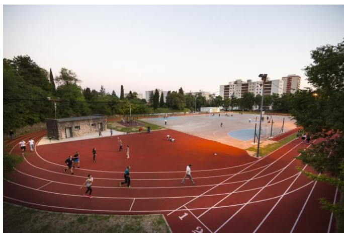
Slika 4 : Otvoreno igralište Kampus

Otvoreno igralište Kampus nalazi se na Trsatu i uređeno je 2015. godine. Radovi su obuhvaćali postavljanje nove podloge. Na postojeću atletsku stazu postavljena je nova podloga, tartan, uređen je poligon za bacanje kugle, izgrađeni su poligoni za skok u vis i skok u dalj, preuređen je postojeći objekt u spremište opreme, odnosno za priručni fitness te je smješteno 6 kontejnera za potrebe kancelarija i garderoba za korisnike 12 . Atletska staza je duljine 291 m, te je također vrlo pogodna za izvođenje specifičnih treninga brzine, dionica i brzinske izdržljivosti kao operatora za triatlonski trening.