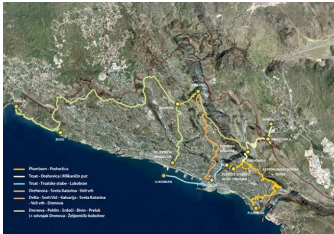
Slika 6: Prsten Riječkih šetnica

Postojeći lukobran glavnog lučkog bazena popularno zovu „molo longo“, zbog njegovih 1707 m dužine, a danas je u funkciji putničkog terminala i obalne šetnice koja je idealna za trening trčanja uz more i brodove.