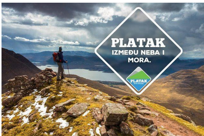
Slika 13: Platak

Na skijalištu Platak može se uživati na sljedećim skijaškim stazama: Radeševo 1, Radeševo 2, Turistička staza, Zavoj 19, Tešnje, Pribeniš 1, te baby staza uz koju ide pokretna traka dužine 200 m, a u podnožju Radeševa je pokretna traka dužine 160 m uz koju se može skijati i sanjkati. Za ljubitelje sanjkanja uređeno je sanjkalište uz Veliki Dom gdje je i pokretna traka dužine 80 m.