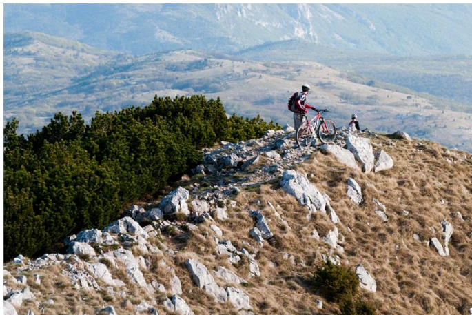
Slika 12: Pogled sa vrha Učke

Platak je malo, obiteljsko skijalište u neposrednoj blizini Rijeke s brojnim mogućnostima za rekreaciju, kako zimi tako i ljeti. Vjerojatno jedino skijalište u našoj blizini gdje s vrha žičare (1.363 m) možete uživati u pogledu na more. Osim zimi, Platak je vrlo popularan i ljeti posebice za duža trčanja rekreativnih trkača ili triatlonaca kada su temperature mnogo niže nego li u gradu što ga čini vrlo primaljivim odredištem za vikend trening . Kada u proljeće zazelene brda iznad Grobnišćine, a tople sunčane zrake izmame prve leptire na livade dođe vrijeme i za brojne zaljubljenike u planine koji sa Platka kreću put vrhova Snježnika i Risnjaka udaljenih na samo nekoliko sati hoda uređenim i obilježenim paninarskim stazama s prekrasnim vidikovcima. Treba napomenuti da je van sezone za svakoga triatlonca, bilo rekreativnog ili profesionalnog poželjno mijenjati primarne sportove (plivanje, tračanje i cestovni biciklizam) i zamjeniti ih brdskim