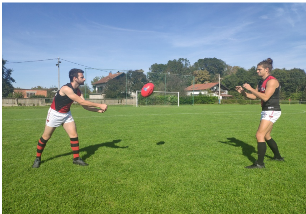
Slika 7. Dodavanje rukom u paru