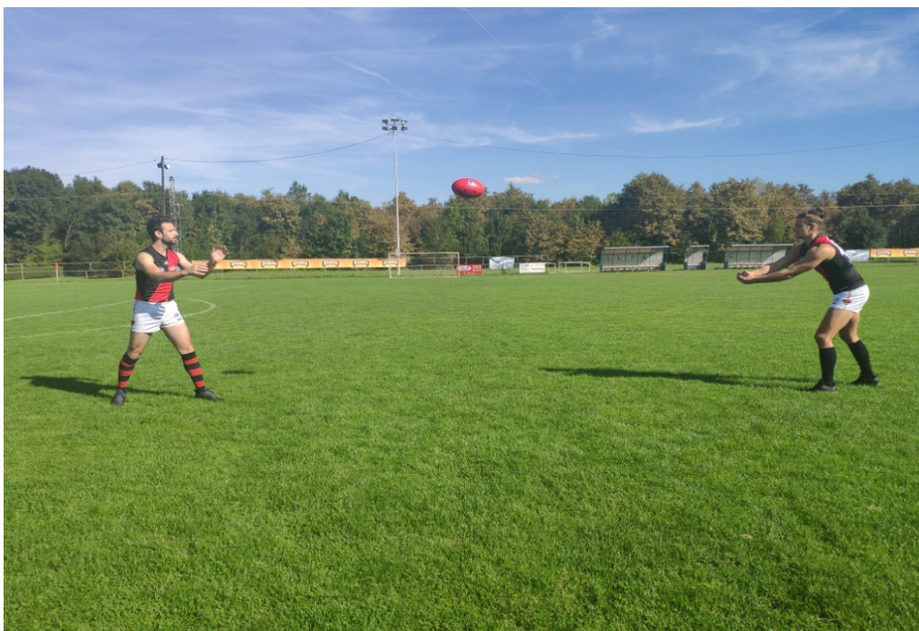
Slika 8. Dodavanje rukom u paru (udaljeno)

Vježbači stoje na udaljenosti od pet do sedam metara te izvode osnovno dodavanje na način kao što je opisano u predhodnoj vježbi (Slika 8).