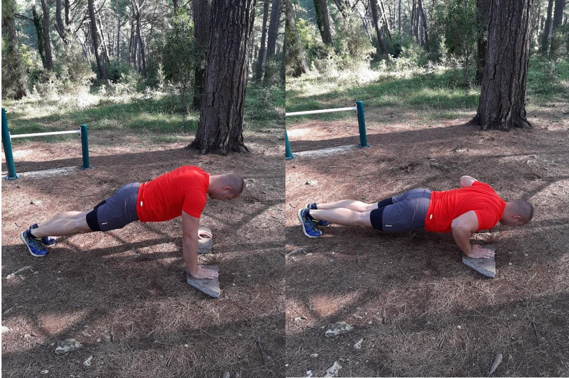
Slika 2: Regularni (široki) sklekov