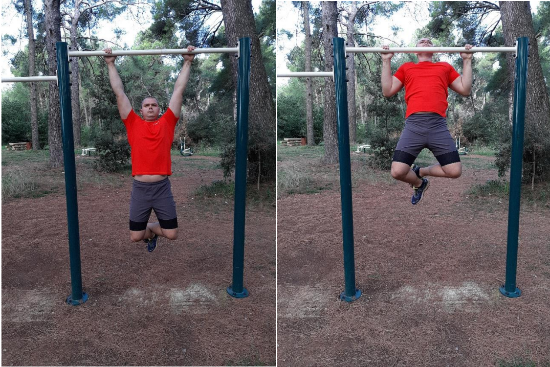
Slika 5: Zgibovi (Pull Ups)