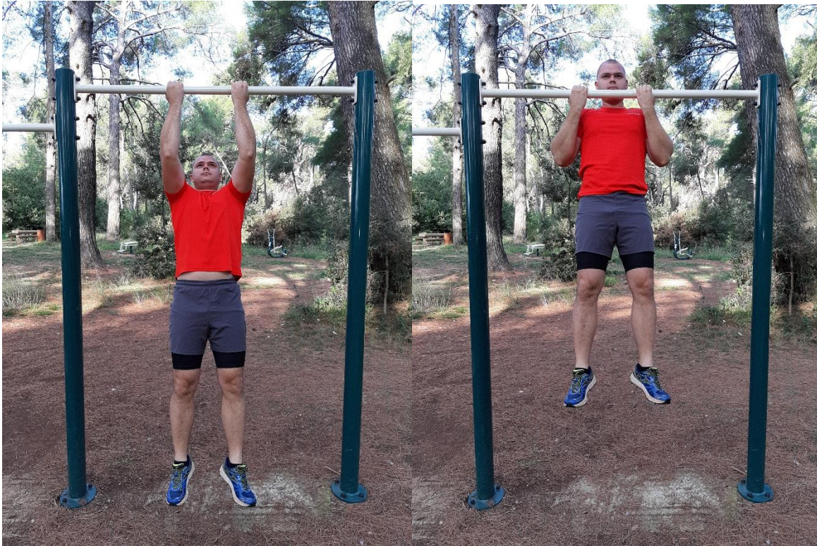
Slika 6: Kontra Zgibovi (Chin Ups)