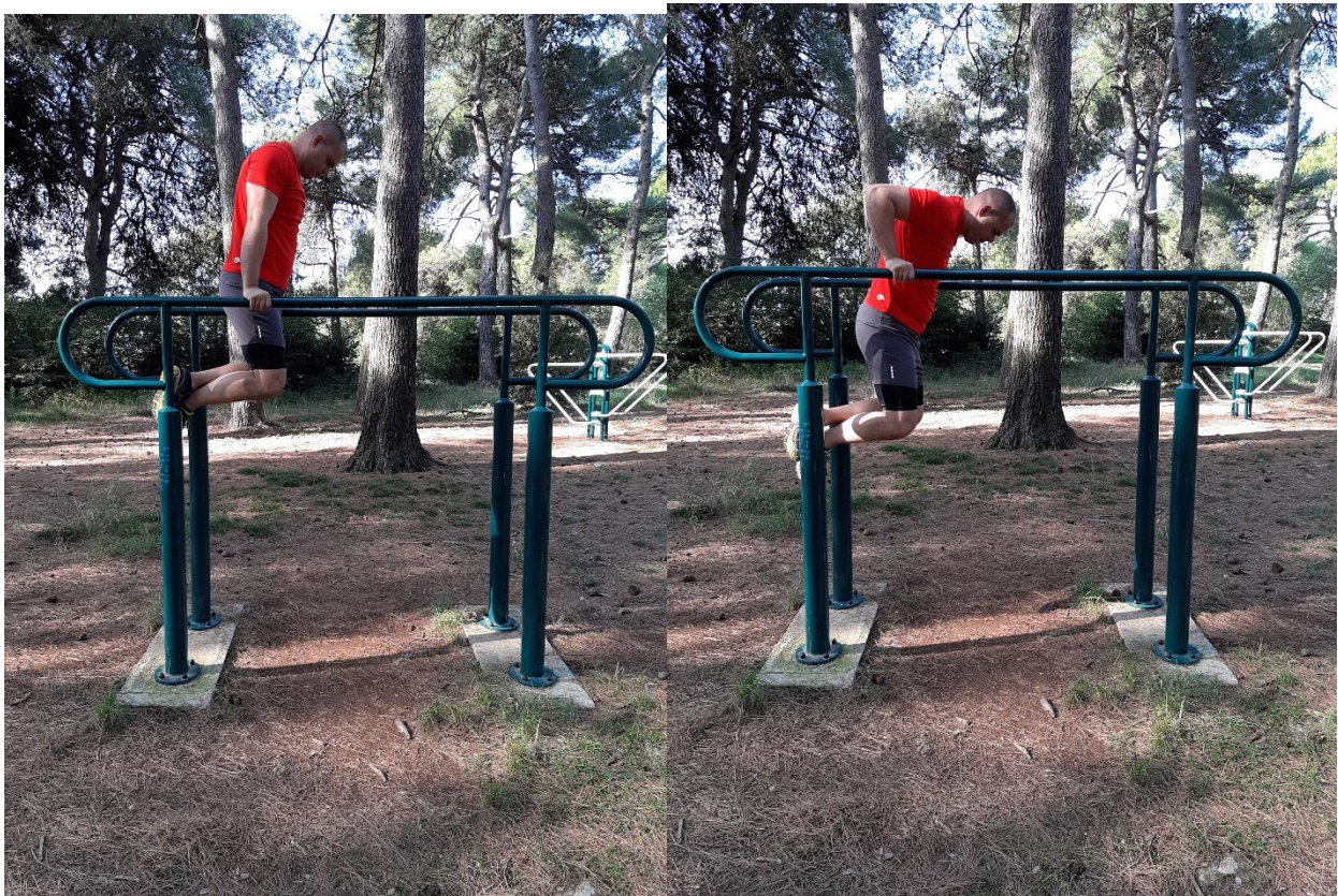
Slika 4: Propadanja (Dipsevi) na gimnastičkom vratilu

U svakom obliku vježbanja može se povećati trenažno opterećenje na razne načine. U treninzima s vanjskim opterećenjem ili s vlastitom masom, takvi se postupci najčešće nazivaju metodama intenziviranja treninga, a provode se da bi se ostvarilo potpunije i brže napredovanje vježbača. U metodama serija ili set metodama trenažno opterećenje se povećava, a istodobno se izbjegava eventualno zasićenje vježbača jednoličnim programom treninga. U navedenim metodama treninga koje ćemo prikazati u nastavku uglavnom su primjenjivane na najširem uzorku sportaša, od početnika i rekreativaca pa do natjecatelja.