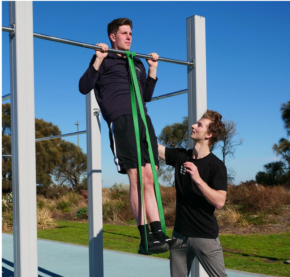
Slika 15: Zgibovi uz asistenciju za početnike (Street workout St. Kilda, bez dat.)

Prvi stupanj progresije uključuje vježbe (najčešće se izvode na podu) putem kojih se ciljano jačaju oni mišići koji će biti potrebni pri izvođenju zahtjevnijih vježbi. Te vježbe su sklekovi i njegove varijacije (sklek s koljena, varijacija širine ruku, sklek na jednoj ruci, sklek sa skokom...), zatim vježbe za trbuh (crunch, plank, sklopke, podizanje nogu...), vježbe za leđa (leđnjaci i njegove varijacije, mostovi...), te vježbe za noge (čučnjevi, iskoraci, skokovi...).