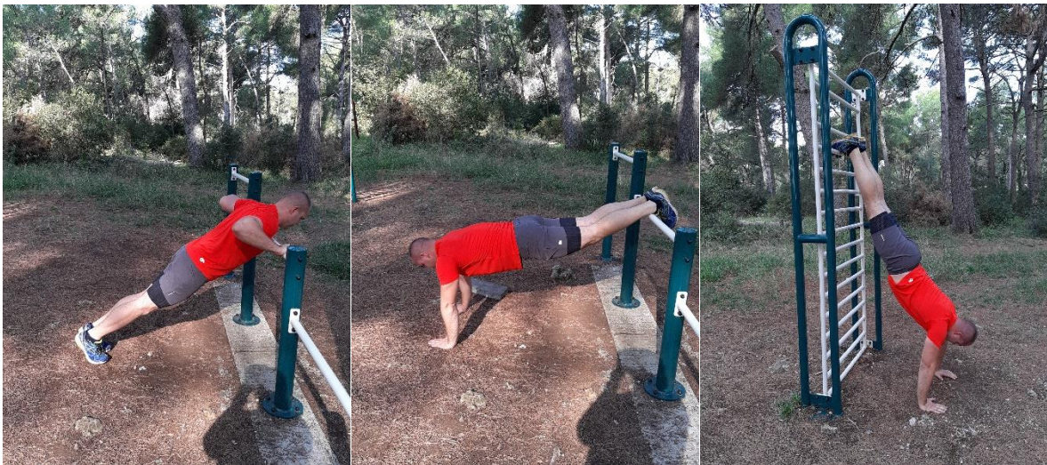
Slika 7: Varijacije Sklekova (Incline / Decline / Handstand Pushups)