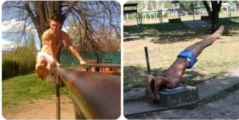
Slika 16: L-sit i Dragon Flag na podu ( vlastita arhiva )