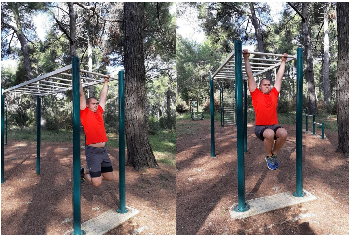
Slika 12: Podizanje nogu na Monkey Bar-u