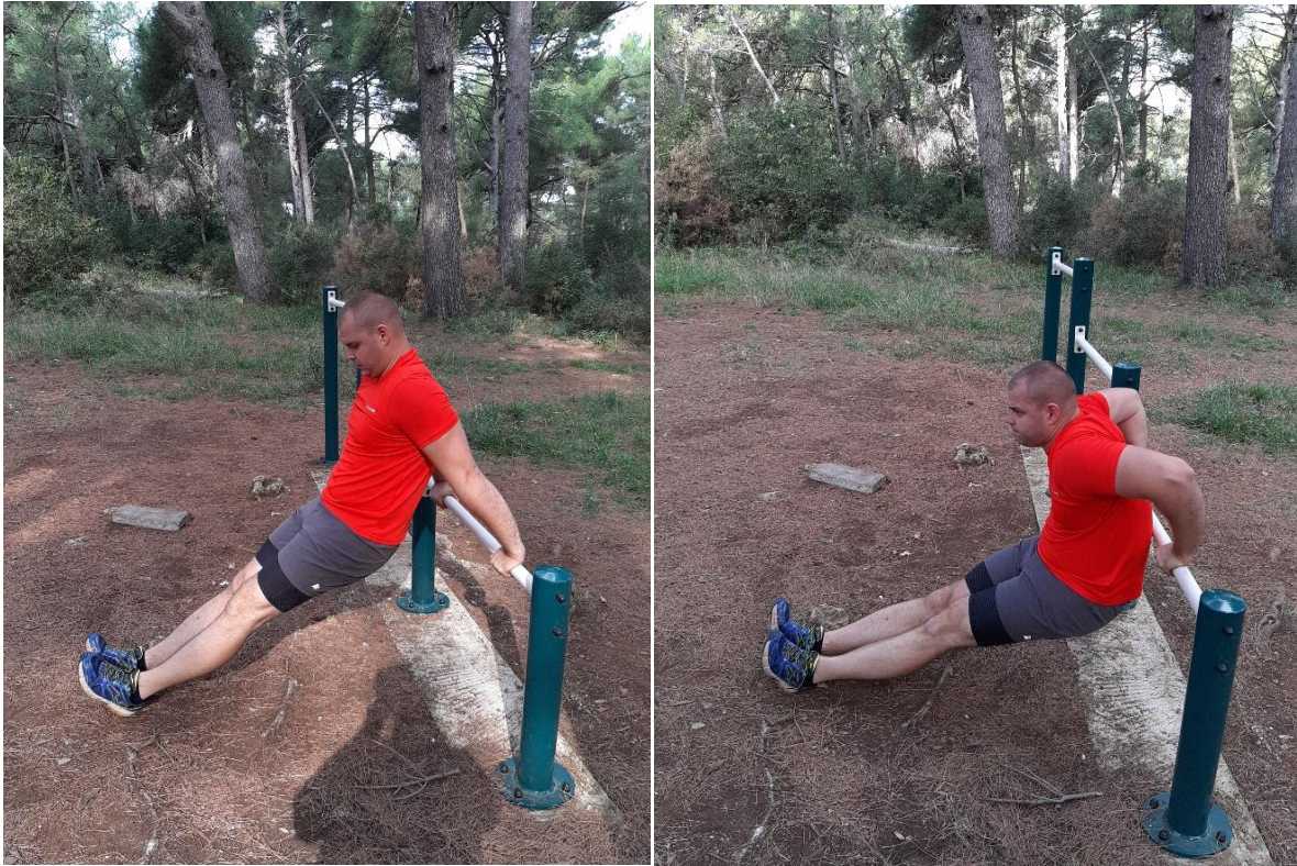
Slika 8: Propadanja za triceps na klupici ili šipki