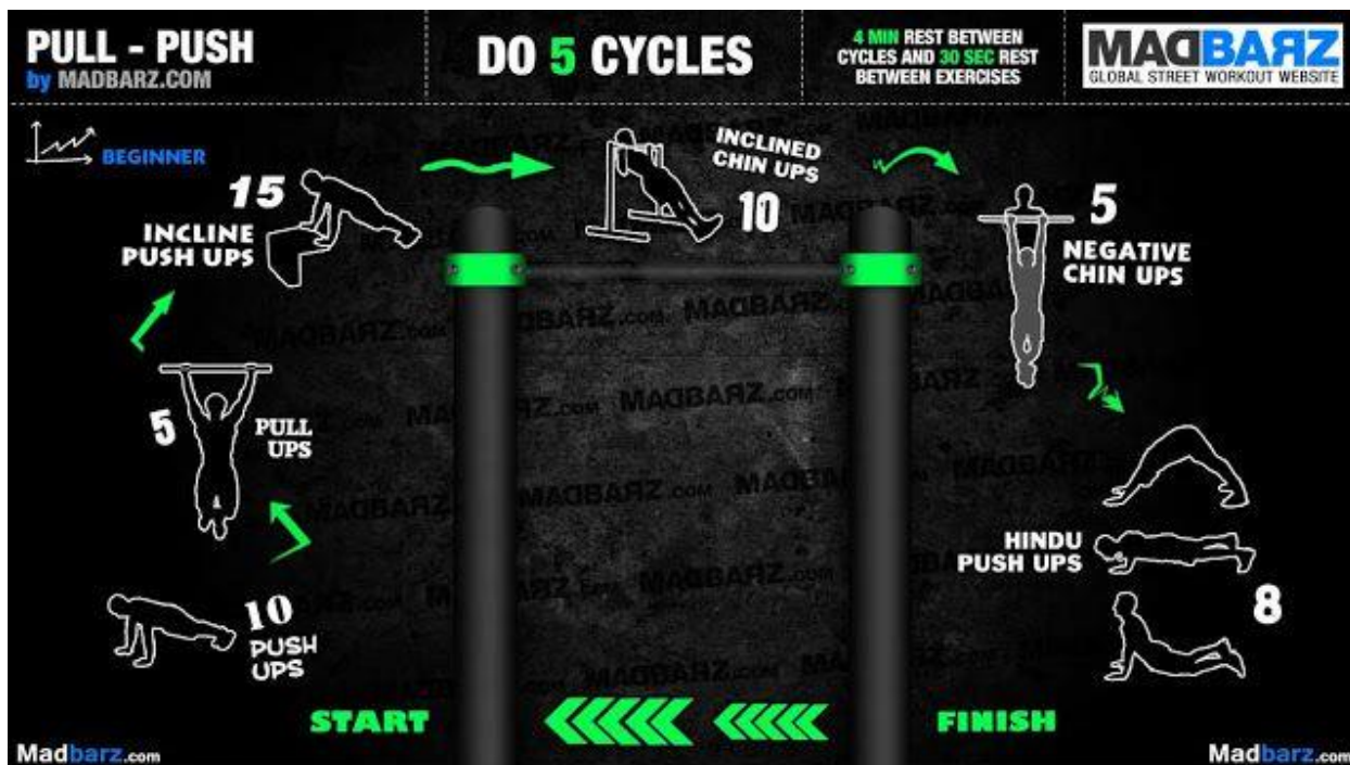
Slika 11: Primjer Kružnog treninga (Pinterest bez dat.) (Pauze između vježbi u trajanju od 35-40 s osiguravaju utjecaj ovakvog tipa treninga ne samo na mišićni, nego i na srčano žilni sustav sportaša. U pauzi se raden vježbe istezanja i vježbe opuštanja, jer time osiguravaju odgovarajuću pripremu za radnu aktivnost).

Trening kružnog tipa obično se sastoji od 6 do 12 radnih stanica koje se izvode jedna za drugom gdje dužina odmora između vježbi varira te zajedno čine jedan krug. Na svakoj radnoj stanici radi se samo jedna serija i svaka stanica u principu pokriva drugu topološku regiju tijela. Trajanje radnih intervala u stanici je određeno vremenski ili brojem ponavljanja dok radni interval odmora između radnih stanica varira zavisno od cilja koji se time želi postići (obično 15-30 sekundi). U ovoj metodi rada brze promjene i brzo izvođenje vježbi stvaraju vježbačevom tijelu specifičan stres koji se podosta razlikuje od uobičajenog, poznatog zamora kao kod staničnog rada, upravo zahvaljujući povećanim brojem otkucaja srca uslijed kraćih intervala odmora.