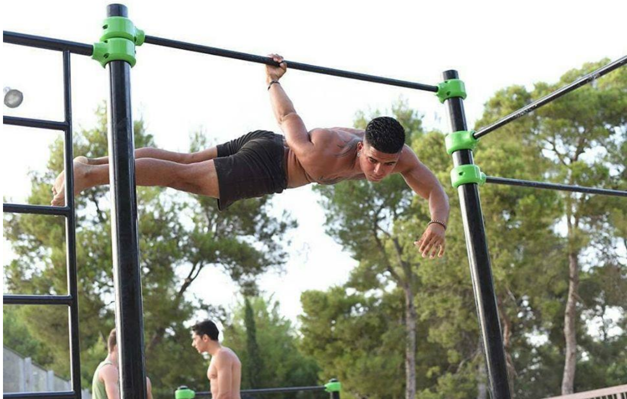
Slika 18: Back lever na jednoj ruci, close to impossible.