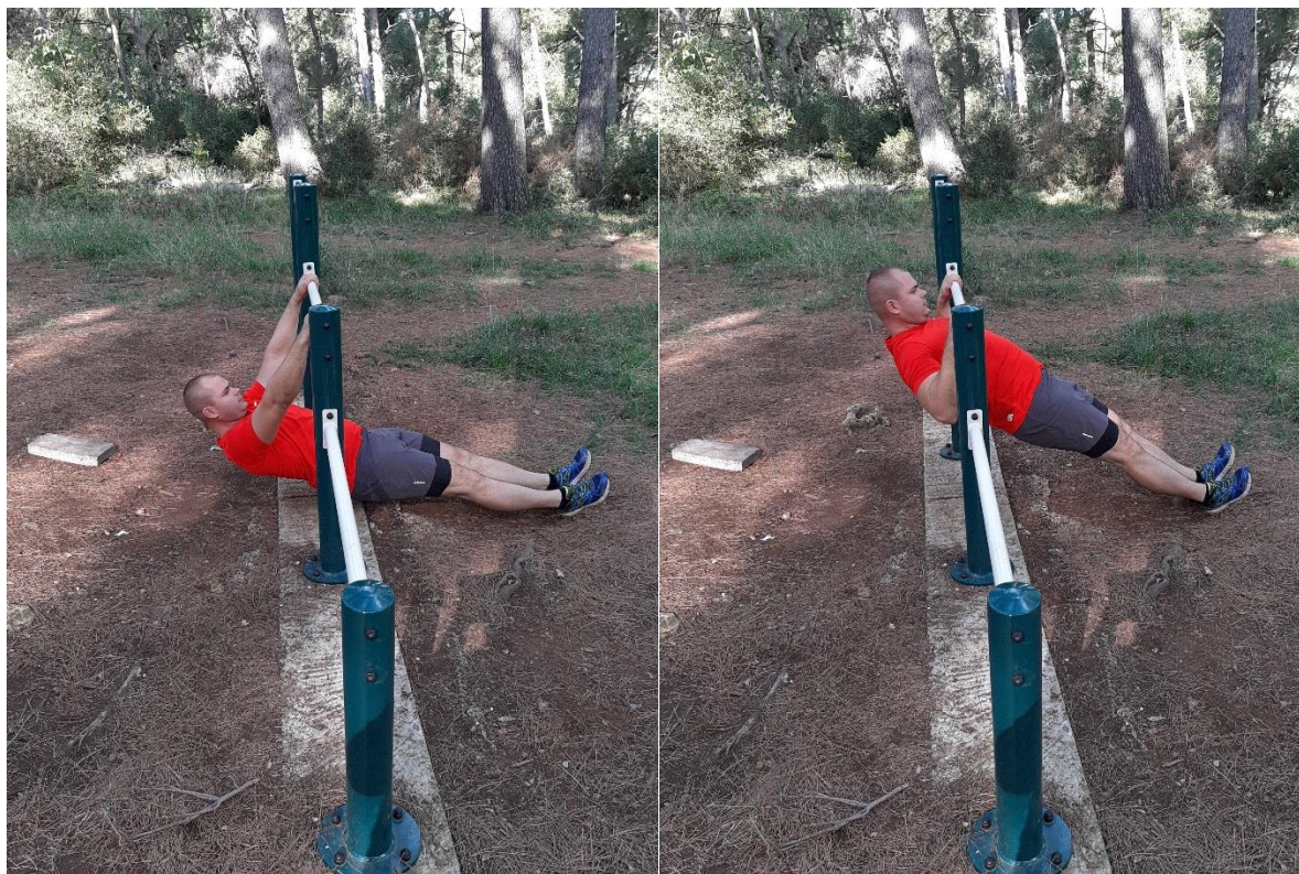
Slika 10: Australski zgibovi