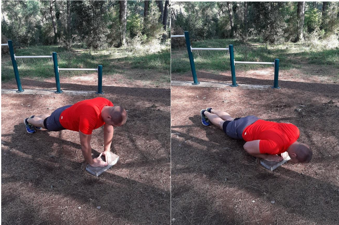
Slika 3: Uski (Dijamant) sklekov