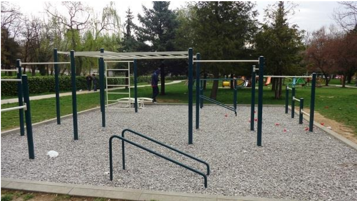
Slika 13: Street workout trening park