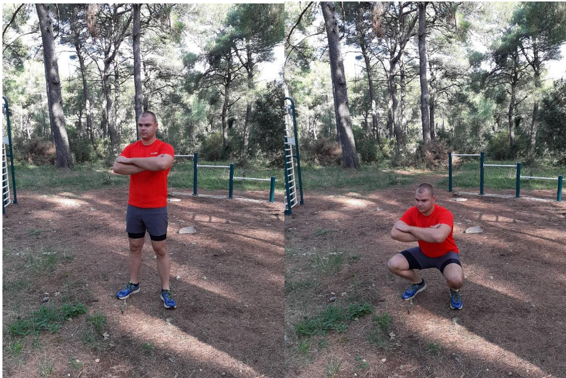
Slika 9: Čučnjevi