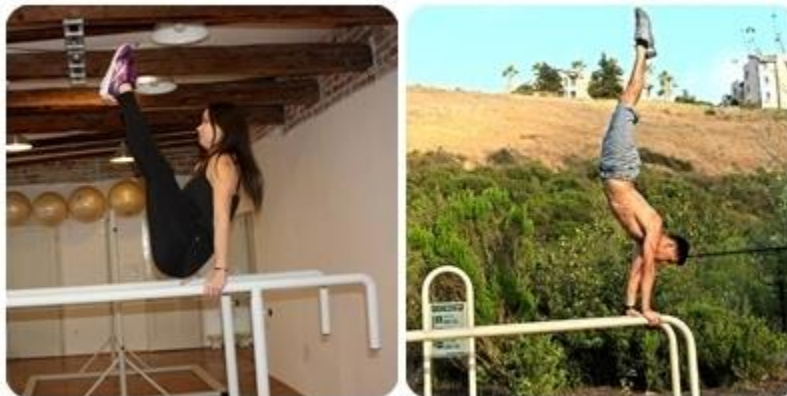
Slika 17: V sit, stoj na dip bar-u ( vlastita arhiva )