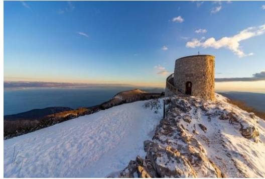
Slika 6. Vrh Vojak, Kvajo, K. 2018.

Učka. Jedni od takvih događaja su Outdoor dan Parka prirode Učka, maraton „Mama i beba“, Biciklijada za djecu i odrasle-Vojak, Offroad duathlon Učka.