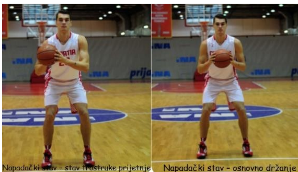
Slika 3. Prikaz napadačkih stavova u košarci (Matković, B., Knjaz, D., & Rupčić, T., 2014)

Kod napadačkog stava s loptom stopala su paralelna, razmaknuta za širinu ramena, a težina je ravnomjerno raspoređena na prednjem dijelu stopala. Kut između natkoljenice i potkoljenice iznosi približno 120^\circ . Koljena su savijena, leđa ravna, ruke se nalaze iznad kukova, savijenih laktova i blizu tijela. Lopta se drži čvrsto s dvije ruke u visini grudi, palčevi su usmjereni prema vrhu lopte, a podlaktice su gotovo u paralelnom položaju s podlogom. Trup se nalazi u blagom pretklonu, a glava se nalazi iznad centra težišta tijela s pogledom na obruč i loptu. Stav mora biti stabilan iz kojeg je moguće brzo krenuti, promijeniti smjer te kontrolirano se zaustaviti i skakati. Kod svih napadačkih stavova naglasak je na ravnoteži kako bi pokreti mogli biti pravilni i kontrolirani. Slika 3. prikazuje razliku između napadačkih stavova u košarci.