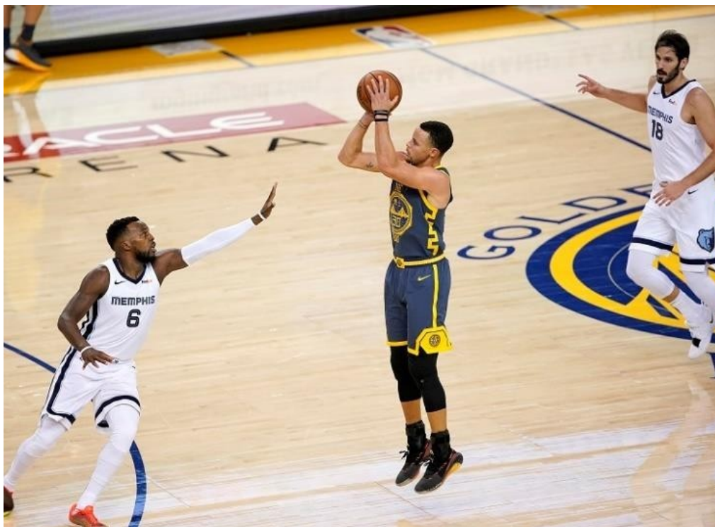
Slika 9. Skok šut u igri