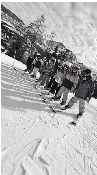
Slika 8. Učitelj skijanja zbog sigurnosti procesa učenja alpskoga skijanja često prebrojava i nadgleda djecu.