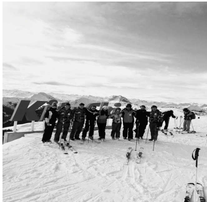
Slika 12. Učitelji skijanja tijekom programa praktične nastave za potvrđivanje skijaške licence.

Kroz praktičnu nastavu usavršavaju se osnovni, napredni i natjecateljski skijaški elementi te se demonstriraju i opisuju metodičke vježbe za poduku istih. Tako se prikazuju vježbe kojima će se podučavati elementi pluzne i paralelne skijaške tehnike osnovne škole skijanja te elementi paralelne skijaške tehnike napredne škole skijanja s varijantama skijanja po uređenim i neuređenim stazama. Podukom programa natjecateljske škole skijanja učitelji dobivaju kompetencije za pravilan opis i demonstraciju slalom i veleslalom skijaških tehnika (Hrvatski institut za kineziologiju, 2017).