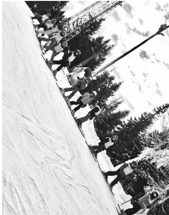
Slika 5. Polaznici škole alpskoga skijanja u postavi kolone.

procesa uvježbavanja. Taj proces podrazumijeva ponavljanje određenog elementa tehnike u različitim oblicima te u različitim uvjetima na stazi. S obzirom na broj pravilnih ponavljanja nekog elementa tehnike moguće je očekivati određenu razinu usvojenog znanja. Najčešći oblici metode uvježbavanja, koji se koriste kod sportova na snijegu, su metoda varijabilnog uvježbavanja te situacijska metoda (Cigrovski, 2007; Neljak, 2013). Kod metode varijabilnog uvježbavanja elementi tehnike izvode se u različitom tempu, ritmu i duljini trajanja samog zadatka dok situacijska metoda uvježbavanja podrazumijeva da se elementi tehnike nekog sporta na snijegu čine u cijelosti i u uvjetima u kojima se oni inače izvode. Obje metode uvježbavanja pokazale su se u praksi kao najučinkovitije za alpsko skijanje kao jednog od sportova na snijegu (Cigrovski i sur., 2019; Neljak, 2013).