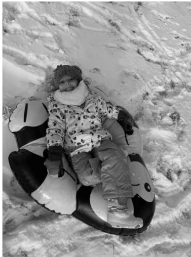
Slika 9. Igre na snijegu.

Nakon završetka programa igara na snijegu učitelj ističe marljive i uspješne skijaše te se pozdravljaju dogovorenim skijaškim pozdravom.