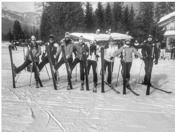
Slika 11. Studenti Kineziološkog fakulteta na praktičnoj nastavi iz predmeta Skijanje.