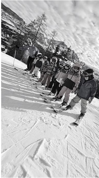
Slika 8. Učitelj skijanja zbog sigurnosti procesa učenja alpskoga skijanja često prebrojava i nadgleda djecu.