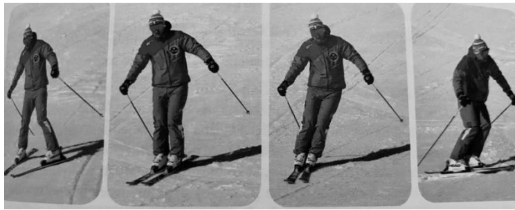
Slika 4. Paralelna skijaška tehnika. Izvor: Cigrovski, V. i sur.(2019). Sportovi na snijegu.