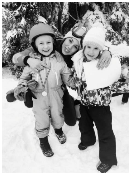
Slika 10. Dodjela medalja i diploma.

Tijekom posljednjeg dana škole skijanja u prvom, jutarnjem dijelu programa ponavljat će se sadržaji i metodičke vježbe koje su djeca izvodila prethodnih dana. Na blagoj padini izvodit će metodičke vježbe podučavanja plužnog zavoja, zavoja k brijegu i osnovnog zavoja: