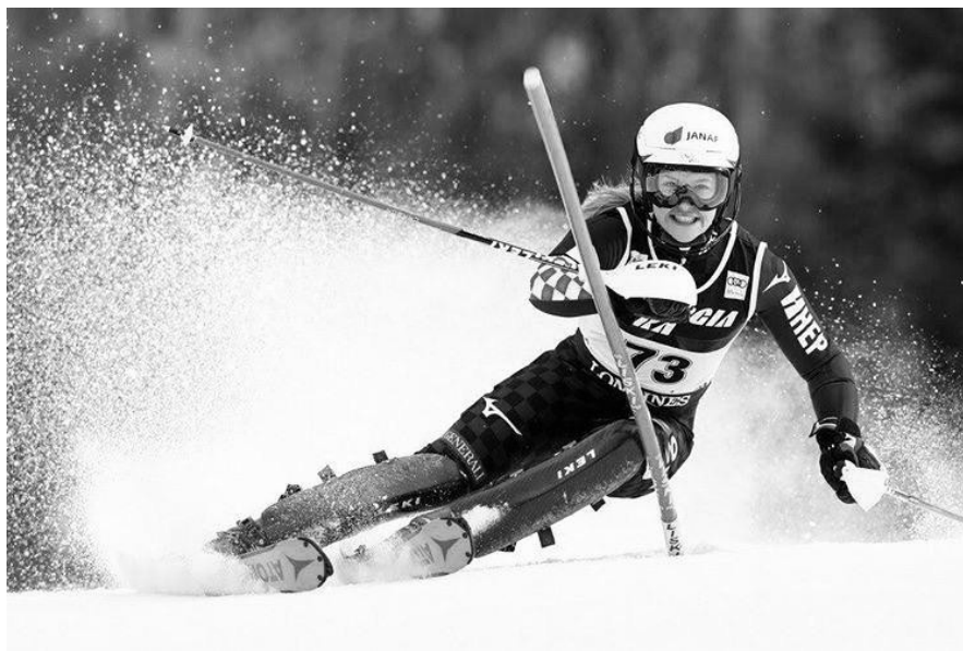
Slika 2. Hrvatska skijašica na slalomskoj utrci Snježne kraljice.

Franjo Bučar zaslužan je za pojavu i propagiranje alpskoga skijanja na našim prostorima. Tijekom studija u Stockholmu upoznao se s pojedinim skijaškim tehnikama te nakon povratka u Zagreb organizirao prvi tečaj za učitelje gimnastike u čiji je program uvrstio i alpsko skijanje. Početkom 20. stoljeća dolazi do popularizacije alpskoga skijanja u Europi. U Alpama se pojavljuju brojni skijaški centri, a u Hrvatskoj svi zaljubljenici u ovaj sport vrijeme provode na Medvednici i Samoborskom gorju (Matković i sur., 2004). Hrvatski skijaški savez osnovan je 26. listopada 1939. godine u prostorijama Jugoslavenskog olimpijskog odbora (Modrić, 2009). Od samog početka savez je imao brojno članstvo skijaša koji su skijali pri određenim udrugama na prostorima bivše Jugoslavije. Uspostavljanjem Republike Hrvatske 1991. godine Skijaški savez Hrvatske reorganiziran je, a 10. srpnja primljen je u članstvo Međunarodnog skijaškog saveza (FIS) (Modrić, 2009). Izuzetna angažiranost Hrvatskog skijaškog saveza omogućila je uvrštavanje Hrvatske u kalendar natjecanja Svjetskog kupa te se od 2005. godine do danas na zagrebačkom Sljemenju održavaju slalomske utrke pod nazivom Snježna kraljica (Matković i sur., 2004).