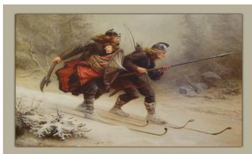
Slika 1. Prikaz norveških ratnika na skijama. Preuzeto sa:

Rijetko koji sport ima dugu i sveobuhvatnu povijest kao što ima alpsko skijanje. Kako je kroz povijest napredovao razvoj skija, skijaških cipela, skijaških vezova i tehničke opreme na stazama, usporedno se razvijalo i samo alpsko skijanje te skijaška tehnika (Modrić, 2009). Prva spominjanja i korištenja skija opisana su u Norveškoj i drugim skandinavskim zemljama gdje su se skije koristile u svrhu prijevoznog sredstva. U kamenom dobu, otprilike 4000 godina unazad, pronađeni su pećinski zapisi skija u sjevernoj Norveškoj (Matković i sur., 2004). Skijanje se u obliku sporta počinje razvijati znatno kasnije pa se tako prvo natjecanje održalo krajem 18. stoljeća u današnjem Oslu, glavnom gradu Norveške. Alpsko skijanje i skijaške tehnike razvijaju se i mijenjaju kroz povijest te dolazi do potrebe za obukom skijaša. Austrijanac Mathias Zdarsky davne 1906. godine okuplja polaznike, razvija sistematičnu obuku skijaša te ga mnogi zbog toga smatraju ocem alpskoga skijanja. Za vrijeme trajanja I. Zimskih olimpijskih igara u Chamonixu 1924. godine osnovan je Međunarodni skijaški savez (FIS) (Matković i sur., 2004).