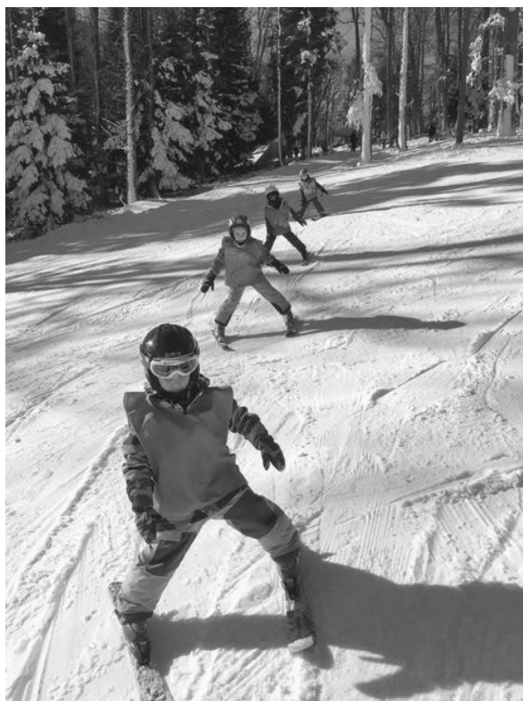
Slika 6. Škola alpskoga skijanja sa skijašima početnicima u skijaškom centru Sljeme.

U programu za rad škole skijanja razrađuju se pojedine stavke plana pa se tako njime određuju svakodnevne aktivnosti unutar samog programa za učenje skijanja. Program škole alpskoga skijanja definiran je i odobren od nadležnih institucija, a njime se mogu usvajati znanja kod skijaških početnika i usavršavati znanja kod naprednijih skijaša. Kada se sastavlja program škole alpskoga skijanja, odabire se jedan dio propisanog programa, a njegova količina ovisit će o više faktora: broj dana, trajanje u danu, dob polaznika, sposobnost, motivacija i predznanje. Većina škola alpskoga skijanja sa svojim polaznicima najprije uči elemente pluzne tehnike skijanja. Kroz učenje pluznog zavoja skijaš početnik izvodi specifična skijaška gibanja koja će mu kasnije biti neophodna u izvođenju kompleksnijih zavoja. Nakon toga usvajaju se elementi pluzne i paralelne skijaške tehnike, postupno se sve više prelazi na izvođenje zavoja korištenjem paralelne pozicije skija, a u zadnjoj fazi učenja polaznici koriste skijaške štapove (Cigrovski i sur., 2019).