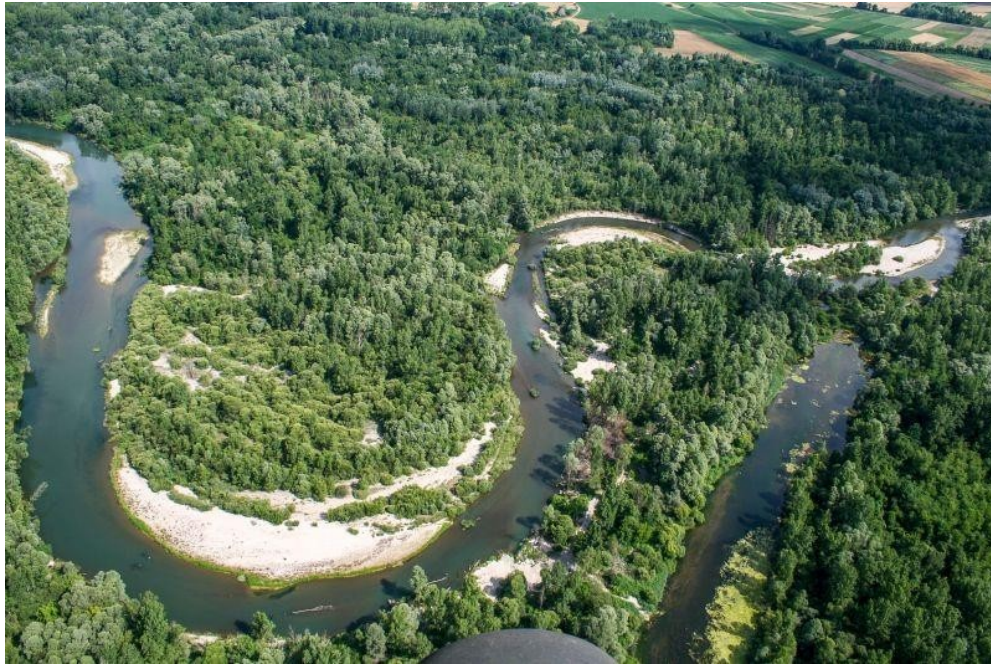
Slika 3. Rijeka Drava