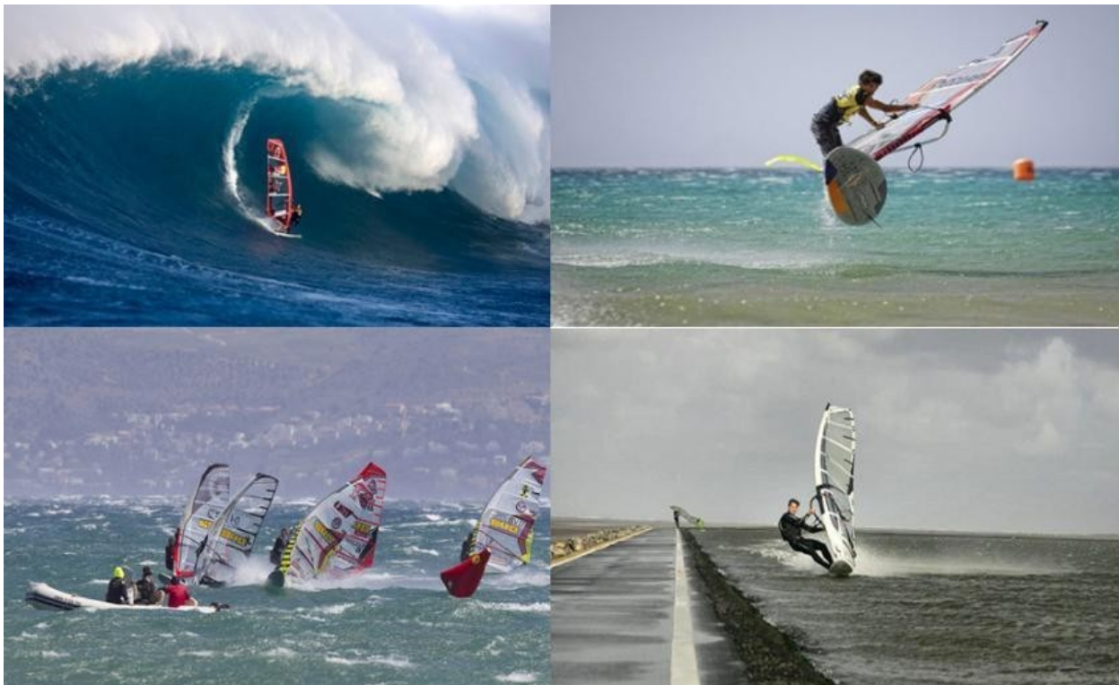
Slika 10. Discipline jedrenja na dasci (wave, freestyle, slalom i speed)

Slobodna vožnja (eng. Freeride) Je oblik jedrenja na dasci koji je uglavnom nenatjecateljskog karaktera. Slobodnom vožnjom većinom se bave rekreativci, te uključuje sve elemente; brzu vožnju po pravcu, okrete i trikove.