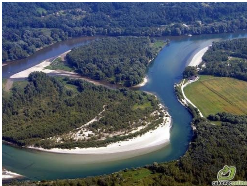
Slika 4. Rijeka Mura