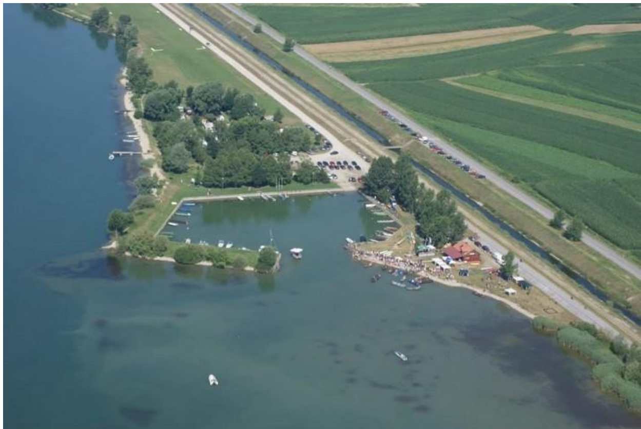
Slika 9. Marina Prelog

kompletnog prostora Sportsko-rekreacijske zone Prelog kao osnove za detaljno uređenje cjelokupnog prostora inundacije te paralelnog traženja 39 alternativnih izvora financiranja putem fondova ( http://www.marinaprelog.hr/o-nama.html ).