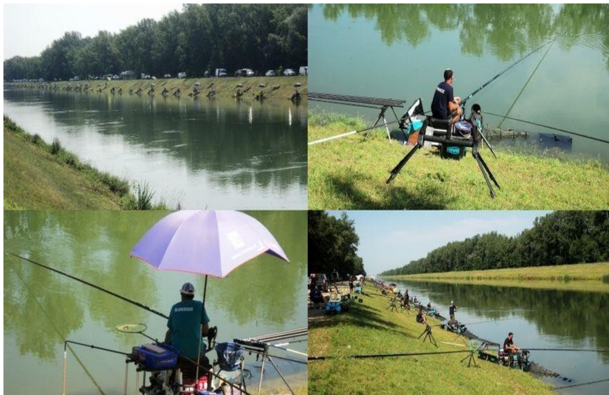
Slika 5. Svjetsko prvenstvo u ribolovu u Prelogu 2019. godine