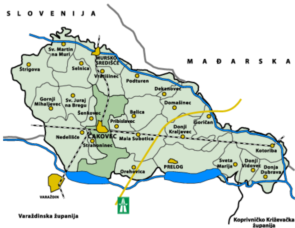
Slika 1. Geografski položaj Međimurske županije