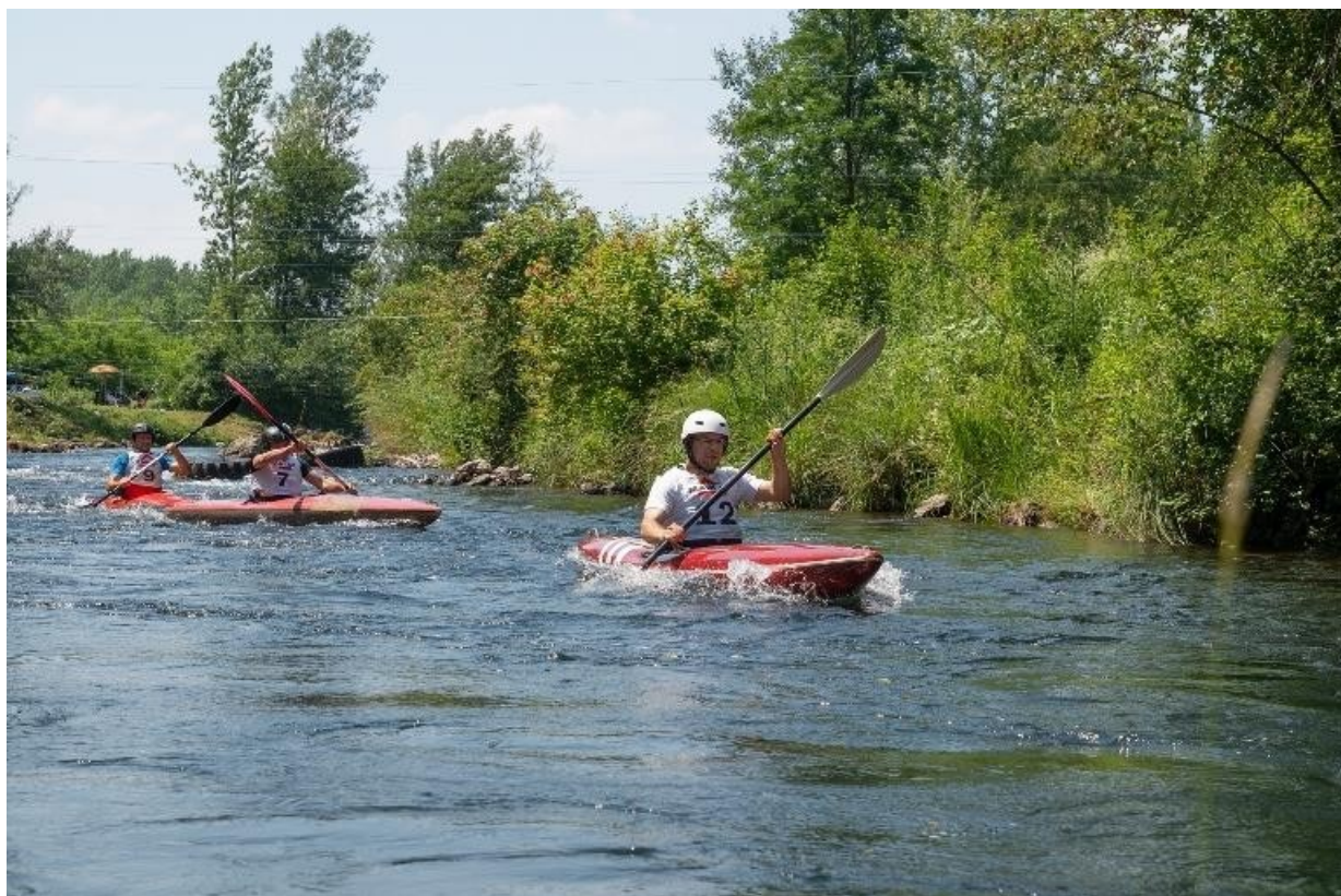
Slika 6. Kajak na Muri