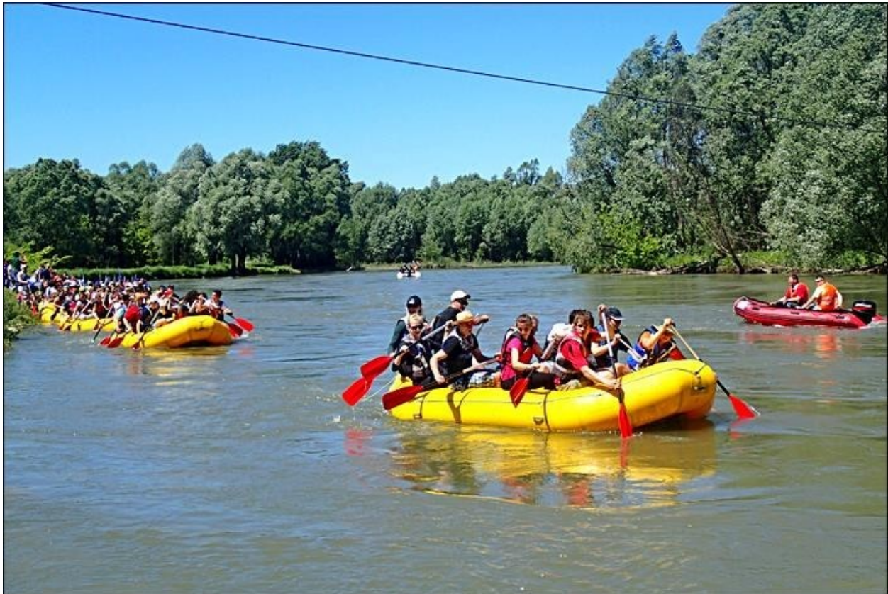
Slika 8. Rafting na rijeci Muri

Izvor: https://medjimurje.hr/sport/odrzan-rafting-kup-mura-7514/ , 13.08.2020