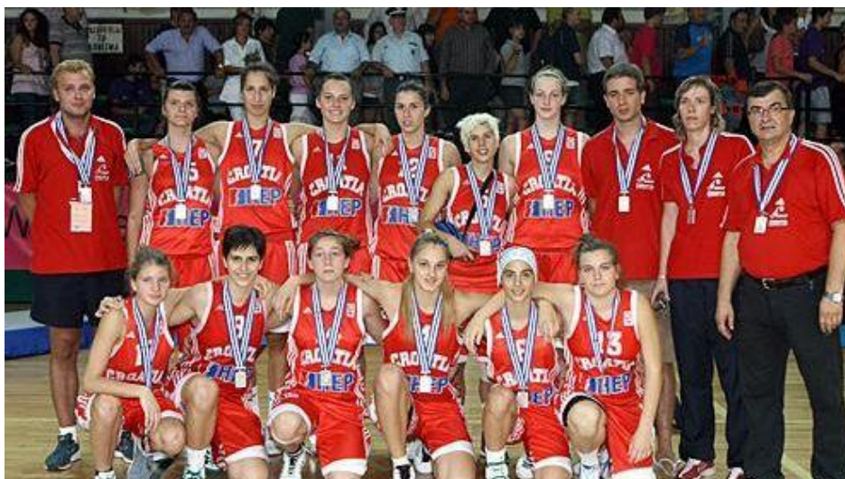
Slika 7. Hrvatska ženska kadetska reprezentacija na U16 Europskom prvenstvu u Grčkoj