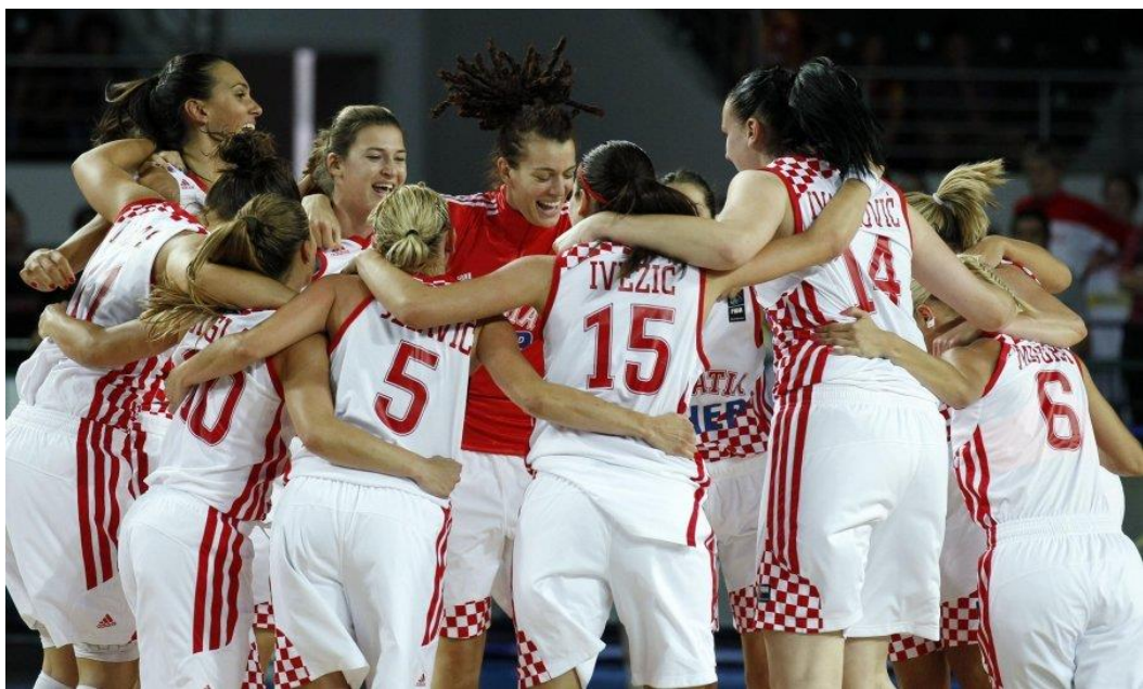
Slika 6. Hrvatska seniorska ženska košarkaška reprezentacija

Rezultati mlađih uzrasta sa osvojenih nekoliko medalja u B diviziji i dvije medalje u prvoj diviziji sa kadetkinjama prikazani su u tablici 2.