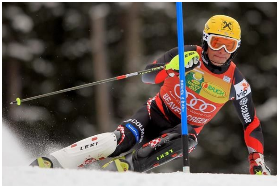
Slika 5. Prikaz natjecateljske opreme