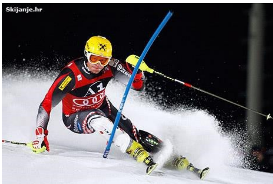
Slika 8. Natjecatelj u disciplini – slalom