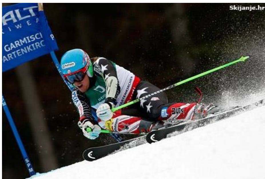
Slika 9. Natjecatelj u disciplini – veleslalom

U veleslalomu natjecatelj savladava kombinaciju kratkih, srednjih i dugih zavoja. Visinska razlika staze 250 - 450 metara za muškarce i 250 - 400 metara za žene. Vrata u veleslalomu naizmjenično su plava i crvena, a čine ih 4 slalomska štapa i dvije zastavice. Unutarnja dva štapa moraju biti zglobna. Širina pojedinih vrata je 4 m do 8 m, a razmak između susjednih vrata nije manji od 10 m. Zastave su širine 75 cm i visine 50 cm, donji rub udaljen je minimalno 1 m od površine terena. Skije za skijašice su 1,80 metara, a za skijaše 1,85 metara, radijus kod žena je 23 m i 27 m kod muškaraca. U veleslalomu se voze dvije vožnje na istom terenu, a prva je postavljena dan prije održavanja natjecanja. Natjecanja u veleslalomu se mogu održavati s jednim vratima tako da vrata u stazi mogu imati samo jedan i to zavojni kolac, osim prvih i posljednjih vrata u stazi i lukova gdje su obavezna dva kolca.