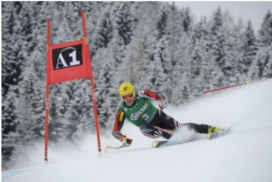
Slika 10. Natjecatelj u disciplini – superveleslalom

do 600 m, a za žene 400 m do 600 m. Vrata se sastoje od četiri slalomskih štapova sa zastavicama, a postavljena su naizmjenično plava i crvena. Širina vrata minimalno je 6 metara, a maksimalno 8 metara. Minimalan broj postavljenih vrata je trideset. Širina staze iznosi 30 m, a razmak između štapova je minimalno 25 m. Staza se postavlja na stazi za spust i vozi se jedna vožnja.