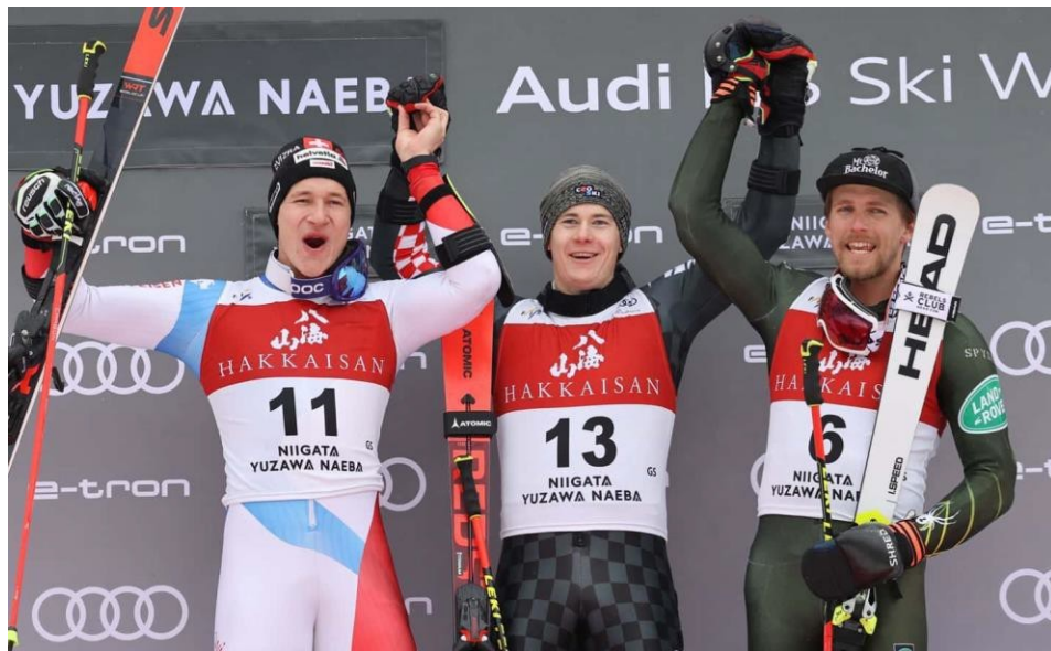
Slika 3. Natjecatelji na postolju