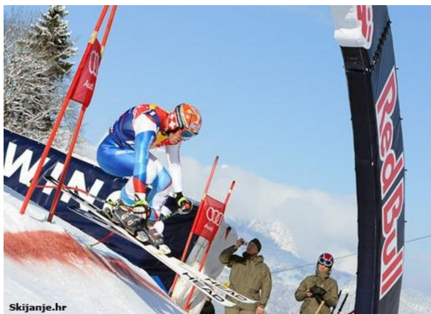
Slika 7. Natjecatelj u disciplini - spust

Glavne karakteristike staze za spust jesu: visinska razlika od 800 – 1100 metara za muškarce, odnosno 500 - 800 metara za žene. Vrata se sastoje od četiri slalomskih štapa i dvije zastavice međusobno udaljenih osam metara, staze su označene crvenim ili plavim vratima. Zastavice su pravokutnog oblika od tkanine širine 75 cm i visine 1 m. Nalaze se pričvršćene za štapove kako bi ih natjecatelj mogao vidjeti. Staze su široke oko 30 m. Spust kao disciplina u kojoj se postižu najveće brzine, mora biti dobro osigurana i ograđena zaštitnim strunjačama i mrežama dužinom cijele staze. Za ovu disciplinu natjecatelj mora biti maksimalno psihički i kondicijski spreman jer može doći do velikih ozljeda zbog velike brzine tijekom prolaska staze. Prije utrke, natjecatelj mora odraditi obavezno dva od tri moguća službena treninga. U spustu se uvijek vozi jedna utrka, a iznimka je ako je staza skraćena zbog vremenskih nepriklina, te se onda organizira vožnja dvije utrke.