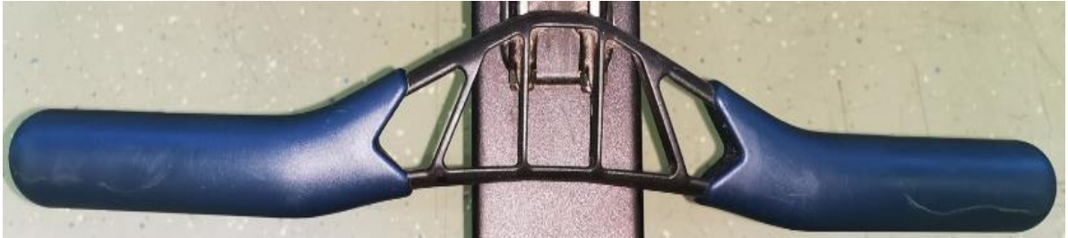
Slika 9. Drška na Concept2 veslačkom ergometru

Lancem povezana s bubnjem/zamašnjakom, simulira dršku vesla. Ergonomska, izrađena od plastike presvučena gumom.