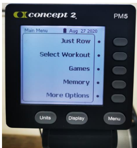
Slika 6. Concept2 monitor („displej“)

Više desetaka funkcija/prikaza, no od važnijih za trening veslača su prikaz/odabir dionice, prolaz na 500 m u minutama u realnom vremenu, prosjek prolaza na 500 m (u cijeloj odabranoj dionici) te broj zaveslaja u minuti.