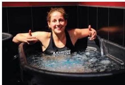
Slika 2. Hladna kupka.

Uranjanje u hladnu vodu je najčešće korištena metoda hlađenja u profesionalnom sportu. Sastoji se od uranjanja cijelog tijela u hladnu vodu ili lokalnog uranjanja, većinom ekstremiteta koji je bio pod najvećim stresom tokom neke aktivnosti. Temperatura takve vode mora biti <15°C i protokol obično traje nekoliko minuta. Postoji velik broj istraživanja koja su proučavala učinke hladnih kupki na oporavak sportaševa organizma, a vjeruje se da najveći učinak ima na smanjenje upale mišića (DOMS) te na bolju vlastitu percepciju umora (Bleakly i sur., 2012).