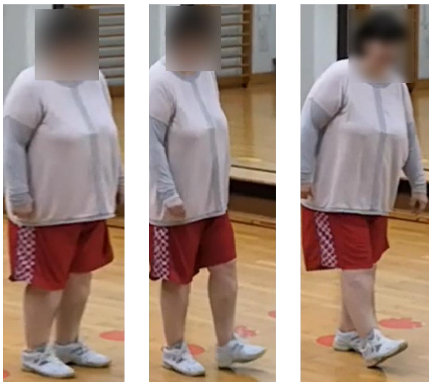
Slike 11-13. Prikaz izvođenja koraka Hill dig-a