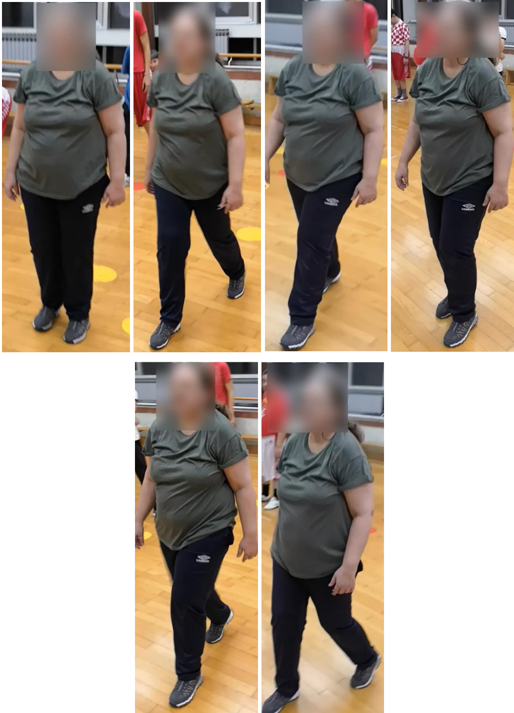
Slike 20-25. Prikaz izvođenja koraka Naprijed-Nazad