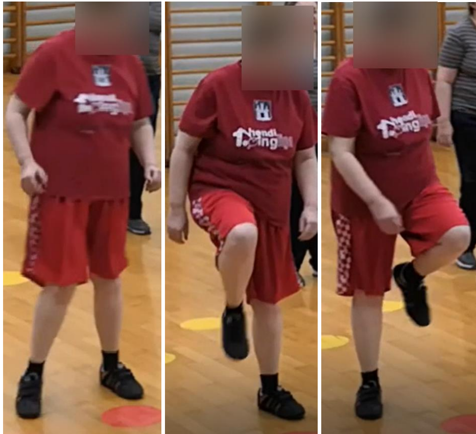
Slike 17-19. Prikaz izvođenja koraka March-a