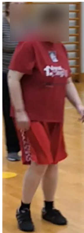
Slike 26-30. Prikaz izvođenja koraka Step touch-a