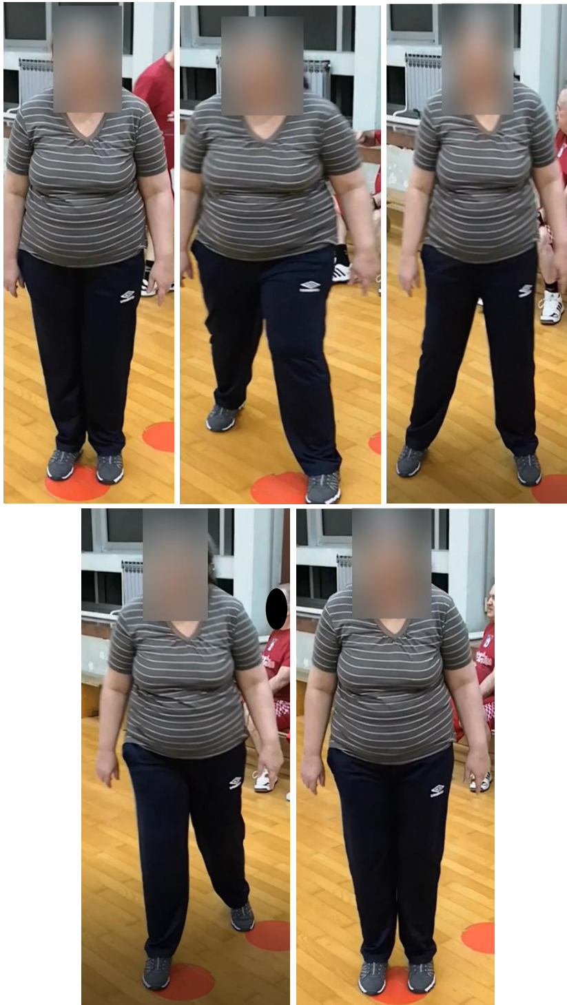
Slike 6-10. Prikaz izvođenja A-koraka