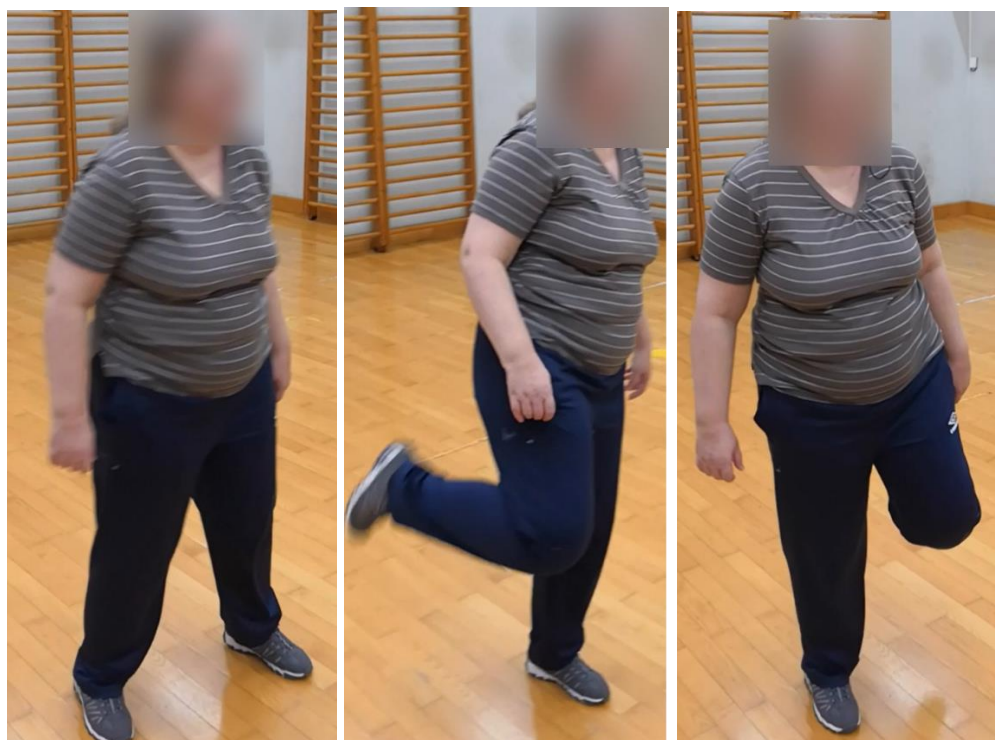
Slike 14-16. Prikaz izvođenja koraka Leg curl-a