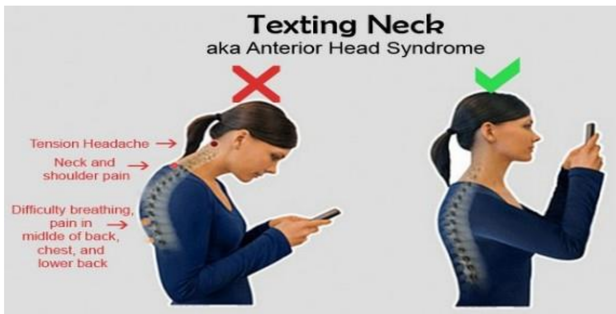
Slika 2. Preporuka pravilnog položaja držanja tijela u toku uporabe mobilnog uređaja

uređaja te daju određene preporuke kojih bi se trebalo pridržavati kako ne bi došlo do pojave boli te kako bi se spriječila pojava umora i glavobolja. Namwongsa i sur (2018a) donose preporuke da se edukativne intervencije, koje se bave pitanjima posture i upotrebe mišića, mogu pokazati korisnima u prevenciji ili liječenju poremećaja mišićno-koštanog sustava vrata kod korisnika pametnih telefona. Kim i Koo (2016) pružaju podatke o pravilnom preporučenom trajanju korištenja pametnih telefona – ispravno držanje (primjer prikazan na Slici 2) i odmori od najmanje 20 minuta preporučuju se pri korištenju pametnih telefona.