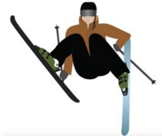
Slika 1 Fantomsko stopalo skijaša

Ranije je već navedeno "fantomsko stopalo" kao jedan od najčešćih mehanizama nastanka ozljeda prednjeg križnog ligamenta u rekreativnom skijanju. U ovoj situaciji, skijaš se nalazi izvan ravnoteže s padanjem trupa prema natrag te kukovima u razini ispod koljena. Jedna je ruka usmjerena prema nazad dok je gornji dio tijela cijeli okrenut prema padini. Ozljeda se događa u trenutku kada stražnji dio unutarnjeg ruba donje skije dođe u oslonac od snijeg, forsirajući time zglob koljena u unutarnju rotaciju i duboko flektiranu poziciju. Skija se tada ponaša kao poluga za okretanje ili savijanje koljena, stoga naziv "fantomsko stopalo" (25).