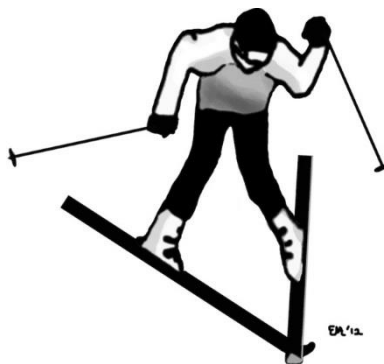
Slika 3. Mehanizam ozljede hiperekstenzija - unutarnja rotacija

Kombinacija hiperekstenzije i unutarnje rotacije (6) učestalo se događa na dubljem i teže prohodnijem snijegu. Ovi uvjeti dovode do iznenadnog zastoja kretanja skija što dovodi do toga da se noge momentalno zaustavljaju dok se gornji dio tijela još kreće kratko naprijed. Ovaj mehanizam se često naglašava kada se radi o neočekivanom križanju vrhova skija stvarajući pokrete unutarnje rotacije i varus silu na koljeno. Rezultat je obično ozljeda prednjeg križnog ligamenta te ponekada oštećenje lateralnih struktura koljena (25).