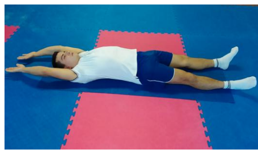
Slika 11: Odručenje