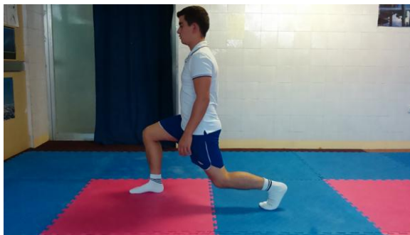
Slika 5: Zakoračiti jednom nogom prema naprijed

OPIS VJEŽBE: Iz uspravnog položaja zakoračiti jednom nogom u stranu, ruke opuštene uz tijelo, zadržati položaj 3 sekunde, vratiti se u početni položaj.