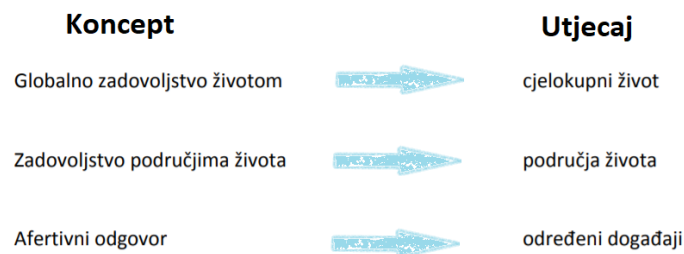
Slika 1. Koncepti zadovoljstva životom i njihov obuhvat

(Diener, 2006). Zadovoljstvo životom može se promatrati globalno i kao obilježje pojedinog dana ili kraćeg vremenskog razdoblja. Iako bismo mogli pretpostaviti da su mlađi ljudi zadovoljniji životom i sretniji, neka istraživanja su pokazala da zadovoljstvo raste u skladu s dobi (Mroczek i Kolarz, 1998; Penezić, 2006). U starijoj dobi ljudi imaju bolju ravnotežu pozitivnih i negativnih emocija i više emocija (i pozitivnih i negativnih) s nižom razinom uzbuđenja ili uznemirenosti (Pinquart, 2001).