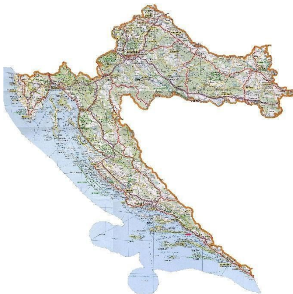
Slika 2. Ronjenje u Hrvatskoj

Hrvatski otoci obuhvaćaju gotovo sve otoke istočne obale Jadrana i njegova središnjega dijela, čineći drugo po veličini otočje Sredozemlja, a ima ih 1 246. (Mrežni izvor Hrvatska turistička zajednica)