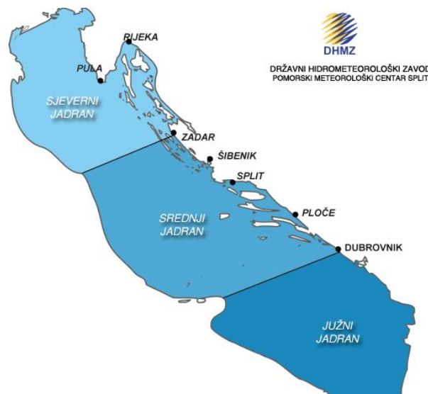
Slika 1. Karta podjele Jadrana