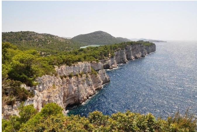
Slika 5. Park prirode Telašćica