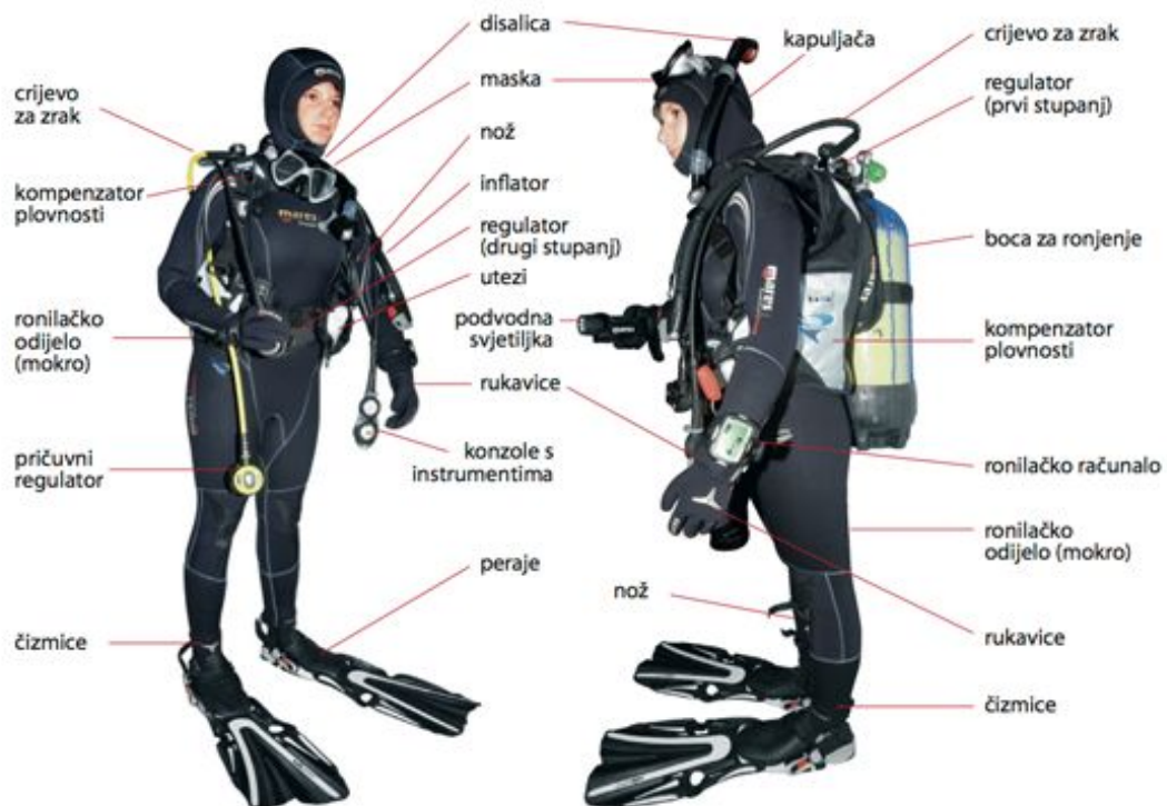
Slika 10. Ronilačka oprema