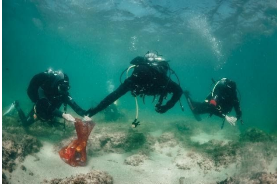
Slika 13: Ekološka akcija

Ovakve ekološke akcije u kojima sudjeluju i djeca trebaju biti dostupne široj javnosti kako bi se što više osoba uključilo u čišćenje podmorja.