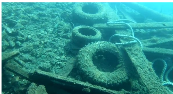
Slika 6: Gume u moru

Jadransko more je puno otpada i plastike dok je razina svijesti ljudi o važnosti očuvanja okoliša i prirode još uvijek je vrlo niska pa tako ljudi i dalje ostavljaju otpad na plažama ili ga bacaju u more, a plastika je jedna od glavnih prijetnji morskom ekosustavu.