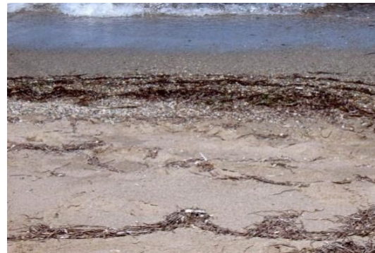
Slika 4. Posidonija na obali

Ugrožene su zbog ribolova povlačnim mrežama, sidrenja, nasipavanja zbog izgradnje obale, postavljanja kaveza za uzgoj ribe i onečišćenja od strane čovjeka. Zbog osjetljivosti i ugroženosti Posidonija je u Hrvatskoj i na europskoj razini strogo zaštićena vrsta, i štiti ju “Direktiva o zaštiti prirodnih staništa i divlje faune i flore Europske unije”.