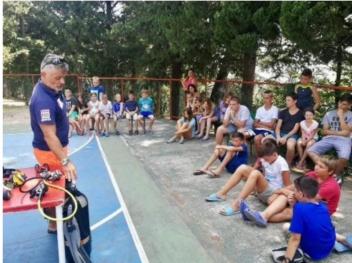
Slika 11. Edukacija djece

ljetni ronionci koji su gosti na lokacijama uvijek pokazuju entuzijazam i čiste koliko mogu, provode ekološke akcije i upozoravaju na problem onečišćenja Jadrana.