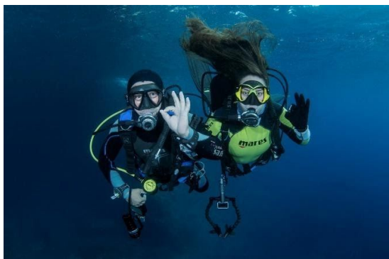
Slika 8. Ronjenje u paru s autonomnim ronilačkim aparatom