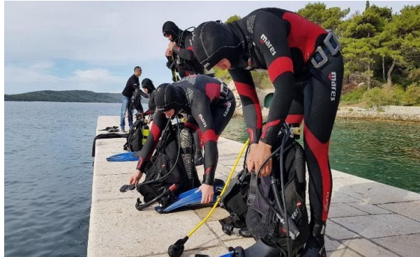
Slika 12. Tečaj ronjenja

Tijekom edukativnog dijela tečaja djeca i mladi imaju priliku upoznati termine kao što su stanište, hranidbeni lanac, bioraznolikost te različite organizme i koliko su oni ugroženi ljudskim djelovanjem s ciljem da se probudi entuzijazam kod djece za provođenje ekoloških odluka u svakodnevnom životu, a i tijekom boravka na moru i u moru.