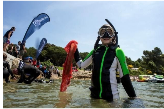
Slika 14: Dječja eko patrola