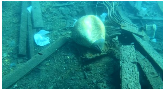
Slika 7: Plastika u moru