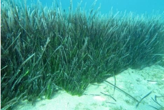
Slika 3. Posidonija

spužve, žarnjaci i poneke manje ribe. Iznimno su osjetljive jer sporo rastu i sporo se obnavljaju .