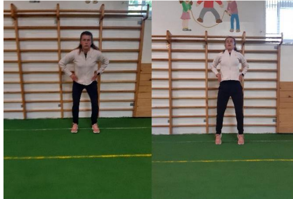
Slika 14. Vertikalni skokovi

najviša točka koju sportaš može dotaknuti iz stojećeg položaja. Utječe na brzinu i eksplozivnost i izvodi se 1 seriju od 10 ponavljanja