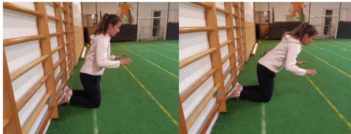
Slika 8. Nordic Hamstrings

položaj pustiti se u poziciju upora na rukama. Cilj vježbe je jačanje stražnje strane natkoljenice. Vježba se izvodi 1 seriju od 10 ponavljanja.