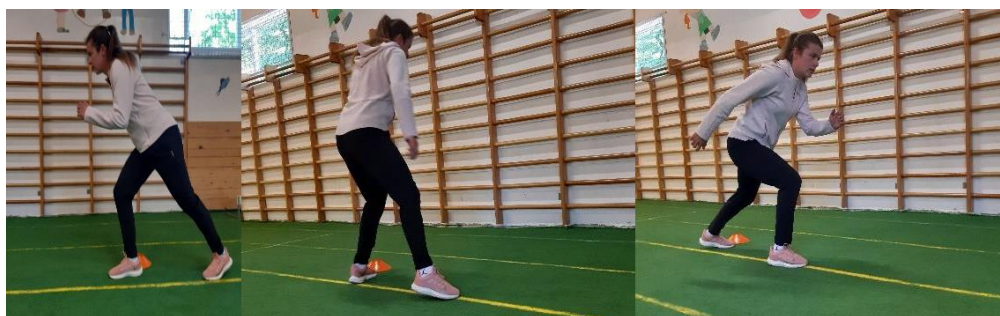
Slika 18. Sprint s promjenom smjera kretanja