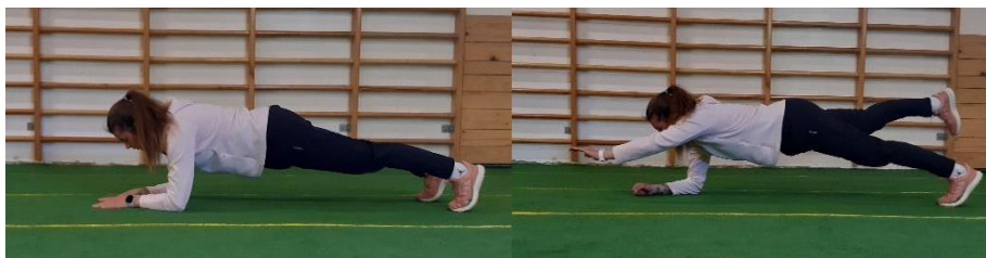
Slika 5. Upor prednji na podlakticama

Iz ležećega položaja na trbuhu postavljaju se podlaktice u širini ramena te se podupirujući na podlakticama i stopalima podiže tijelo koje bi trebalo biti u ravnoj liniji (Slika 5). Potrebno je podvući trbuh te stisnuti gluteuse kako bi se na taj način učvrstilo i stabiliziralo tijelo i izbjeglo uvijanje leđa. Cilj je ove vježbe jačanje i stabilizacija trupa. Druga varijanta upora prednjeg na podlakticama izvodi se na način da se istovremeno podignu suprotna ruka i suprotna noga (Slika 5). Vježba se izvodi 2 puta po 30 sekundi.