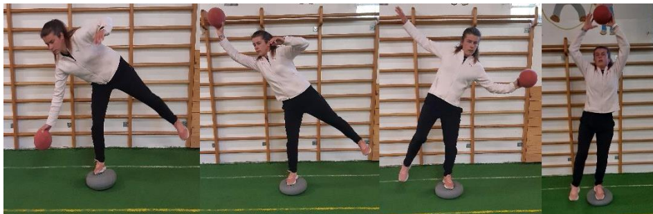
Slika 13. Izbacivanje iz ravnoteže

U stajanju na jednoj nozi, partner nam baca loptu čiji je smjer nepredvidiv, potrebno je uloviti loptu jednom rukom i prilikom izvođenja vježbe zadržavati ravnotežni položaj (Slika 13). Cilj ove vježbe je uhvatiti loptu bez narušavanja ravnoteže uz istovremeno postizanje stabilizacije gležnja. Vježba se izvodi 2 puta po 10 ponavljanja na svakoj nozi.