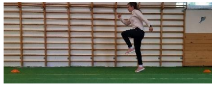
Slika 3. Visoki skip