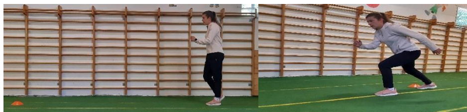
Slika 19. Niski skip-sprint

Vježba se izvodi na način da se iz pozicije niskog skipa koji se izvodi u mjestu na znak kreće u sprint 5 - 6 metara (Slika 19). Cilj vježbe je uz brzinu i agilnost utjecati i na brzinu reakcije. Vježba se izvodi 1 minutu.