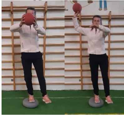
Slika 12. Bacanje i hvatanje lopte

U stajanju na jednoj nozi partner nam baca loptu, potrebno ju je uhvatiti i baciti natrag partneru bez narušavanja ravnoteže (Slika 12). Cilj vježbe je održati cijelo vrijeme ravnotežu i poboljšati stabilizaciju gležnja. Vježba se izvodi i na drugoj nozi, 2 puta po 10 ponavljanja na svakoj nozi.