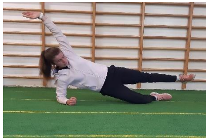
Slika 6. Upor bočni na podlacticama

Iz ležećega položaja na boku potrebno je postaviti lakat donje ili potporne ruke ispod ramena, s koljenom donje noge savijene po 90° (Slika 6). Iz tog položaja potrebno je podići gornji dio tijela dok rame, kuk i koljeno ne budu u ravnoj liniji. U tom položaju odložiti i uzručiti slobodnu nogu i ruku, uz zadržavanje kralježnice u neutralnom položaju. Položaj zadržati 30 sekundi, napraviti kratku pauzu, promjeniti stranu i ponoviti vježbu. Cilj ove vježbe je jačanje i stabilizacija trupa. Vježbu izvoditi 2 puta po 30 sekundi sa svake strane.