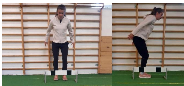
Slika 16. Skokovi preko prepona