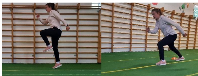
Slika 20. Visoki skip-sprint

Vježba se izvodi na način da se iz pozicije visokog skipa koji se izvodi u mjestu na znak kreće se u sprint 5 - 6 metara (Slika 20). Vježbom se utječe i na brzinu reakcije i izvodi se 1 minutu.