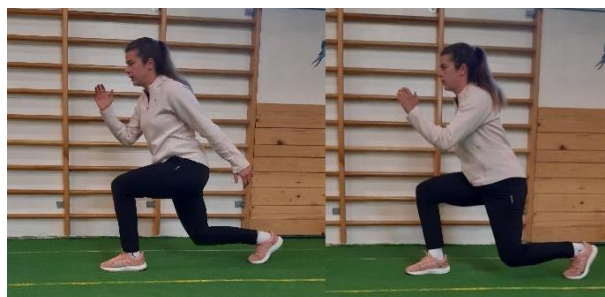
Slika 17. Isokrak sa skokom

Iz početne pozicije u iskoraku pogled usmjeriti prema naprijed, izravnati leđa i zategnuti trbušne mišiće (Slika 17). Potrebno se snažno odraziti u vis, promijeniti nogu te doskočiti ponovno u poziciju iskoraka. Prilikom odraza pomaže nam zamah ruku koji daje dodatnu silu za veći i snažniji odraz. Pokret treba kontrolirati te prilikom doskoka paziti da koljeno ne “bježi“ u stranu. Cilj vježbe je postići stabilnost cijelog tijela te jačanje i stabilizacija koljena. Vježba se izvodi 1 seriju od 10 ponavljanja