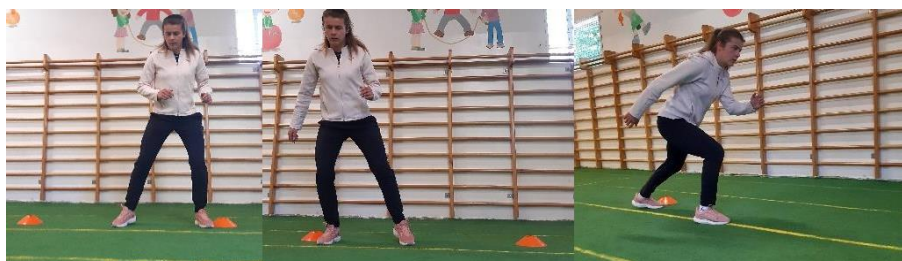
Slika 21. Bočno-sprint

Kapice označavaju prostor u kojemu se sportaš kreće bočno. Na znak, iz bočnog kretanja kreće se u sprint 5 - 6 metara (Slika 21). Vježbom se uz brzinu i agilnost utječe i na brzinu reakcije. Izvodi se 1 minutu.