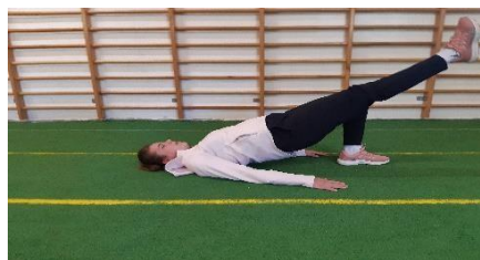
Slika 7. Jednonožni mali most

Iz ležećeg položaja na leđima potrebno se rukama i gornjim dijelom tijela poduprijeti o podlogu, postaviti stopala čvrsto na pod te saviti koljena po 90°. Istovremeno pružiti jednu nogu te podići kukove prema gore (Slika 7). Tijekom izvođenja vježbe potrebno je imati aktivne mišiće trupa i gluteus. Cilj ove vježbe je jačanje i stabilizacija trupa. Vježba se izvodi 2 puta po 30 sekundi.