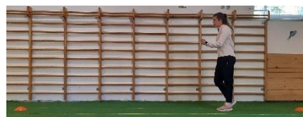
Slika 2. Niski skip

Vježba se izvodi u kretanju od kapice do kapice koje su postavljene na udaljenosti 5 - 6 metara (Slika 2). Prilikom izvođenja vježbe potrebno je paziti na pravilnu poziciju tijela, poziciju stopala-prsti-peta te ruke koje prate ritam nogu (suprotna ruka, suprotna noga). Vježba se izvodi 1 minutu.