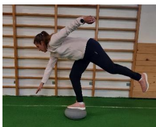
Slika 11. Prednja vaga

U stajanju na jednoj nozi, potrebno je predručiti i suprotno zanožiti, spuštati se u poziciju vage te rukom dotaknuti oznaku na podu (Slika 11). Vježbu ponoviti na drugoj nozi s promjenom ruke. Vježba se izvodi 2 puta po 10 ponavljanja na svakoj nozi.