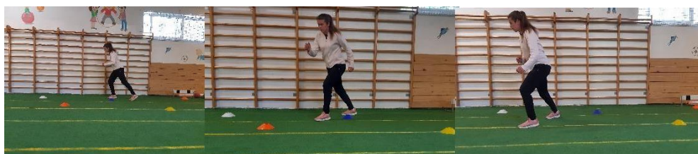
Slika 22. Cik-cak

Kapice su postavljene dijagonalno jedna od druge i označavaju smjer kojim se sportaš kreće. Vježba se izvodi trčeći cik-cak (zig-zag) s naglaskom na promjeni smjera kretanja (Slika 22). Cilj vježbe je specifičnim pokretima u rukometnoj igri i treningu smanjiti mogućnost povrede prednjih križnih ligamenata. Vježba se izvodi 1 minutu.