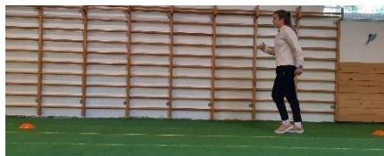
Slika 1. Trčanje ravno naprijed

Trči se ravno naprijed od kapice do kapice koje su postavljene na udaljenosti 5 - 6 metara (Slika 1). Prilikom izvođenja vježbe potrebno je paziti na pravilan položaj tijela, trči se na prstima i pazi se na suprotnu ruku i suprotnu nogu. Vježba se izvodi 1 minutu.