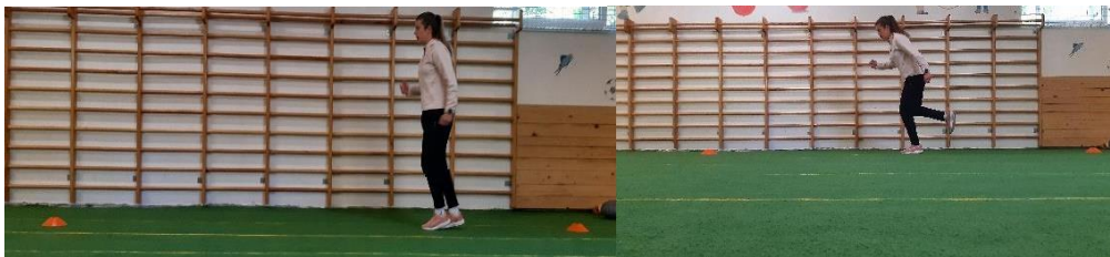
Slika 4. Jednonožni doskok

Vježba se izvodi u kretanju prema naprijed na udaljenosti 5 - 6 metara (Slika 4). Trči se ravno naprijed i svakih 1 -1,5 metar treba doskočiti na jednu nogu te zadržati položaj par sekundi pa nastaviti dalje trčati s ponavljanjem vježbe 1 minutu.