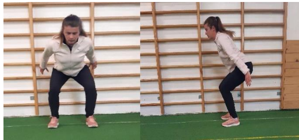
Slika 15. Čučanj-skok

Iz polučučnja uz zamah ruku skaće se visoko prema gore te doskače u istu poziciju uz kontinuirano izvođenje pokreta ( Slika 15). Važno je da prilikom doskoka koljena ne odlaze prema unutra nego da prate smjer stopala te je jednako važno amortizirati doskok. Cilj vježbe je jačanje i stabilizacija koljena. Vježba se izvodi 1 seriju od 10 ponavljanja.