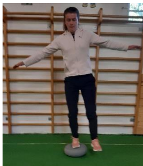
Slika 9. Stajanje na 1 nozi

Na zračnom jastuku potrebno je održavati ravnotežu na jednoj nozi ( Slika 9). Vježba se može izvoditi sa otvorenim i zatvorenim očima a cilj vježbe je, uz unapređenje ravnoteže, povećati stabilnost u zglobu gležnja. Nakon isteka vremena, mijenja se noga. Vježba se izvodi 1 minutu.