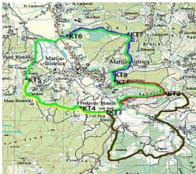
Slika 5. Planinarska obilaznica " Duša i tijelo"