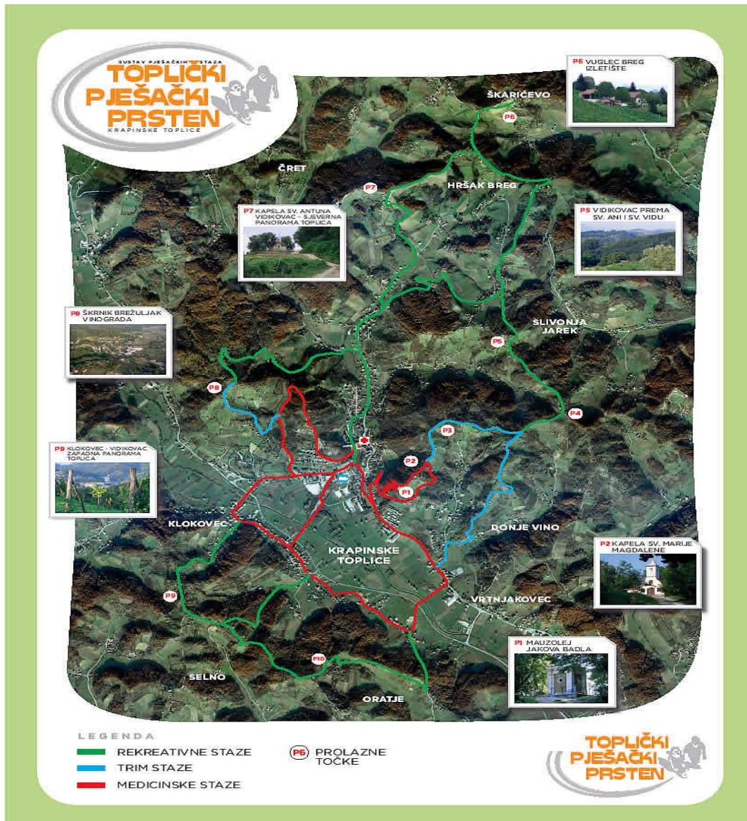
Slika 3. Toplički pješački prsten

Pješačke staze sastoje se od tri dijela koja obuhvaćaju različite dijelove Hrvatskog zagorja. Prvi dio čini takozvani Toplički pješački prsten (Slika 3) (Visit zagorje.hr, 2020) obuhvaća područje Krapinskih Toplica te pruža više staza, od onih manje zahtjevnijih za rekreativce, do dužih i strmijih za naprednije pješake i planinare.