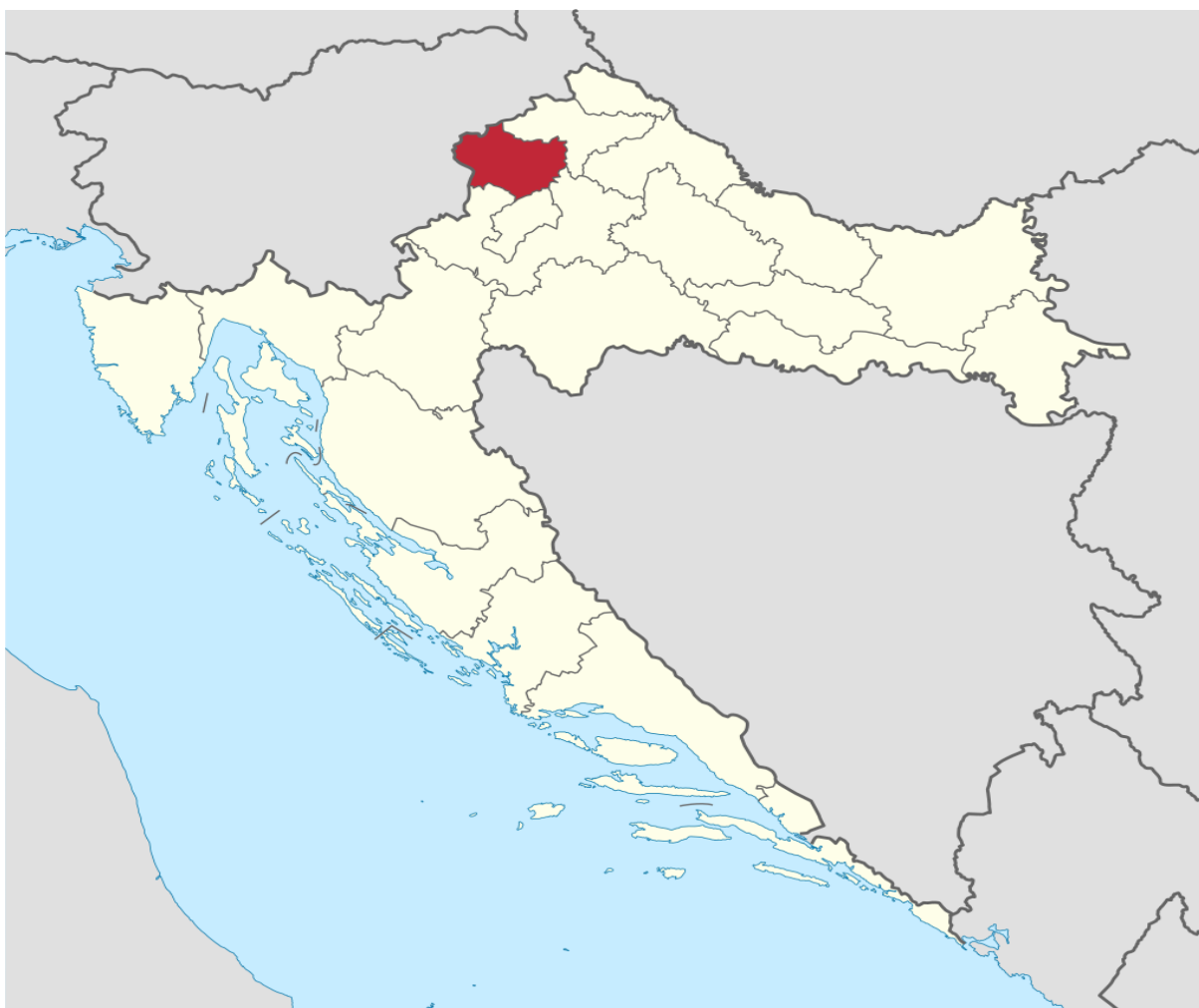
Slika 1. Zemljopisni položaj Krapinsko-zagorske županije

Krapinsko-zagorska županija smještena je u sjeverozapadnom dijelu Republike Hrvatske i pripada prostoru središnje Hrvatske (slika 1). Zasebna je geografska cjelina koja se pruža od Macelja i Ivanšćice na sjeveru do Medvednice na jugu. Zapadna granica je rijeka Sutla koja je ujedno i državna granica s Republikom Slovenijom, dok je istočna granica porječje rijeke Krapine i Lonje. Ovako razgraničen prostor županije podudara se s prirodnom regijom Donje Zagorje (Krapinsko-zagorska Županija, 2019).