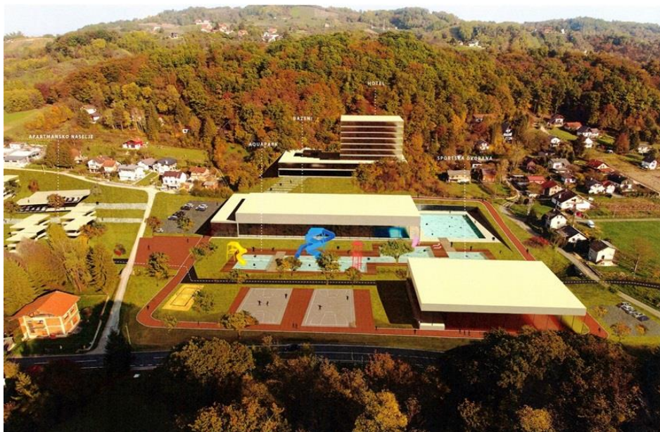
Slika 2. Projekt Šemničke toplice

Sutinske i Šemničke toplice nisu u funkciji zbog neriješenih imovinsko-pravnih pitanja, no unatoč tome, imaju mnoge kvalitete, potencijale i preduvjete za uspješan razvoj i poboljšanje turističke ponude. Potencijali i kvalitete za daljnji napredak i razvoj najbolje se očituju u projektu „Projekt za razvoj Šemničkih toplica“ (Slika 2) sadržan u Master planu razvoja turizma Krapinsko-zagorske županije, Strategiji razvoja Krapinsko-zagorske županije te u Strategiji razvoja Grada Krapine. Projekt je osnovan u svrhu revitalizacije Šemničkih toplica i postojećeg geotermalnog izvora kojim se planira gradnja turističko rekreacijskog kompleksa za razvoj sportsko-kupališnog turizma (Zagorje.com, 2021). Glavni dio građevine sadržavat će dva natkrivene olimpijska bazena sa tribinama za sjedenje, a u planu su i wellness i teretana. Na vanjskom dijelu bit će smješteno otvoreno parkiralište, dječji bazen, bazen s hidromasažama, vanjski tobogani, terasa te sunčalište (Jutarnji.hr, 2020.). Procjena vrijednosti izrade ovog projekta iznosi 995 000 kuna, od čega Ministarstvo regionalnog razvoja i fondova Europske unije odobrava sufinanciranje u iznosu od 600 000 kuna, Krapinsko-zagorska županija izdvojit će iznos od 100 000 kuna, a ostatak sufinancira Grad Krapina (Zagorje.com, 2021).