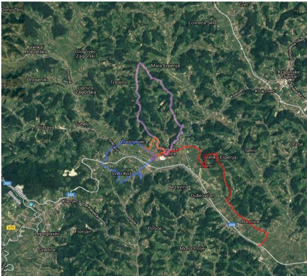
Slika 4. Karta pješačke staze Tuhelj