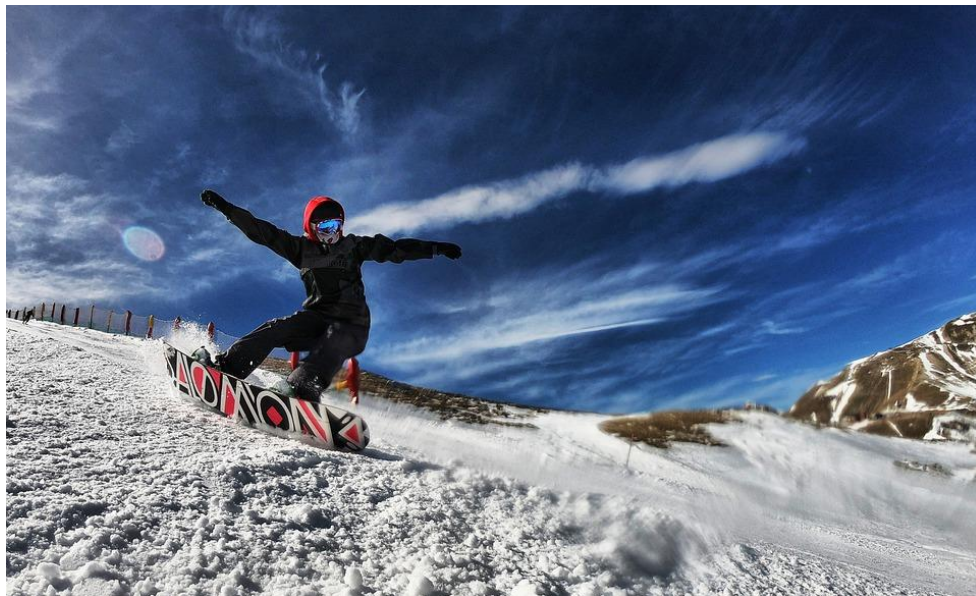
Slika 4. Daskaš na snijegu

2018). 70-ih godina prošlog stoljeća, kalifornijski surferi htjeli su surfanje na valovima prenijeti na snijeg (Brisick, 2004). Surfanje na valovima i daskanje na snijegu dijele sličnu terminologiju, obrazac kretanja motoričkog gibanja te modni stil (Künzell i Lukas, 2011). Popularizaciju sporta omogućilo je daskanje po snijegu po uređenim, neuređenim skijaškim stazama te snježnim parkovima. Početnici daskanja na snijegu najčešće su djeca i mlađa populacija. Oprema se sastoji od cipela, daske i vezova. Kao i kod alpskog skijanja, cipela za daskanje na snijegu najvažniji je dio opreme. Pomoću nje se upravljaju sve kretnje te se prenosi sila na dasku. Stopalo mora dodirivati stijenke uložka što znači da ne smije biti prevelika. Daske su danas najčešće konveksnog oblika između vezova. Pri odabiru odgovarajuće daske važno je uzeti u obzir tjelesnu težinu, visinu i veličinu stopala. Dužina daske trebala bi biti između brade i nosa daskaša. Širina daske proporcionalna je veličini stopala. Vez na dasci prenosi silu pokreta na samu dasku te omogućava sigurnu i čvrstu vezu između veza i cipele. U početku se preporuča korištenje mekših vezova. Kao i u svim sportovima na snijegu, preporuka je korištenje kacige radi smanjenja težine i broja ozljeda (Vrdoljak, 2019).