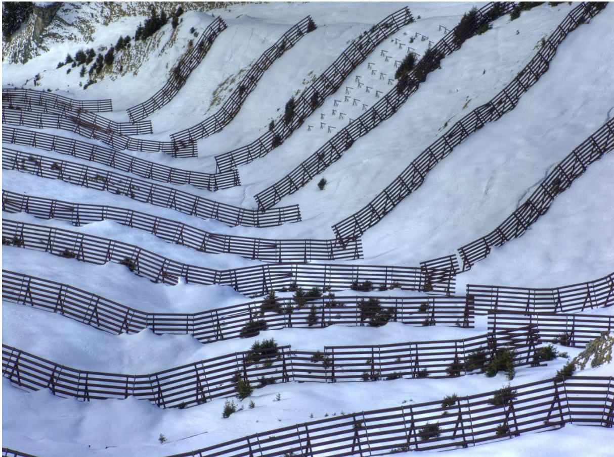
Slika 5. Pasivna obrana od lavine

nanose snijega na padinama koji se nalaze u zavjetrini. Nagla povišenja temperature događaju se najčešće u proljeće pa u tim mjesecima treba biti izrazito oprezan (Gamma, 1982). Veliki skijaški centri provode prevenciju od lavina. Pasivna obrana sastoji se od zidova i ograda koje zadržavaju, usporavaju i skreću tok lavina. Aktivnom obranom lavina se pokreće kontroliranim eksplozijama. Postoji mogućnost bacanja eksploziva iz helikoptera ili spuštanje eksploziva posebnom žičarom (HZUTS, 2017).