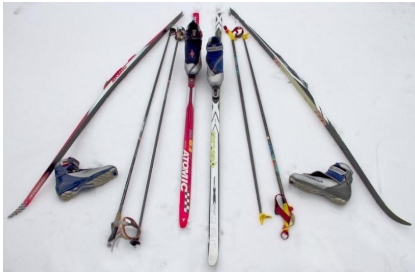
Slika 3. Oprema za skijaško trčanje

Skijaško trčanje najpopularnije je u skandinavskim zemljama. Primjenjivo je u svim dobnim skupinama zbog malog rizika od ozljeđivanja te pozitivnog utjecaja na zdravlje (Cigrovski, Matković i Matković, 2008). Smatra se da je skijaško trčanje najučinkovitiji i najzdraviji oblik sportske rekreacije te jedna od najzahtjevnijih aerobnih aktivnosti. Tijekom aktivnosti zastupljena je cijela muskulatura ("Skijaško trčanje"). Skijaški trkači snažno se odguruju skijaškim štapovima te su iz tog razloga mišići ruku, ramenog pojasa i trupa opterećeni znatno više u odnosu na atletske trčanje. Skije su znatno uže i duže od skija za alpsko skijanje. Također, štapovi za skijaško trčanje duži su i omogućavaju efikasno i snažno odgurivanje od podloge. Prsti na stopalu su pričvršćeni za skijaški vez te omogućavaju potisak na skiju i odgurivanje. Pete nisu pričvršćene za skijaški vez te se podižu od površine skije ("Skijaško trčanje"). Oprema je u odnosu na alpsko skijanje laganija, jeftinija i udobnija. Skijaške karte se ovisno o skijalištu ne naplaćuju ili su znatno jeftinije od skijaških karata za alpsko skijanje ("Skijaško trčanje").