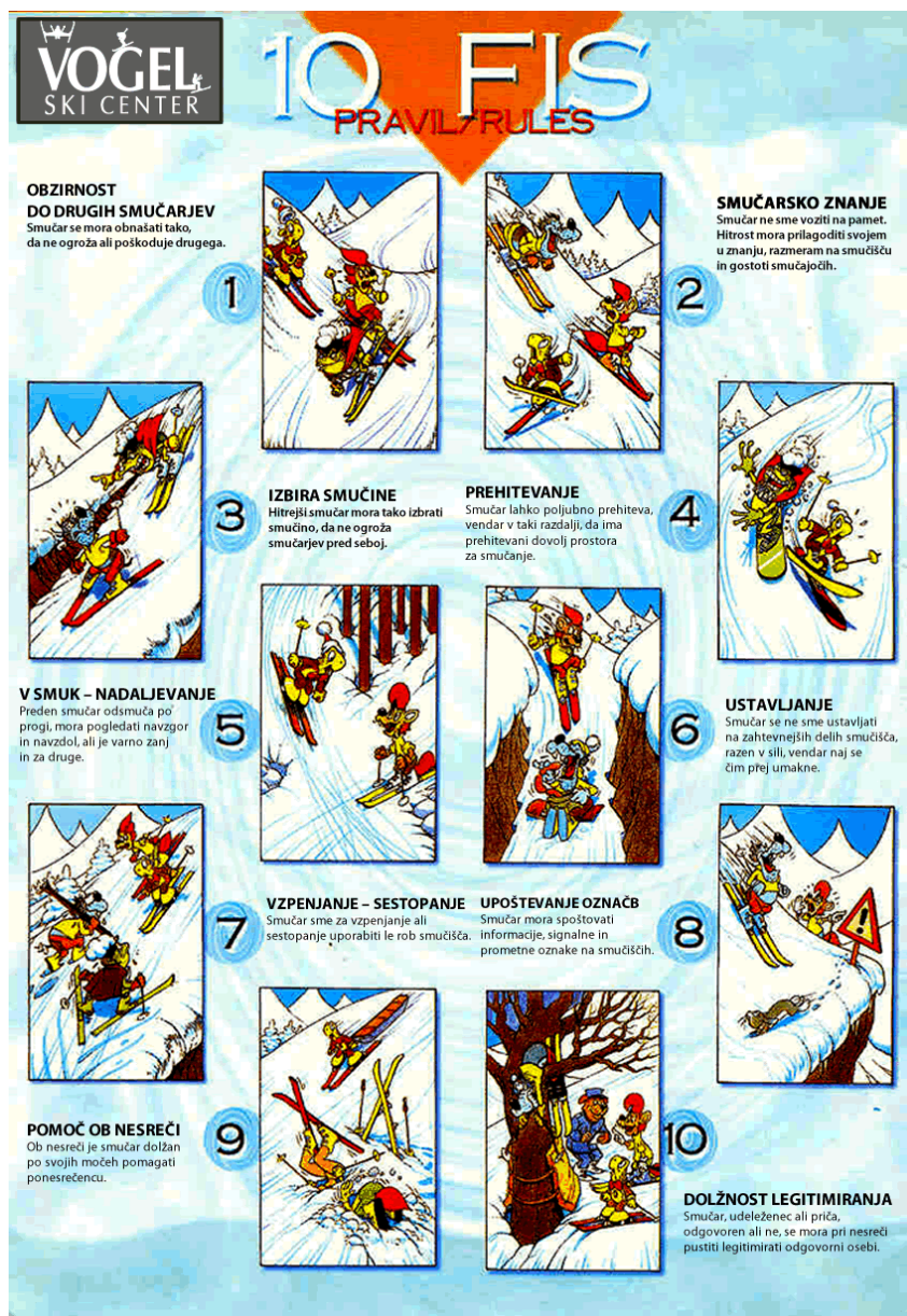
Slika 6. FIS pravila ponašanja na skijaškimi stazami