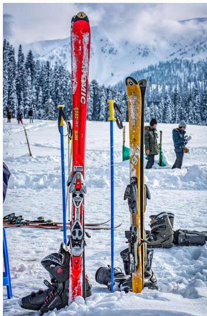
Slika 2. Oprema za alpsko skijanje

Alpsko skijanje je sport koji u svijetu bilježi kontinuirani porast broja rekreativnih skijaša (Cigrovski, 2018). Taj trend javlja se i u Hrvatskoj gdje se preko 200.000 osoba bavi alpskim skijanjem na rekreativnoj razini (Kolarić, 2020). Osnovu skijašku opremu čine skije, skijaške cipele, skijaški štapovi te skijaški vezovi. Skijaško odijelo, kaciga (djeca od 14 godina su obavezna nositi skijašku kacigu), krema za lice, skijaške naočale i rukavice spadaju pod dodatnu opremu (HZUTS, 2017). Visina skija trebala bi biti 12,5 cm kraća od visine skijaša početnika i 11,5 cm kraća od visine naprednih skijaša (Kolarić, 2020). Skijaška cipela mora odgovarati stopalu skijaša. Premala cipela žulja, stopalo trne te dolazi do pojave hladnoće. S druge strane, u prevelikoj skijaškoj cipeli stopalo ne prenosi pokret na cipelu te preko nje na skijaški vez i skiju. U tom slučaju skijaš teže napreduje te je veća mogućnost ozljede potkoljenice i gležnja. Početnicima i slabijim skijašima preporuča se skijaška cipela tvrdoće flex indeksa 50-70, skijašima srednjeg skijaškog znanja 70-90, a napredni skijaši, učitelji skijanja i demonstratori skijanja najčešće skijaju u cipelama flex indeksa 90-120. Postoje i tvrđe skijaške cipele s indeksom 130-140 i 150 koje koriste samo natjecatelji (HZUTS, 2017).