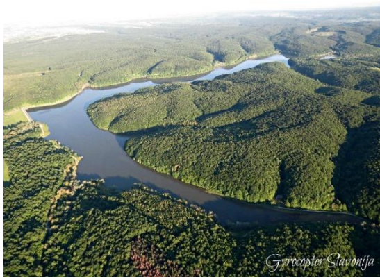
Slika 10. Jezero Borovik