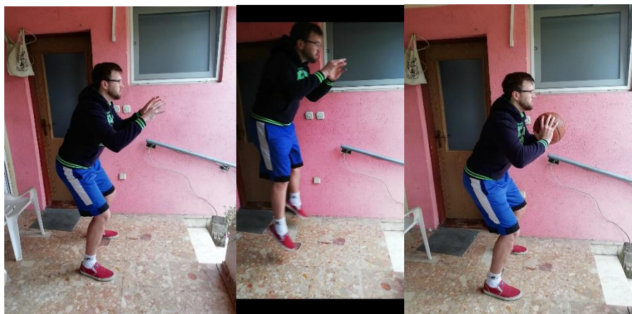
Slika 22. hvatanje lopte u skoku iz obrambenog košarkaškog stava

Sportaš se nalazi u obrambenom košarkaškom stavu bez lopte. Na znak trenera sportaš sunožno skače prema naprijed i prima loptu koju mu dodaje trener. Ovu vježbu je moguće kasnije dodatno zakomplicirati na način da se sportaš odražava s jedne noge, a prilikom doskoka isto tako je moguć doskok na jednu nogu ili na obje noge što je za početak sigurnija solucija. Potrebno je odraditi 10 skokova u 2-3 serije (slika 22.).